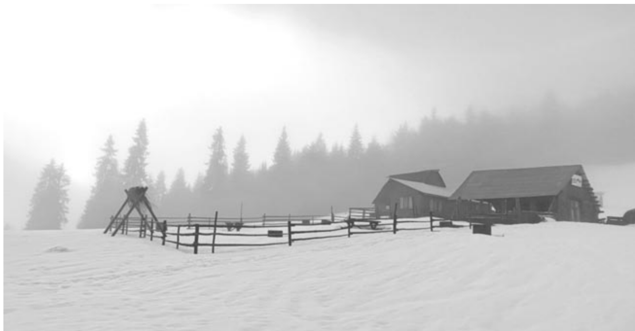
Pádes – kibontja fehér félkörét a pára

Maradok kiváló tisztelettel. Kelt 2024-ben, nyolcvan évvel a doni tragédia után