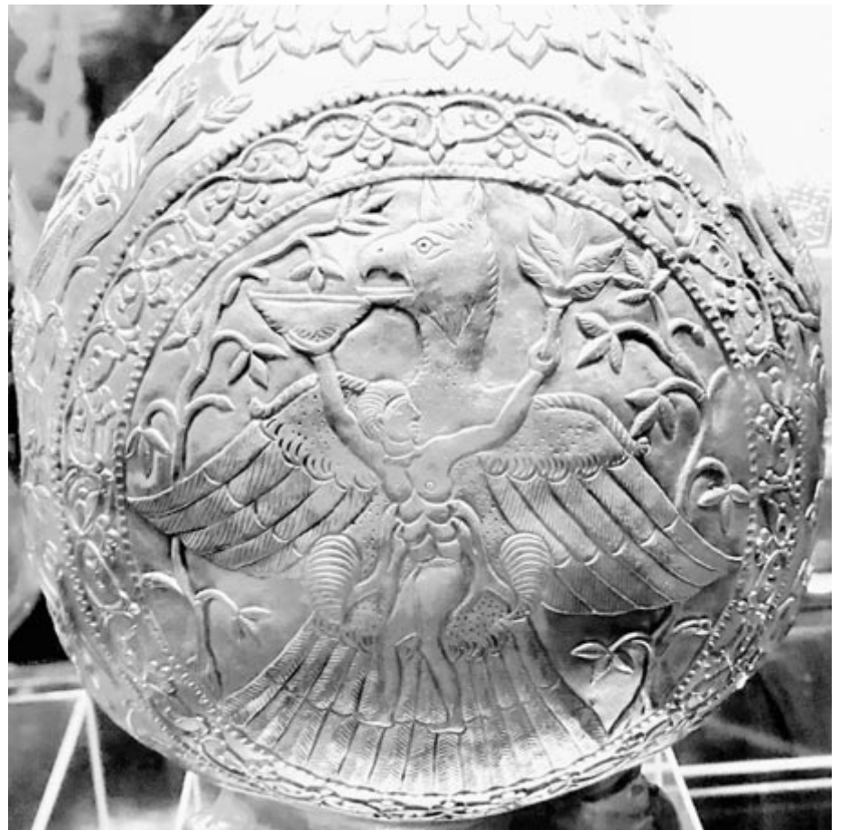
A nagyszentmiklósi kincs 2. számú korszójának égbe ragadási jelenetén a fattyúszárny tökéletesen látható

Január 12-én, 1964-ben költözött örök hévizei birodalmába a Bolyaiakkal – no meg a családdal is – rokon háromszéki gyökerű Pávai Vajna Ferenc geológus. Papp Simon kőolajkutatóval, Böckh Hugó geológus munkatársaként kezdte pályáját az erdélyi, horvátországi és dunántúli földgázkutatóknál. Az I. világháború után, amikor Böckh és Papp külföldre távozott, tovább folytatva kutatásait, talált rá a Hajdúszoboszló–Debrecen–Karcag háromszögben a nagy kapacitású, magas hőmérsékletű artézi gyógyvízmezőre. A gyógyászati alkalmazás mellett ő hívta fel a figyelmet a hévizek geotermikus energiájának, a földhőnek a hasznosítási lehetőségeire. Ezt a gondolatát csak napjaink gyakorlatában kezdik igazán értékelni és megvalósítani. A szénhidrogén-kutatáson és hidrológiai tevékenységen kívül életművének jelentős részét képezik tektonikai és barlangá-