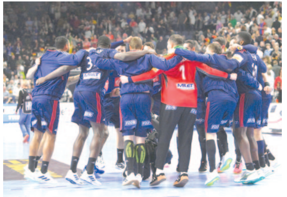
A győztes francia csapat tagjai ünnepelnek

A torna álomcsapata: * kapus: Andreas Wolff (német) * balszélső: Hampus Wanne (svéd) * balátlövő: Martim Costa (portugál) * irányító: Juri Knorr (német) * jobbátlövő: Mathias Gidsel (dán) * jobszélső: Robert Weber (osztrák) * beálló: Ludovic Fabregas (francia) * védekező játékos: Magnus Saugstrup (dán) Gólkirályok: Martim Costa Martim 54 gól (7 mérkőzés, 81 lövés) és Mathias Gidsel 54 gól (8 mérkőzés, 66 lövés)