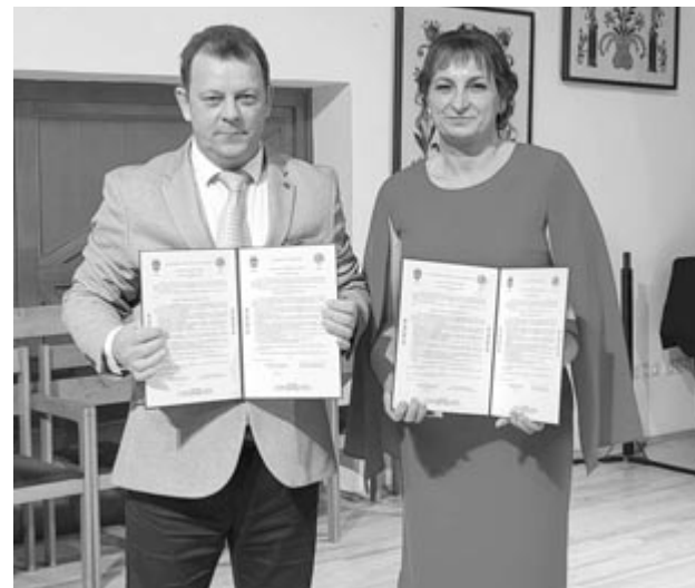
A tíz éve fennálló partnerkapcsolatot erősítette meg a két település

Az eseménynek a 23. kakasdi disznóvágás nevű rendezvény adott keretet. A 2001-ben kezdeményezett rendezvényen kezdetben a helyi svábok sűrűgtek-forogtak, később a helyi bukovinai székelyeket, majd a felvidékieket