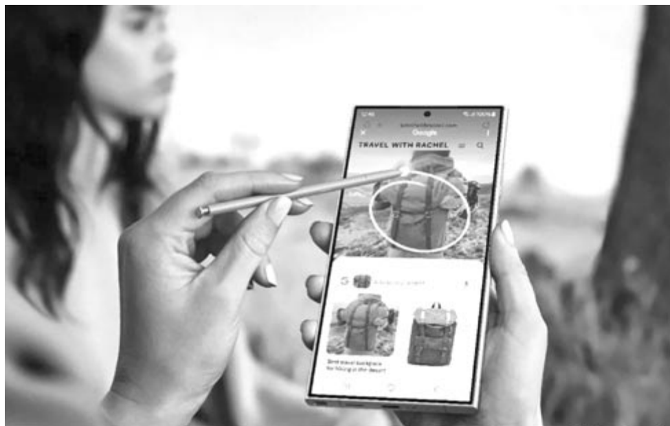
Circle Search, illusztráció

Szintén a képeknél maradva, a Samsung a kamera és a galéria esetén is ráerősített a mesterségesintelligencia-alapú képességekre. Az egyik ilyen megoldás a generatív szerkesztés, aminek akkor van haszna, hogyha a felhasználó elfordít egy képet, és kétoldalt megjelenik egy üres tér. Ezt tudja kitölteni a mesterséges intelligencia. Továbbá arra is lehetőséget kínál az S24 szériába beépített AI, hogy a felhasználó a tökéletes kompozíció érdekében elmozdítson egy tárgyat, az elmozdított tárgy helyére pedig az AI hátteret is generál. A videók esetében pedig ott van az Instant Slow-mo funkció, amely extra kép-