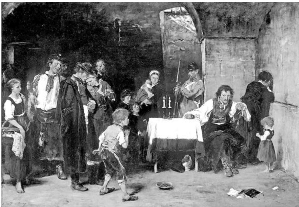
Az 1870-es párizsi Szalon nagy aranyérmével kitüntetett Siralomház másolata, az első képet 1869-ben még félig kész állapotban eladta

A 2025. január 5-ig megtekinthető tárlat nemrég egészült ki két újabb, mostanáig restauráció alatt állt képpel: a két tanulmány 1869-ben készült a Siralomház című festményhez. Munkácsy Mihály a Siralomházat fotótanulmányok sorával készítette elő; a festmény megalkotásához festette meg a tanulmányportrékat a fényképek felhasználásával. (MTI)