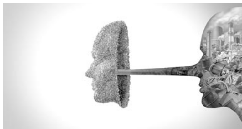
Green Washing, illusztráció

Ezek a jogszabályok, amikor életbe lépnek, mindenképpen előrelépést fognak hozni. Sajnálatos módon ezek segítségével sem lehet majd teljes mértékben meggátolni a csalásokat, viszont egy EU-s címke láttán a jövőben joggal gondolhatják azt a vásárlók, hogy közel valós az az állítás, ami ezeken szerepel.