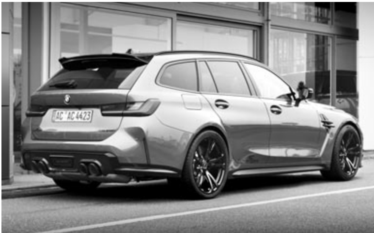
BMW M3 Touring, a harmas sportváltozatának kombi verziója

Az M3 kombi változatának sikere nagyon jó hír a gyártó számára, mivel a közeljövőben a tervek szerint megérkezik az M5 Touring is. Ami pedig a jövőt illeti, nem kizárható az a forgatókönyv, hogy a BMW a hódfogakat más típusokon is használni fogja, hiszen a gyakorlat azt mutatja, hogy sikeresek.