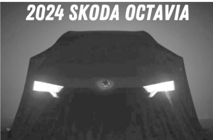
A még letakart, februárban érkező ráncfelvarrott Skoda Octavia

A nyár vége óta sok információ nem került napvilágra, egészen mostanáig. A hónap első felében a cseh gyártó boldog új évet kívánt, egy videó formájában, a követőinek, és ezen látszik letakarva a ráncfelvarrott Octavia. A kép tanúsága szerint a nappali menetfény a lámpatesten kívül a hűtőmaszk felé húzódik el, de az igazán érdekes dolog az embléma, amely a videóban világított, átvilágította a takarót. Egyelőre nem tudni, hogy ez csak egy trükk, vagy valóban világítani fog a frissített Octavián a Skoda logó. Mindenesetre, ez sok embernek felkeltené az érdeklődését. Komoly az esély arra, hogy ez valóság legyen, ugyanis a 2023 végén megjelent ráncfelvarrott Volkswagen Touareg esetében is világít a hátsó embléma, nem kizárt, hogy ezt az Octavia is megkapja.