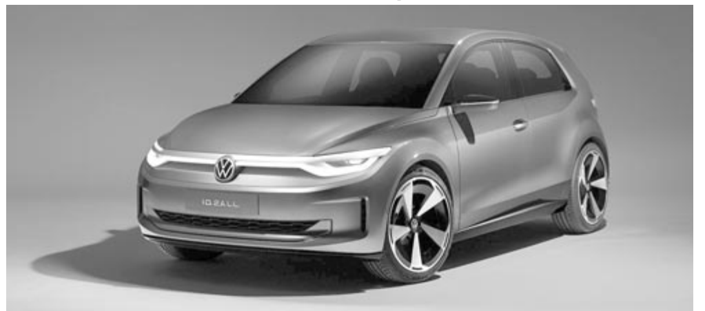
Volkswagen ID.2all koncepció