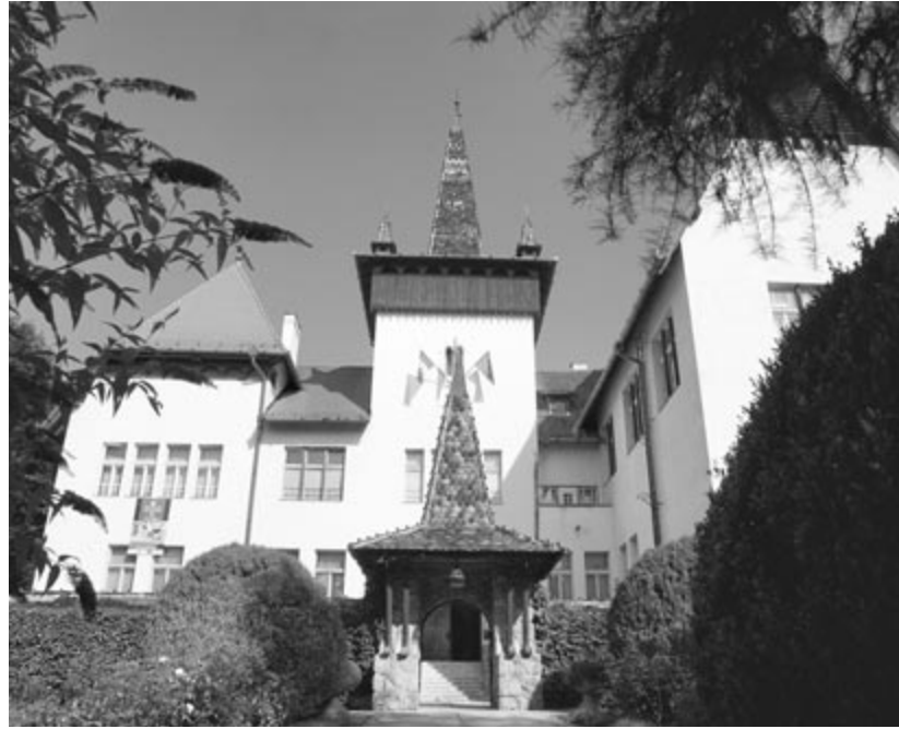
A Székely Nemzeti Múzeum