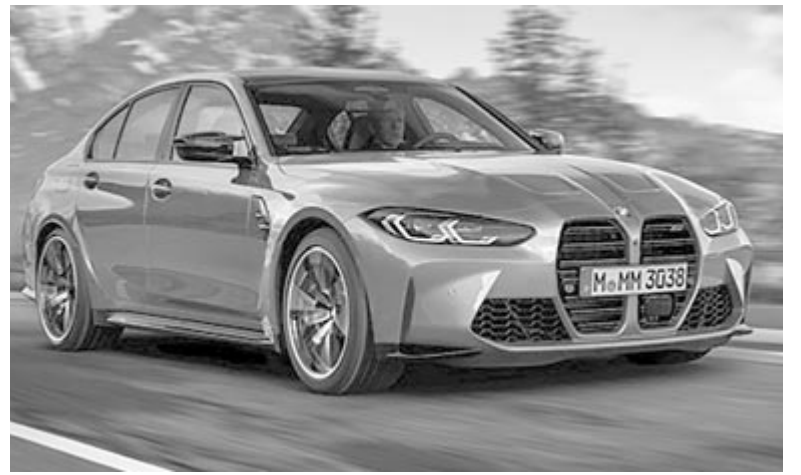
A „hódfogas” négyes BMW

Az eladási adatok meggyőzőek, viszont érdemes figyelembe venni két fontos tényezőt, ami segíthette az eladási mutatók növekedését. Egyrészt ott volt 2020 és 2021, amikor a koronavírus, illetve az azt követő, ellátási láncokban tapasztalt fennakadások miatt minden gyártónak csökkentek az eladásai, hiszen a hiányzó alkatrészek okán egyszerűen nem tudtak termelni. Az említett két évhez képest lényegében minden gyártó képes volt növelni az eladásait. A másik fontos szempont, hogy a jelenleg kapható hetesből és négyesből sokkal több