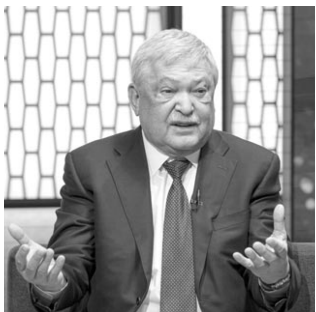
A Magyar Labdarúgó Szövetség (MLSZ) elnöke, Csányi Sándor interjút ad az M4 Sport csatornaigazgatójának, Székely Dávidnak az MTVA Kunigunda újtá stúdiójában 2024. január 29-én.

Csányi Sándor beszélt a válogatott programjáról is. „Ki-