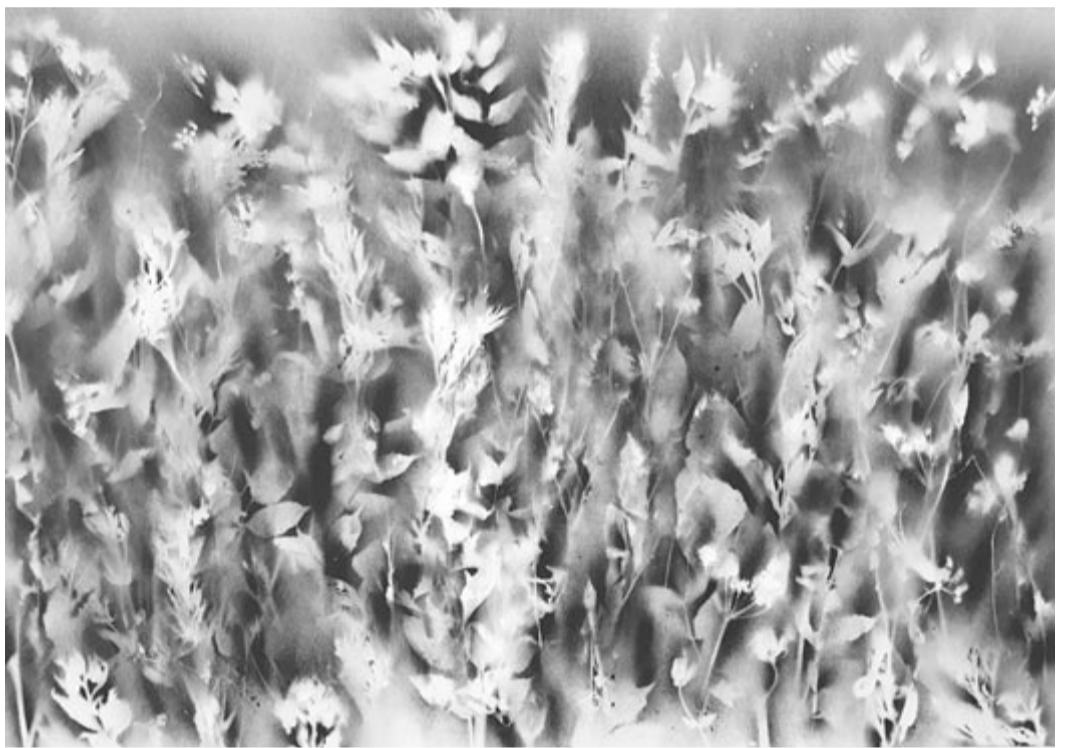
Lucza Zsigmond grafikája a Bernády Házban

Megjelent az Élet és Irodalom LXVIII. évfolyama 4. számának Vers rovatában 2024. január 26-án.