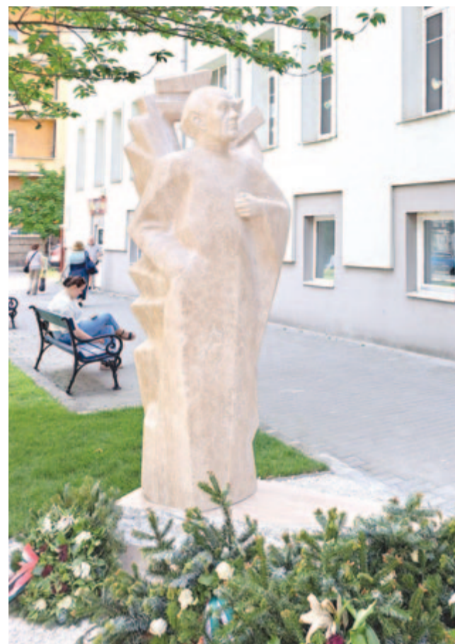
Tamási Áron egész alakos szobra Budán