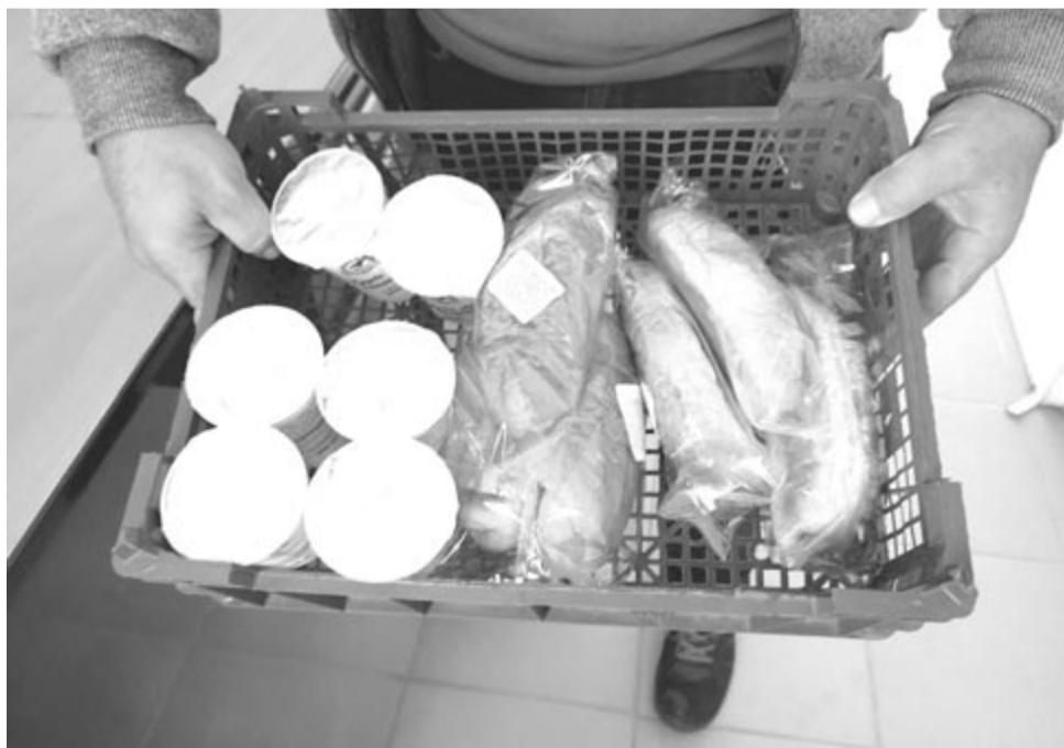
Van is, nincs is – az állam az önkormányzatokkal, azok pedig a törvényességgel játszanak