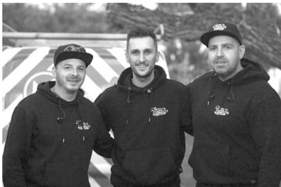
A Pittyes2es és Gyufa zenekar

A Pittyes2es és Gyufa marosvásárhelyi koncertjére, amely február 11-én 19 órától lesz, a Kultúrpalota jegypénztárában lehet belépőt vásárolni.