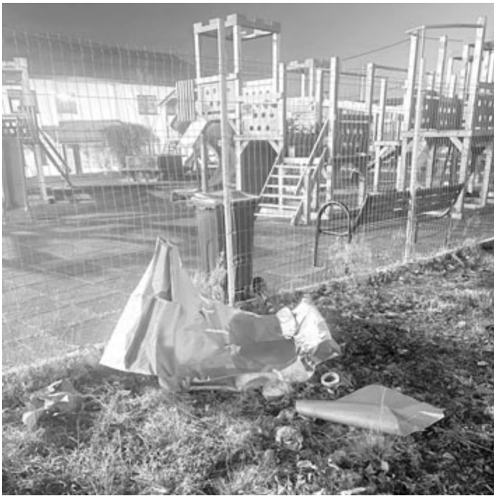
A repülőgépről leesett darab

Nem a sportreptér tulajdonában levő oktatógéppel történt az incidens. Tekintettel arra, hogy az ügyet vizsgálják, a parancsnokhelyettes nem árulta el a pi-