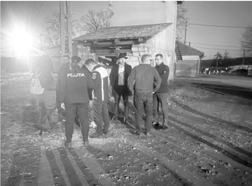
Helyszínen a hatóságok képviselői

Azt is megtudtuk, hogy a civil (sport-) repülőgépeket a típustól függően bizonyos repülési óraszám után kötelező alapos időszakos műszaki vizsgálatnak alávetni, és egyes elemeit (légszűrő, motor) kötelezően ki is kell cserélni. Hozzátehetjük, a repülési bejegyzések és a radarkép alapján pontosan követhető a repülőgép, és azt is jegyzik, hogy milyen műszaki állapotban van a jármű. Hogy miként vált le a motorháztető, azt a szakértői bizottság állapítja meg. E szakvizsgálat eredményét követően az ügyészség is felelősségre vonhatja a pilótát.