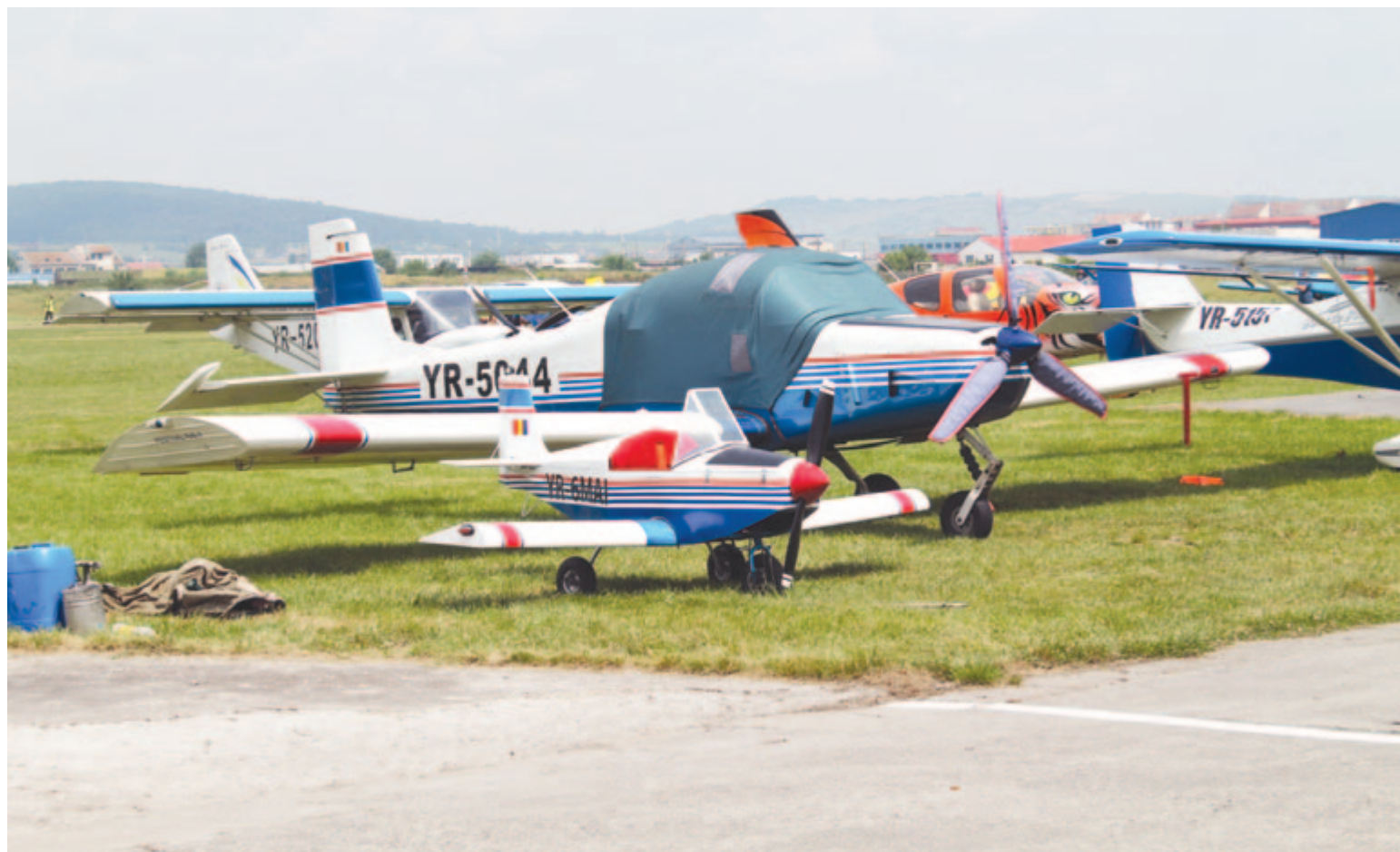
A fotó a 2016-os marosvásárhelyi légi parádén készült