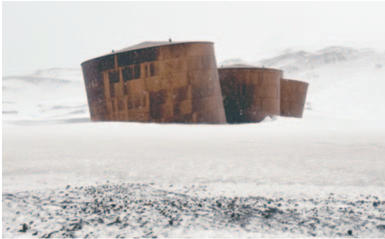
A bálnafeldolgozó ipar maradványai a Deception-szigeten

Az óvintézkedések része az is, hogy ruháinkról az utolsó porszemet is kiporszívózzuk, kölcsönkapott Antarktisz-járó gumicsizmáinkat tökéletesen tisztára sikáljuk, még egy apró kavics sem maradhat