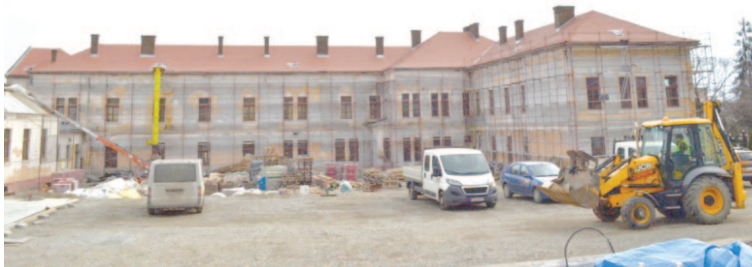
A Traian Általános Iskola főépületén is dolgoznak