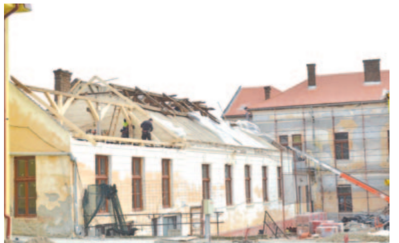
A sportterem új tetőzetén dolgoznak

A rendszerváltást követően alakult nonprofit borlovagrendek hagyományosan megszervezik az Alsó- és Felső-Kis-Küküllő menti borversenyeket. A dicsőszentmártoni, kelementelki, balavásári versenyeket a baráti találkozások vidám hangulata jellemzi, elmaradhatatlan a magyar néptánc. A szőlőtermesztéssel és bortermeléssel foglalkozó gazdák számára a borversenyek nem kimondottan a versengés miatt fontosak, bár az sem elhanyagolandó, ha a borpincéjükben oklevél tanúsítja a szőlőművelés veritékének minőségi eredményét. A hasonló érdeklődési körű társaságok számára tapasztalatszerzést, fejlődési és tanulási lehetőséget is jelentenek a bel- és külföldi megméretések.