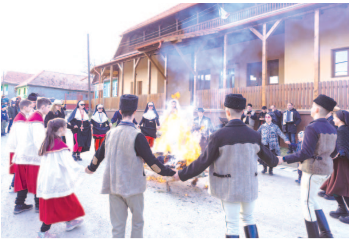
Nyárádselyében sem búcsultak sokat Illyés elhunytán, táncolással, mókával temették el

A kultúrotthonban két osztály mókás előadással lépett színpadra, majd a jól sikerült táncházban rophatták szülők és gyermekeik a táncot. Közel négyszázan szórakoztak önfeledten a gyerekek által kidíszített épületben, a hangulat pedig