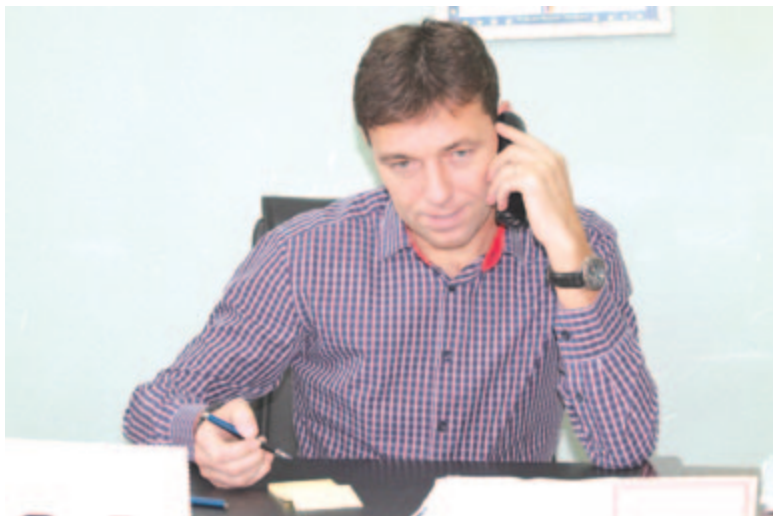
Sorin Megheșan polgármester

A munkálatok megkezdéséhez szükséges engedélyeztetések késlekedése miatt előreláthatólag márciusban foghatnak hozzá. Amint a tervezett utcákra aszfaltburkolat kerül, a város utcái 94%-ban lesznek leaszfaltozva.