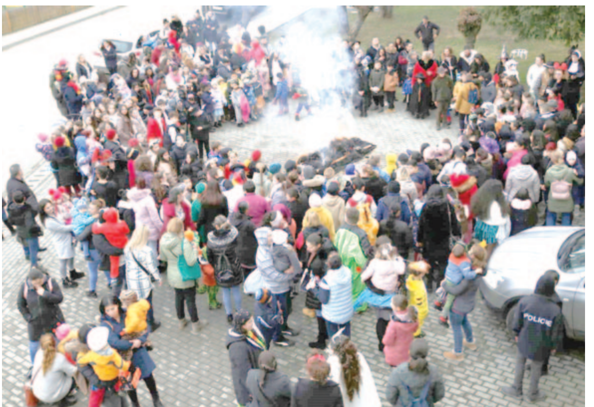
Sokan szórakoztak múlt hét végén az utolsó nagy farsangi vigadalomban

A múlt pénteki farsangtemetési rendezvényt az Erdélyi Hagományok Háza Alapítvány és a magyarországi Kulturális és Innovációs Minisztérium támogatta.