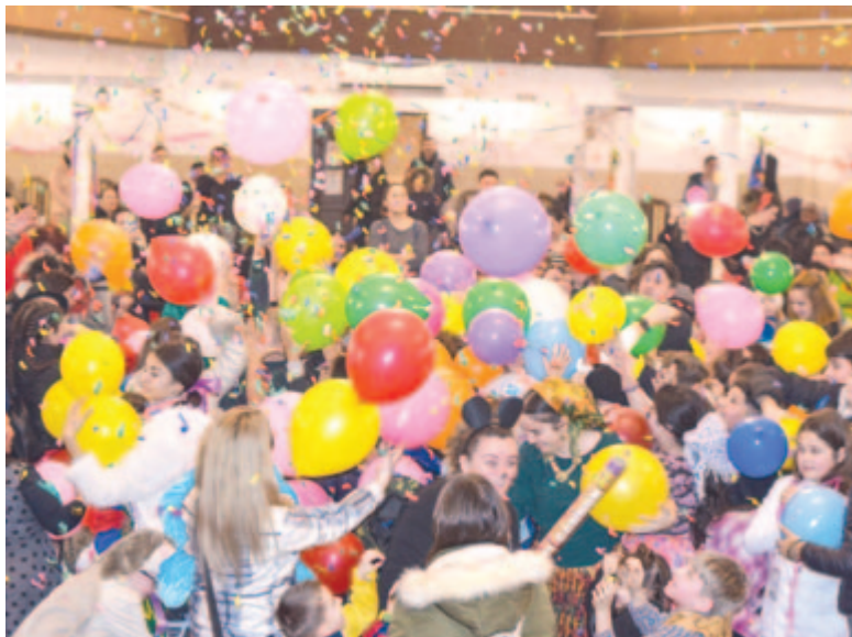
Erdőszentgyörgyön is jól szórakoztak – a léggömbök és a konfetti sem hiányzott