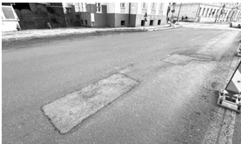
Több lyuk is keletkezett az útburkolaton