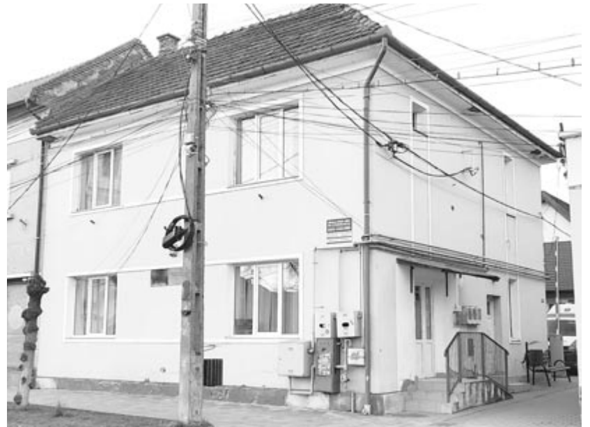
Fél évre ki kellene költöztetni az épületből az orvosi és a mentőszemélyzetet

Az egyetlen gondot az jelenti, hogy a felújítás idejére az orvosokat, men-