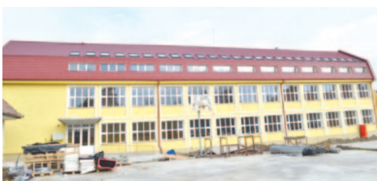
Nemsokára étellel telik meg a felújított épület