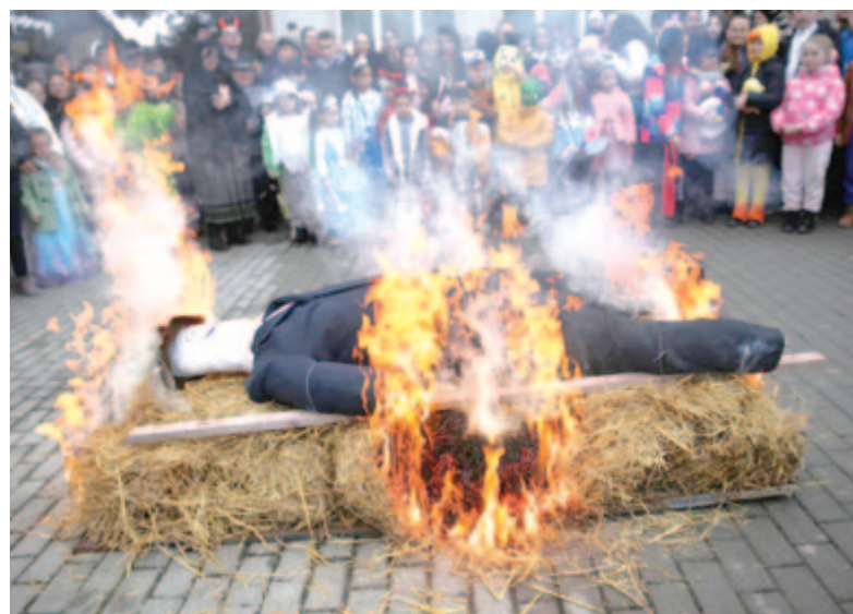
Illyés elégetése a tél elűzését, a tavasz közeledtét jelképezi

akkor érte el a tetőfokát, amikor háromszáz léggömböt és négy konfettiágyút is „bevetettek” a szervezők. Emellett hamar elkelt a 600 sorsjegy, amelyek birtokában kétszer is reménykedni lehetett a nyereleménytárgyak, apró ajándékok megszerzésében, és közben fánkevő versenyre is be lehetett nevezni. Az eledelről sem feledkeztek meg, az Eldi által biztosított 20 kenyérré hamar felkerült 5 kg zsír és 3 kg hagyma. Az egyik helyi cukrász egy tortát is felajánlott, s a helyi Naplemente idősklub is jeleskedett: tagjai 20 kg lisztből több száz fánkot sütöttek a tömeg ellá-