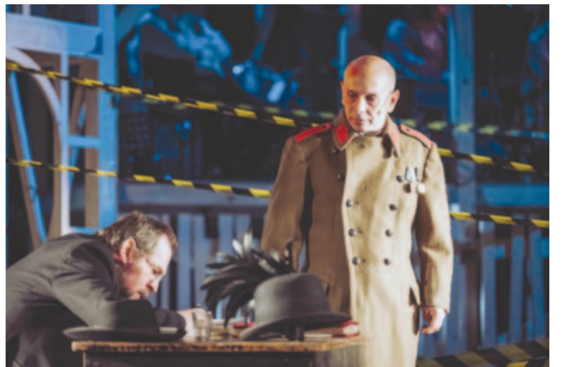
Az igazság gyertyái

Boris Vian: Piros fű. Tragikomikus emléktázas. Rendező: Fehér