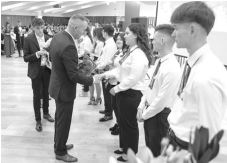
A város polgármestere is évről évre köszönti a nagykorúvá vált diákokat