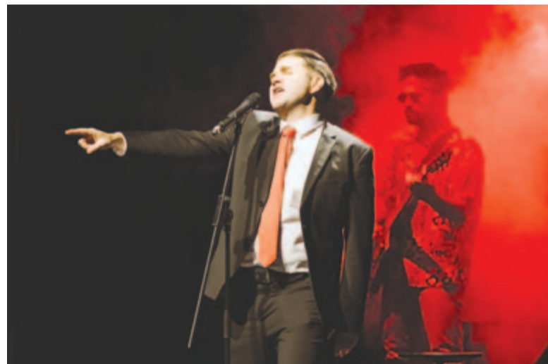
Lázadni veletek akartam