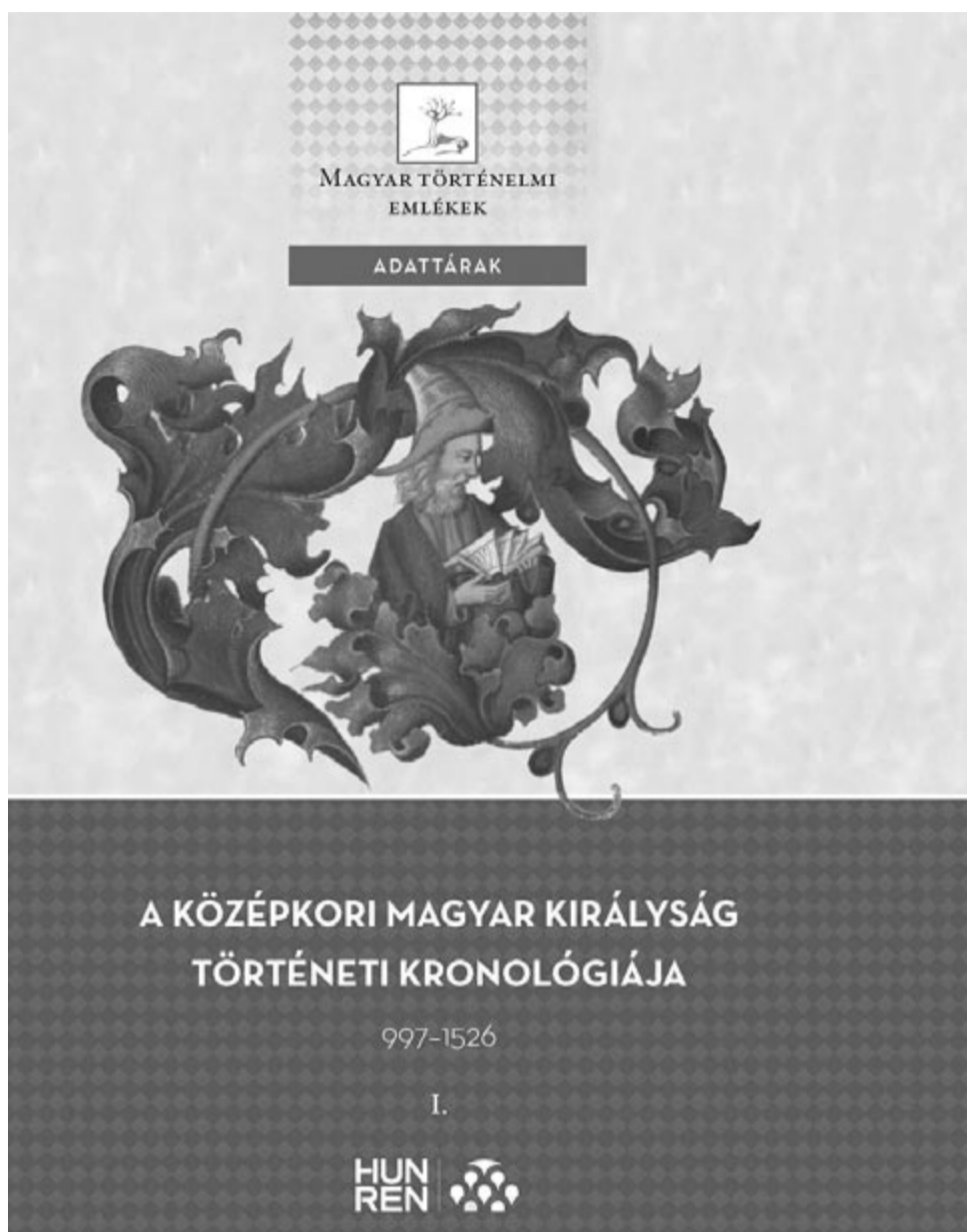
A középkori Magyar Királyság történeti kronológiája, 997–1526

A Történettudományi Intézet kiadásában megjelent kötet a szakmai közönségen – történészeken, régészeken, művészettörténészeken, numizmatikusokon – túl a legújabb kutatási eredményeket megismerni vágyók érdeklődésére is számot tarthat. Emellett a középiskolai és az egyetemi oktatásban is haszonnal forgathatják az oktatók, tanárok és diákok egyaránt.