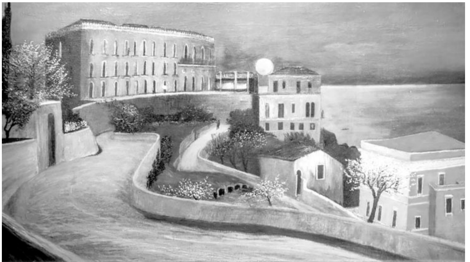
Csontváry Kosztka Tivadar: Holdtölte Taorminában