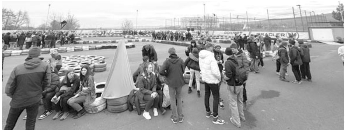
A csapatok készülnek a következő játékra