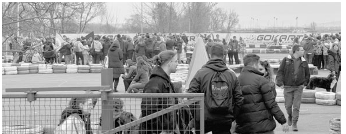
A játék kezdete előtt

Az esemény idei kiadásán több mint 500 fiatal fordult meg a Gokartnál szervezett játékokon, illetve az ezeket követő esti bulikon.