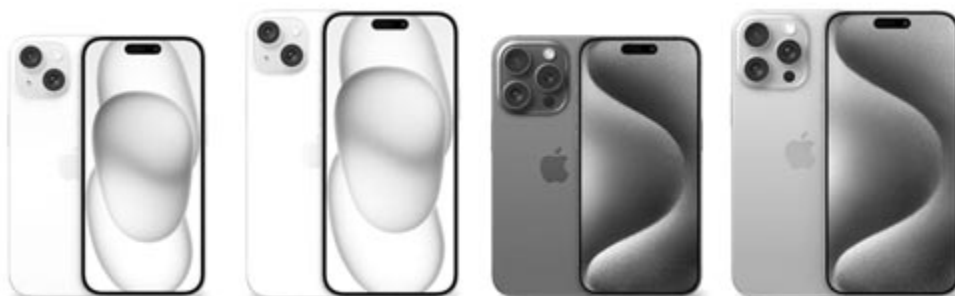
Az iPhone 15 modellcsalád

Ha megnézzük az elégedettségi értékeléseket, akkor azok a következőképpen néznek ki: a felhasználók leginkább az iPhone 15-tel elégedettek (78,1%), ezt követi a 15 Plus (73,5%), majd a 15 Pro Max (72,5%), és a sort a sima 15 Pro zárja 66,1%-kal. Fontos kiemelni, hogy ezek az adatok nem azt akarják sugallni, hogy valami gond van a készülékekkel, hanem csak azt, hogy a felhasználók nem teljesen elégedettek velük, többet vártak volna a pénzükért.