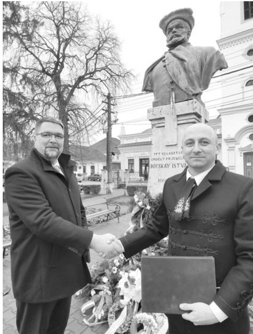
Megerősítették és folytatták a harmincéves kapcsolatot

Össze akarunk tartozni, mert őszinték ezek a kapcsolatok, és nem határok, hanem emberi kapcsolatok kötnek minket össze” – mondta el a Népújságnak Nyárádszereda vezetője, aki hozzátette: a településnek hét ilyen kapcsolata van, ezek közül a legrégebbi az aszódi, és mindenik önmagában is nagyon érdekes. „Nekünk, polgármestereknek az a feladatunk, hogy ezeket a kapcsolatokat ápoljuk, úgy, hogy ezt a lakosság is érezze” – toldotta meg a polgármester.