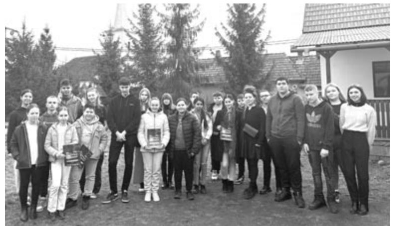
Jobbágyfalván két tucat fiatal gyűlt össze, hogy megismerje az egyletezést.

A körutat megelőző összerázón a szervezők kidolgozták a programokat, amelyek alapján a különböző helyszíneken mintegy két-két órán át folytak a tevékenységek. A helyi fiatalok és az országos szervezői csapat találkozási ismerkedéssel kezdődött, majd az ODFIE tevékenységét mutatták be a helyi egyletek tagjainak, az ezt követő beszélgetésen felmérték, hogy a fiatalok hogyan képzelik el az egyleteket, milyen közösséget szeretnének. Ilyenkor a szervezők tanultak a fiataloktól, hogy majd később nekik tetsző rendezvényekkel rukkolhassanak elő. Befejezésül imaláncot fontak egy teológiai hallgató vagy ifjúsági lelkész vezetésével, ahol mindenki hozzátehetett a közös imához az ő személyes érzését, gondolatát. Két hasonló forgatókönyv létezik: egyik azon helyszínekre, ahol már ismerik az ODFIE-t, de szükség van egy kis tá-