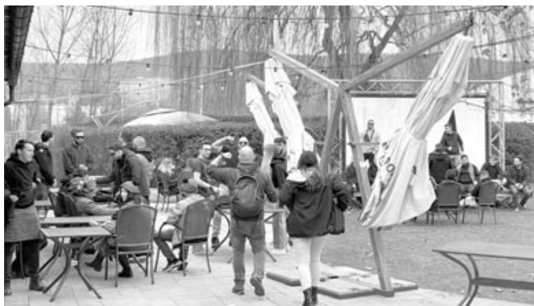
A szünetben volt idő bulizni is