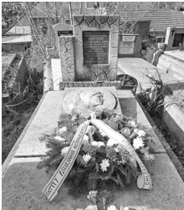
Kántorné megkoszorúzott síremléke a marosvásárhelyi római katolikus temetőben

A pesti Hacker-szalában működő társulatnál lépett először színpadra 1810-ben. Nem sokkal később férjhez ment az ismert komikushoz, Kántor Gerzsonhoz. Rövidesen férjével együtt a Debrecenben játszó kolozsvári társulathoz szerződött. Férje korán meghalt, ő maga 1847-ig járta vándorszínészként az országot. (Özvegyként született egy törvénytelen