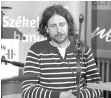
Szász Attila

1958. március 2-án szólalt meg először a Marosvásárhelyi Rádió, vagyis napra pontosan 66 évvel ezelőtt. Első műsora a Megszóla a Székelyföld címet viselte, amit akkoriban a 261 és a 330 méteres hullámhosszon foghattak a hallgatók. 66 évvel ezelőtt mindössze 30 pernyi magyar műsoridő volt (és 15 perc román), ez bővült idővel 90 percre, majd 1968-ban két órára. 1984-ben már napi három órán keresztül volt hallható a Székelyföld hangja. Ezután viszont, sajnálatos módon, csend következett, 1985. január 12-én Nicolae Ceaușescu utasítására az összes területi stúdiót bezárták. A Marosvásárhelyi Rádió csak a forradalom után indult újra, napi 4 órás műsoridővel. Ez az évek során folyamatosan bővült, és végül 2013-ban, a rádió 55. születésnapjára sikerült elérni a 24 órás magyar műsorrácsot. A 66. születésnapra a rádió munkaközössége több ajándékkal is készül a hallgatóknak.