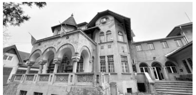
A Marosvásárhelyi Rádió épülete

Összességében nézve a Marosvásárhelyi Rádió komolyan készült a 66. születésnapjára, így most is, de az év többi napján is érdemes a frekvenciáira kapcsolódni vagy online hallgatni a műsorait.