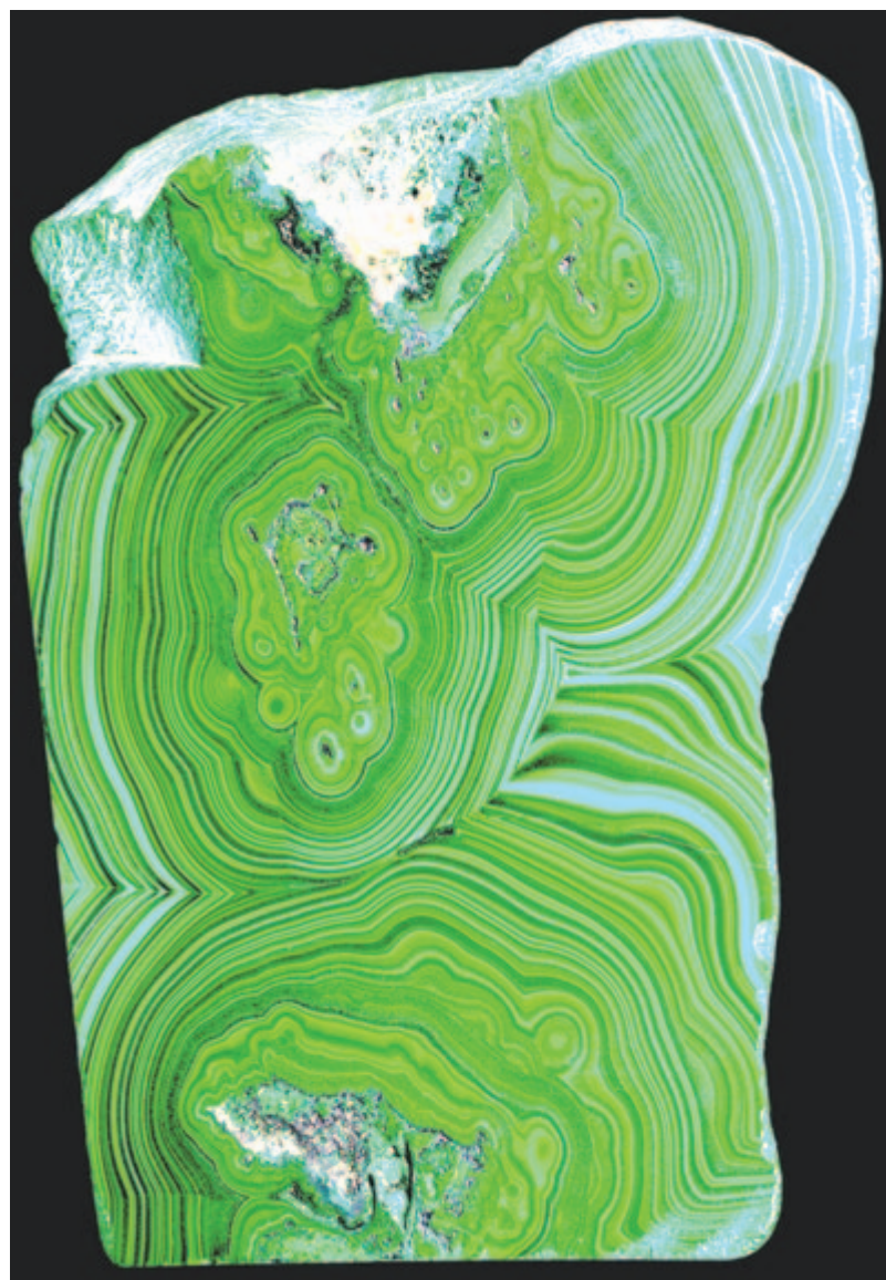
Malachitsoda a kongói Katangából

Nehéz a rézágyú, felszántja a hegyet, völgyet, Édes rózsám, a hazáért el kell válnom tőled.