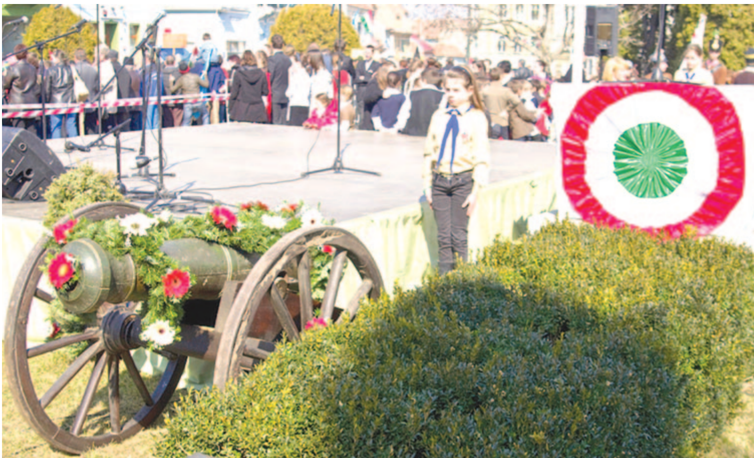
Gábor Áron rézágyúja fel van virágozva – Kézdivásárhelyen

Tehát: nehéz rézágyú. És ránk marad a nehéz márciusi örökség. Éljünk vele emberül! Maradok kiváló tisztelettel. Kelt 2024-ben, március idusán