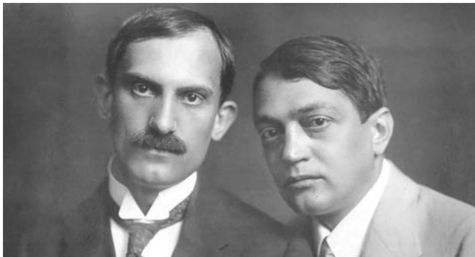
Babits Mihály és Ady Endre

A prózáiról Babits két egymástól különböző elbeszélésben a betegséggel, bajjal és a bajra talált irrel is találkozhatunk. A röpülő falu (1921) című Babits-elbeszélésből film is készült. Az elbeszélés a trianoni „béke” után játszódik egy pesti kocsmában. A tömör történet íve kábítóan kínzó igazságával ejti rabul az olvasót. Az ábrázolásmód egyszerre hagyományos és szürrealista. A novella elbeszélője egy magányos, megkeseredett férfi, aki az országcsontkítást követően Csíkből menekült Budapestre. Egy kocsmasztalnál kezdi mondani szomorú történetét. Elmeséli, hogy a szörnyű június negyedikét követően egy nap elindult hazulról egy egész falu az anyaország felé, és azon a napon csak egyetlen nagybeteg, járni képtelen öregasszony maradt otthon a kiürült házakkal, a gazdátlanul hátrahagyott állatokkal... És azon az éjjel az elhagyott falu felemelkedett, lebegni, majd lassan repülni kezdett az elment emberek után. A menekülés nehézségeibe sok kisgyermek, nő és öreg belehalt; az elbeszélő családja is mind odaveszett. Ezért más vigasztalása nem maradt, mint hogy andalító bor fejében szüntelenül elmondja, újra és újra elbeszélje a maga és faluja tragédiáját. A falu „odafenn” legalább elérhetőnek tűnik az ittas ember számára, aki már csak pusztá önkínzás és fájdalom, valóságos élőhalott, akinek lelki egészségét rég kikezdte a ki sem beszélhető egyéni és közösségi gyász.