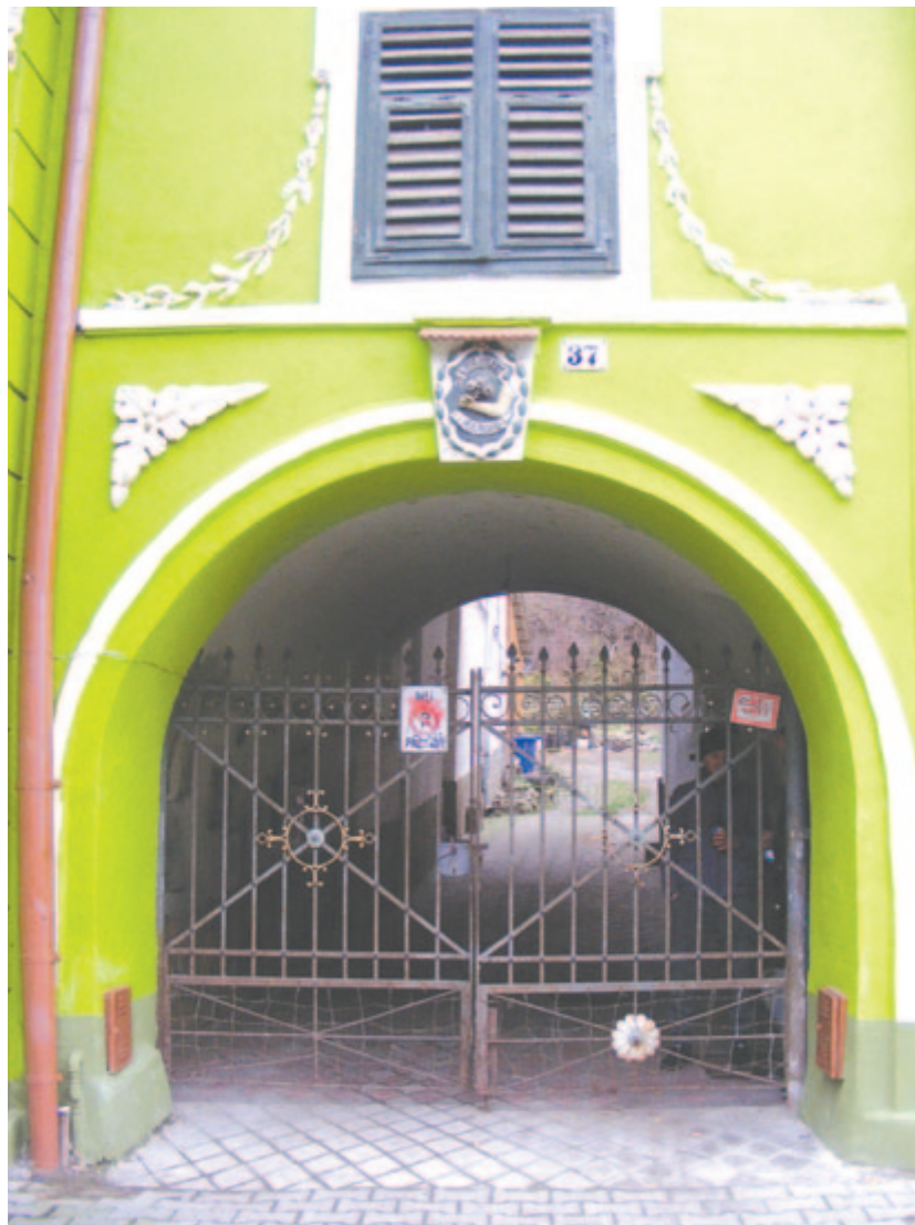
A ház boltíves kapuja