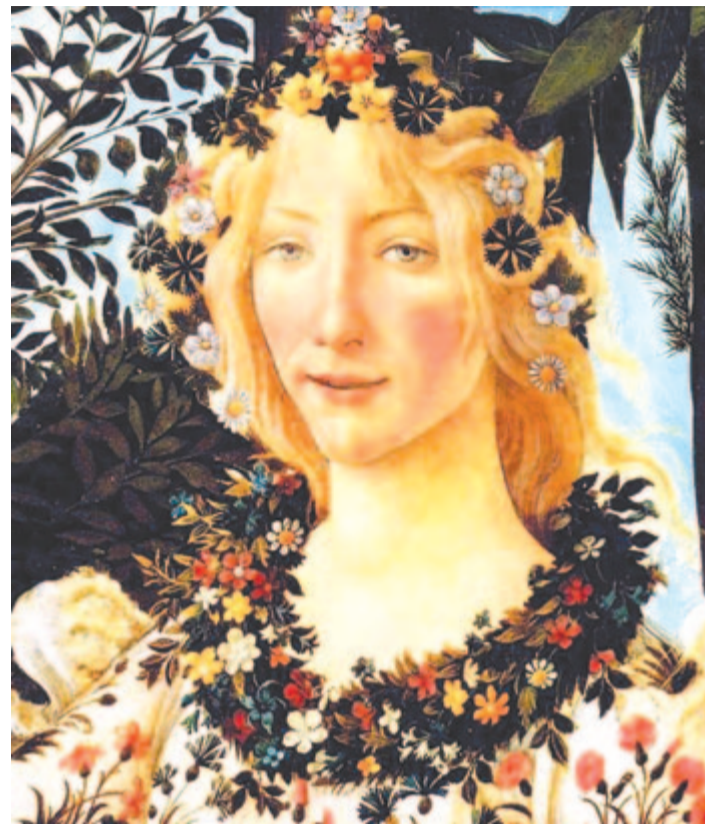
Sandro Botticelli: La Primavera (részlet)

Most tavasz van: szerelmesek a fák. Virágok vonnak rájuk glóriát, s messze űzik a téli némaságot.