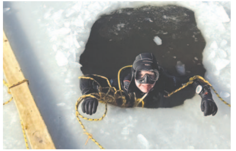
Januári merülés mintavételhez

– Mindenekelőtt egy alapos, a beavatkozást megelőzően legalább egy éven át, majd annak során és azt követően több éven át zajló vizsgálatra lenne szükség, melynek során mérni kellene a tó számos fizikai és kémiai paraméterét, azok térbeli jellegzetességeit, és monitorozni kellene a tó élővilágát. Ez több költséges szonda beszerzését feltételezi, a munkaiágénye is jelentős lenne, és sok DNS-szekvenálás is kellene hozzá. Ezután, a fizikusok, biológusok és geológusok mellett hidroeológusok, mérnökök és limnológusok bevonásával kellene kidolgozni a részletes „fiatalítási” tervet. Csapatunk számos sópótlási lehetőséget tanulmányozott. Az egyik legígéretesebb egy idős helyi vállalkozó biztatására kezdtük vizsgálni. Eszerint a közelben levő, sós vizű Géra-forrás vizét kellene