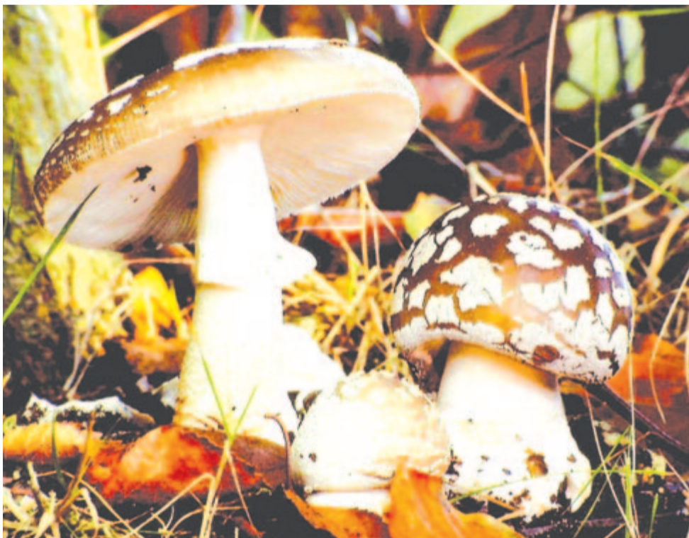
Szürke galóca (Amanita excelsa)

Kelt 2024-ben, rügyezés havának 22. napján