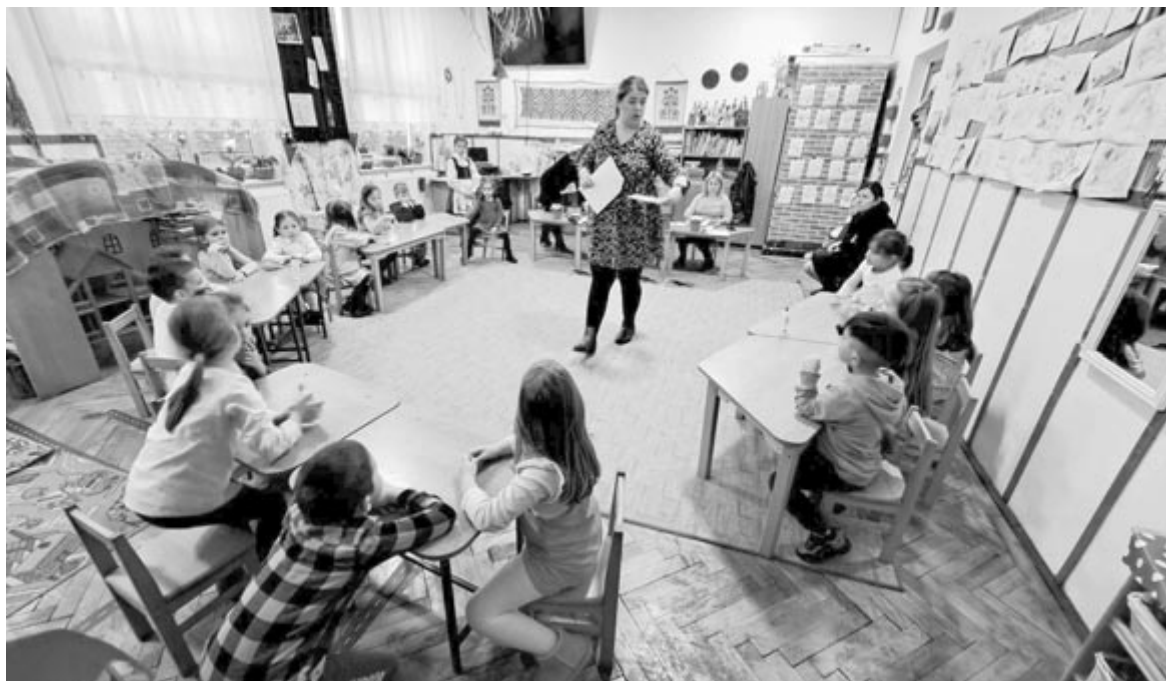
Számos játékos feladat révén mérték a gyerekek ismereteit