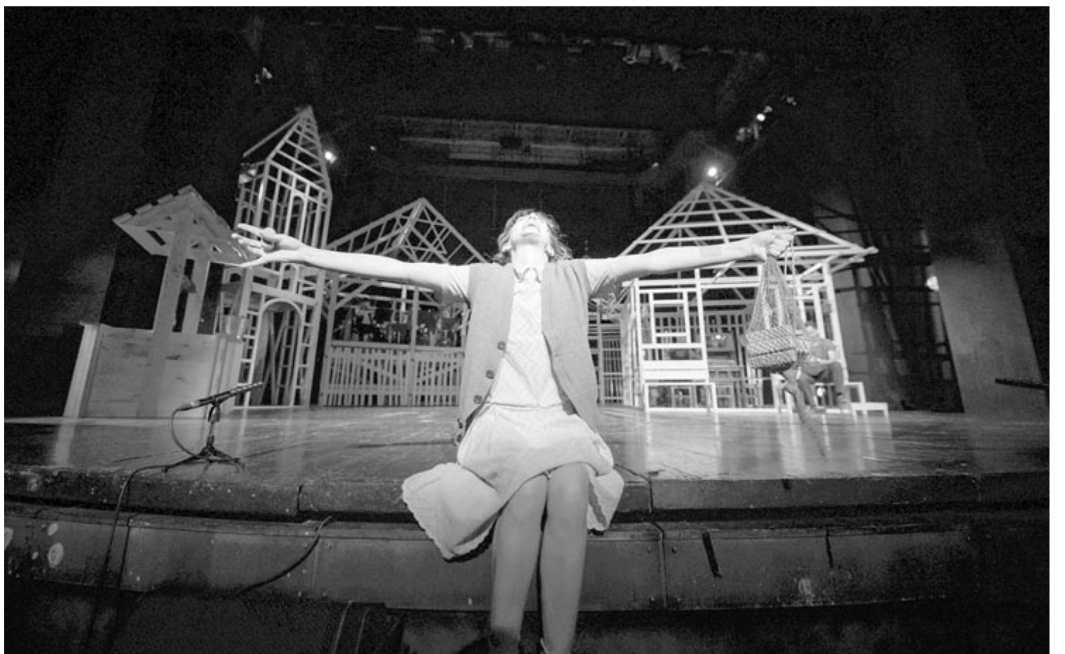
Az igazság gyertyái