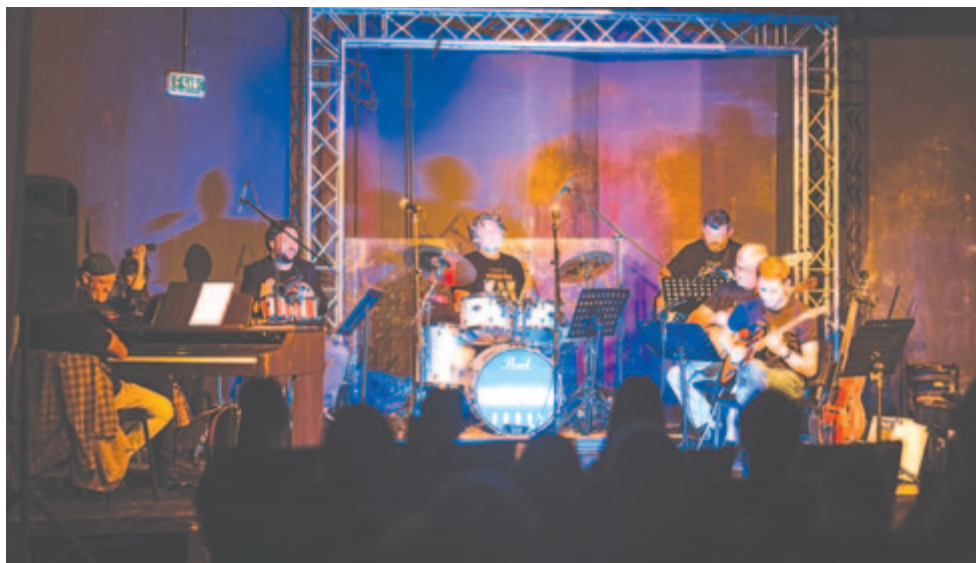
A Tompa Pilvaxer Band

Az interjút készítette Kaáli Nagy Botond