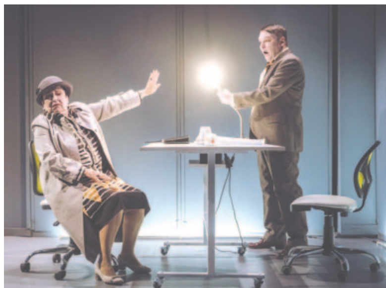
Csónak, avagy előttünk az özönvíz

Székely Csaba: Az igazság gyertyái . Történelmi színmű. Rendező: Sebestyén Ábá. Nagyterem. Az előadás 12 éven felülieknek ajánlott. Időtartama 2 óra 40 perc (egy szünettel).