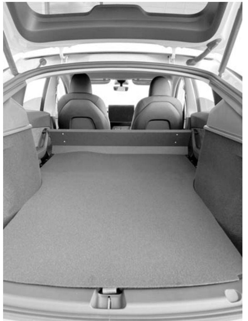
A Tesla Model Y áruszállító kivitelének belseje

De miért pont Franciaországban? Az ok az adókedvezményben keresendő, ugyanis az áruszállító kivitel a hatályos jogszabályoknak megfelelően egy másik adóbesorolásba esik, tehát nem azok a díjak vonatkoznak rá, mint egy hétköznapi személygépjárműre. Éppen ezért olcsóbban lehet forgalmazni, és akkor még nem beszéltünk arról, hogy van állami támogatás is, ami-