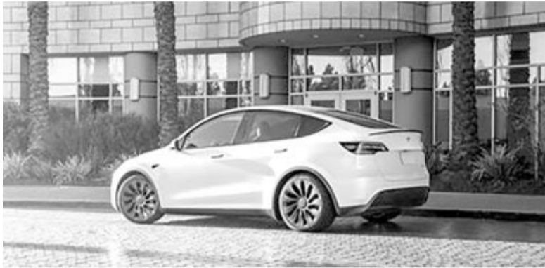
Tesla Model Y, kívülről semmi különbség a személy- és az áruszállító között