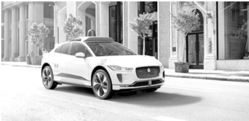
Waymo Jaguar I-Pace robottaxi, egy ilyen próbáltak elkötni Los Angelesben