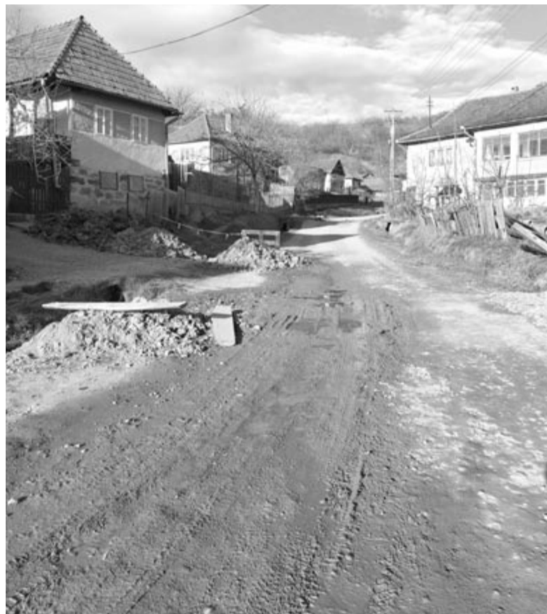
Első körben a meredek, dombra vezető utcákat aszfaltozzák, hogy többé ne rongálja meg őket a víz

Ennek a kiírásnak a keretösszege 1,2 millió euró, ebbe az összegbe végül hét utcát tudtak belefoglalni. Figyelembe kellett venni a pontozást is, 50 és 70 közötti számot kellett szerezni. Itt azt értékelték a pályázatok, hogy az aszfaltozásra kerülő utca milyen útra csatlakozik, hogy érint-e köz-, egyházi vagy tanintézményt és legalább két céget is. A község pályázata 69 pontot ért el, ezért jó esélye volt nyerni, de a leadása után, a terepszemle alkalmával kiderült, hogy időközben egyik faluban két cég felbomlott, és ezért elvesztettek 5 pontot. Szerencsére van két másik helyi vállalkozás, amelyeket érinthet az aszfaltút, ezért a szükséges dokumentációt elfogadta a helyi tanács, és azt le is adta. Remélhetőleg sikerül visszaszerezni az elveszített pontokat, és a jövő év során további hét utcára kerül aszfaltréteg. Ebbe a pályázatba megpróbálták az összes fennmaradt utcát belefoglalni, de a pontozási rendszer és a megemelkedett árak miatt néhány kisebb utcát végül ki kellett venni – mutatott rá az előljáró.