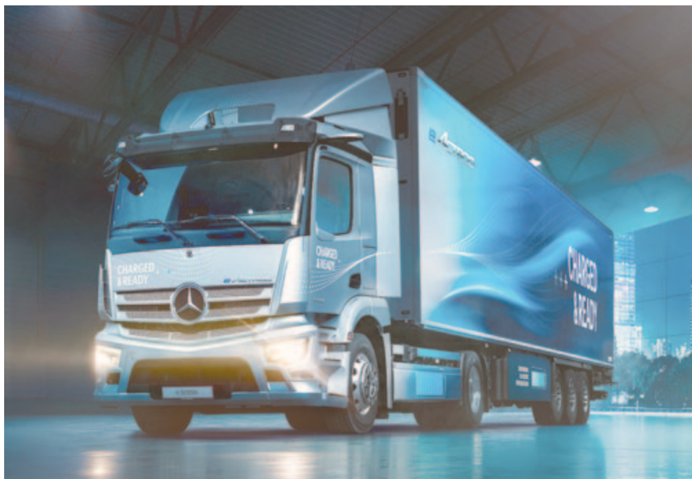
Mercedes-Benz eActros elektromos teherautó, illusztráció

Vizont az Európai Parlament döntése még nincs köbe vésvé, hiszen az Európai Bizottságnak is szavaznia kell róla, erre viszont minden bizonnyal csak a választások után kerül sor, tehát valószínűsíthető, hogy a végleges döntés egy teljesen új testületre hárul. Ezzel együtt is komoly esély van rá, hogy átmeny, hiszen egy ilyen törvénnyel környezetbarátabbá lehetne tenni a teherszállítást, vagy legalábbis arra ösztönözni a vállalatokat, hogy induljanak el ezen az úton.