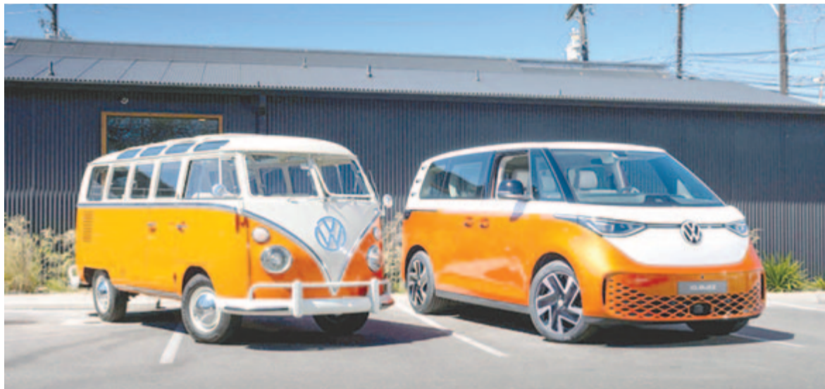
A Volkswagen T1, az ősbusz és az ID.Buzz

fornia, vagyis kempingező kivitel is. Azonban úgy fest, hogy egyelőre az elektromos utódból, az ID.Buzz-ból nem készít ilyesmit a Volkswagen. Az ok nagyon egyszerű: