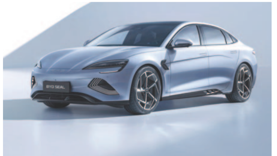
BYD Seal, a kínai vállalat szedánja