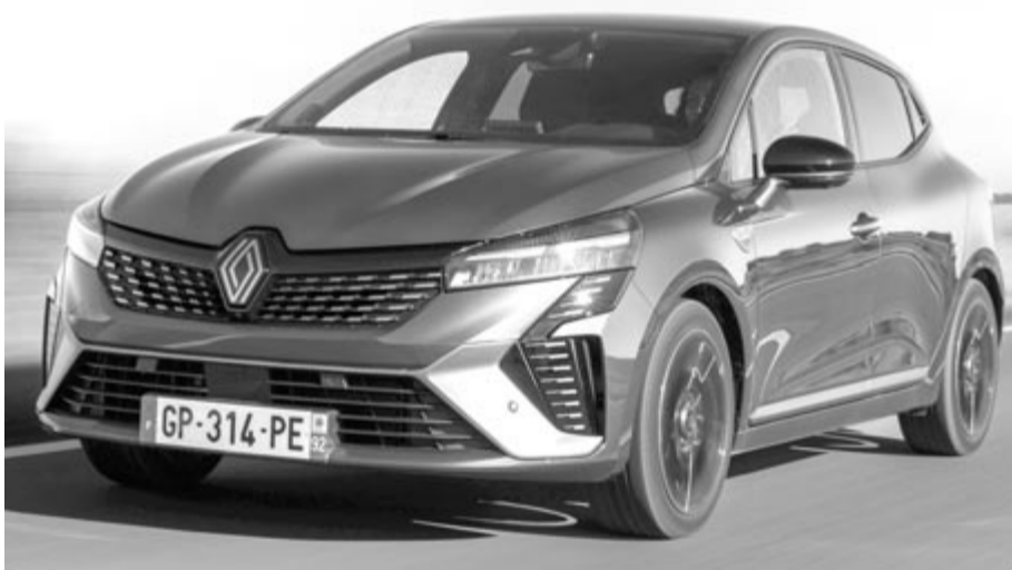
A Renault Clio ötödik, ráncfelvarrott generációja