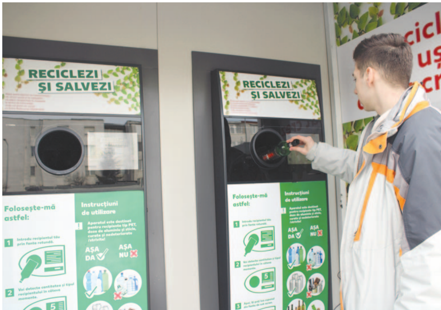
A RetuRO-rendszer a környezettudatosítás egyik eszköze