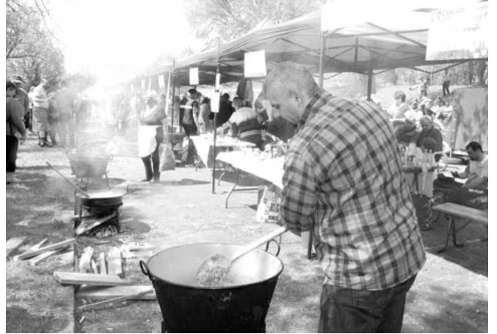
Újra lesz gulyásfőző verseny