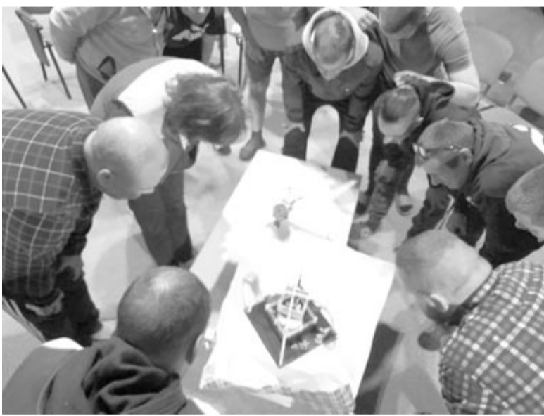
Csoportos foglalkozás a Bonus Pastor Alapítványnál

– Minden ember életében vannak függőségek, ezért nem tudjuk teljesen elválasztani önmagunktól, de fontos tudni, nem mindegyikből lesz szenvedélybetegség. Vannak káros függőségek, itt jelenik meg a szenvedélybetegség, amely negatív hatással van más személyekre, a családunkra, de főként önmagunkra. A függőség egy folyamat, ezért fontos meghatározni, hogy melyik típusáról beszélünk, bár mindegyiknek ugyanaz az útja és a gyökere. Olyan egyszeri vagy alkalmankénti, majd rendszeres használókról beszélünk, akik átélnek egy visszaélési folyamatot. Vagyis a szerrel vagy folyamattal való visszaélés – legtöbbször abúzus nyomán kialakuló kontrollvesztés – szenvedélybetegséghez