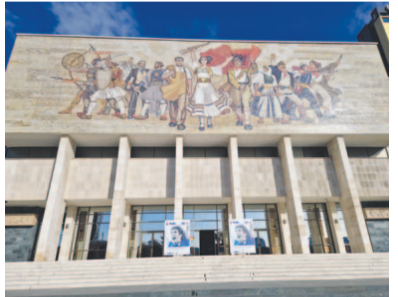
A Nemzeti Múzeum szocreál bejárata és homlokzata Tiranában

A kétezres évek elején a még mindig Európa legelmaradottabb országának számító Albániában idegenforgalomról csak jóindulattal lehetett beszélni. Manapság viszont rohamosan fejlődik az infrastruktúra, könnyen és olcsón elérhetővé vált az albán tengerpart, és az országot egyre inkább egy csiszolatlan gyémánthoz hasonlítják. A lehetőségek országában feltűnően sokan járnak Mercedeszel, sőt a hurráoptimizmus jegyében a rend-