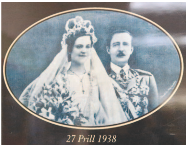
I. Zogu király és felesége, Apponyi Géraldine

Albániában, Tiranában számos magyar vonatkozásra lehet beszélni. Szembetűnő, hogy a vezető bankok között szerepel az OTP Bank, amelynek automatái, kirendeltségei, sőt toronyépülete is van. Ami viszont a legfontosabb, ami a legjellemzőbb az albán–magyar kapcsolatokra, ami közelebb hozza egymáshoz a két népet, az egyúttal történelmi tény. Ugyanis Albánia maig egyetlen szabadon megválasztott királya 1928–1939 között, a függetlenné vált ország két világháború közötti történelmének legmeghatározóbb alakja, I. Zogu király Apponyi Géraldine grófnót vette feleségül 1938-ban. A Szkander bég leszármazottjának tartott államférfit III. Viktor Emánuel váltotta a trónon az olasz fasiszmus térhódítása miatt. Ahmet Zogu (1895–1961) már a Balkán-háborúban kivette részét, majd a világháborúban az olaszok és az Osztrák–Magyar Monarchia által megszállt országba visszatérve a függetlenségét visszanyerő Albánia minisztere, miniszterelnöke, államelnöke, majd királya lett. A muzulmán uralkodónak és katolikus feleségének 1939. április 5-én született meg egyetlen gyermeke, majd két nap múlva az ország elhagyására kényszerültek az olasz megszállás miatt. A királyi pár emigrációban élt, véglegesen Franciaországban telepedett le. A tiranai Nemzeti Múzeum szocreál épületében egy egész szoba tárgyi emlékei, korabeli fényképei mutatják be hányatott, ám tartásos életüket.