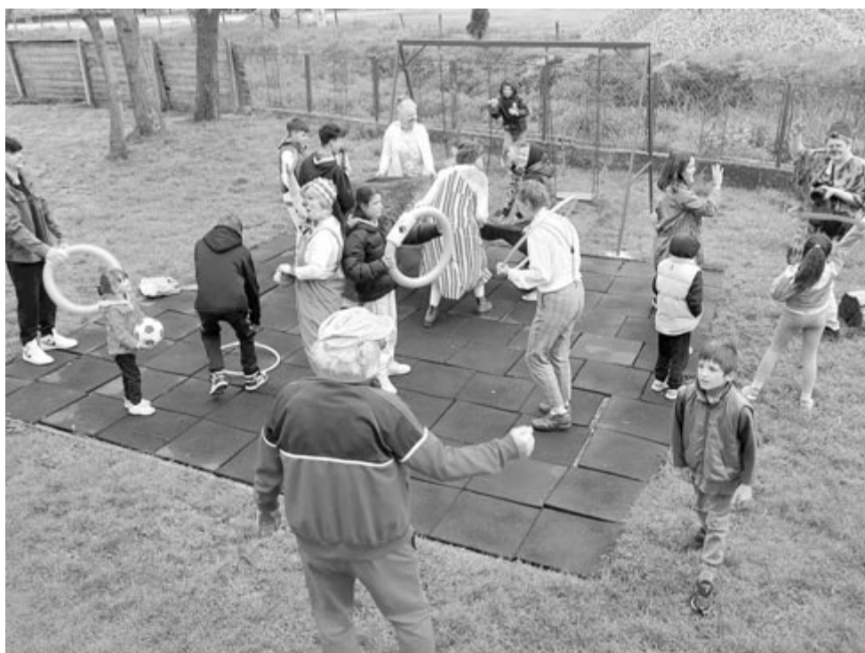
Idén több helyszínen is megfordulnak megyénkben, hogy mosolyt csaljanak gyerekek, idősek, betegek arcára

Ezen a héten több helyszínt látogatnak meg: a múlt vasárnap érkezett bohócok hétfőn Kolozsváron egy fogyatékkal élő csoport