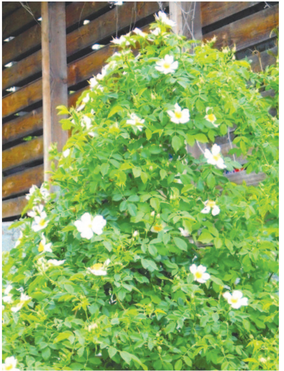
Vadócba rózsát oltok, hogy szebb legyen a föld

Ő írja azt is, hogy a latin Maius hónapot Ovidius szerint a meglelt korúak (maiores) tiszteletére nevezték el. Valószínűbb azonban, hogy a régi római Maia istennő vagy férfi párja, Maius volt a névadó. A görögöknél Maia a pleiászok egyik csillaga volt, Zeusz szeretője és Hermész (a latin Mercurius ) anyja. A görög maia „anyácskát”, „dajkát”, „bábát”, a dór nyelvújításban „nagyanyát” jelentett, neve magának a „nagy istennőnek” egyik megszólítása volt. Maia a növekedés és a szaporulat felett bábáskodott, s a május valóban a növekedés hónapja. Bizonyos értelemben.