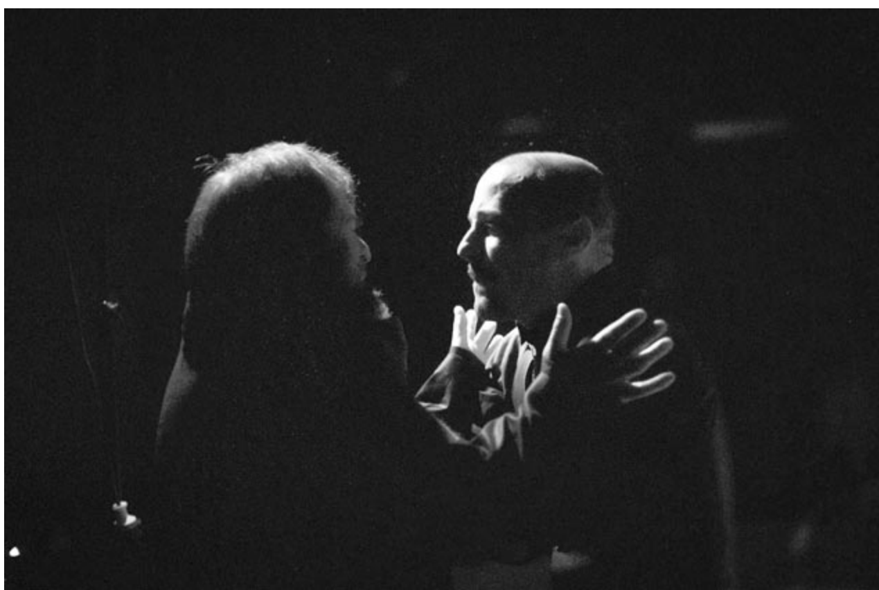
Tompa Miklós Társulat: Multság

1929. május 10-én, 95 éve született Kányádi Sándor.