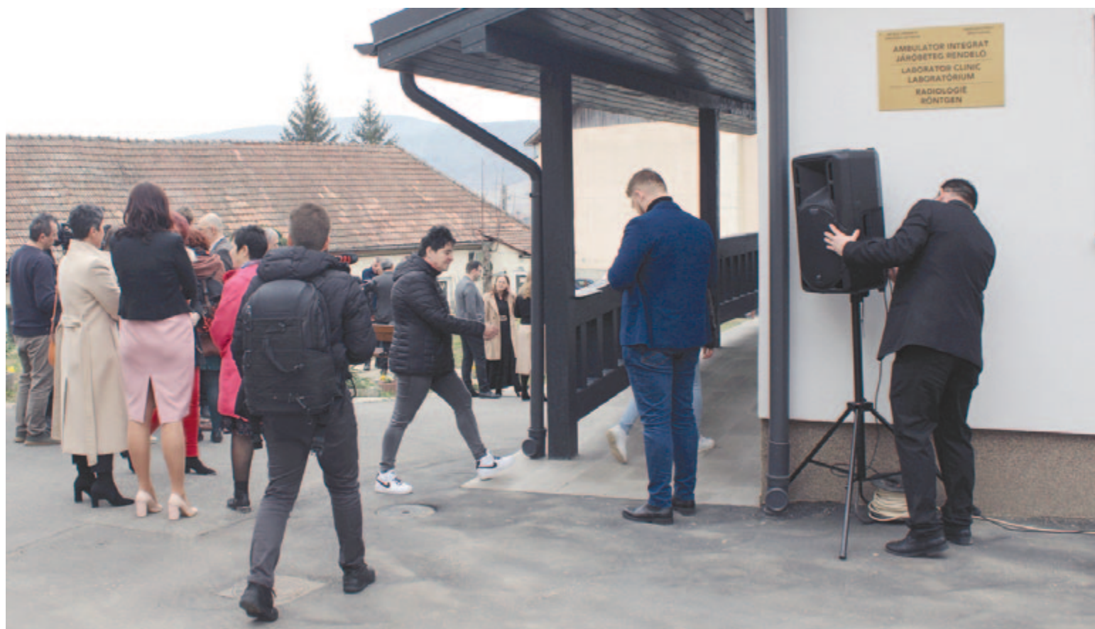
A nemrég jelentős felújításon átesett erdőszentgyörgyi kórháznál már leadhatók a régi gyógyszerek

Ne feledje idejében megújítani előfizetését! Ha előfizet, biztosan kézhez kapja, féláron, mint ha megvásárolná!