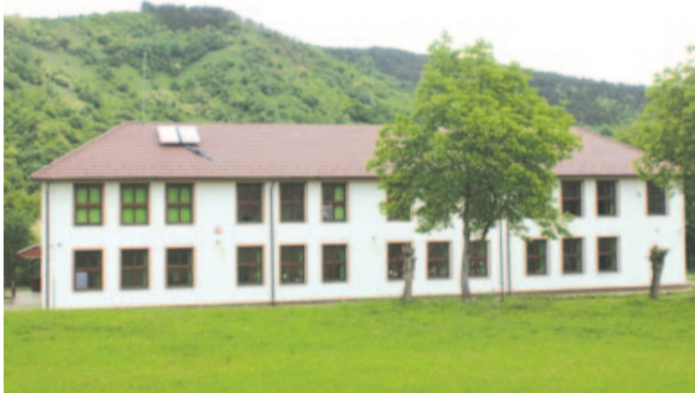
A dombói iskola