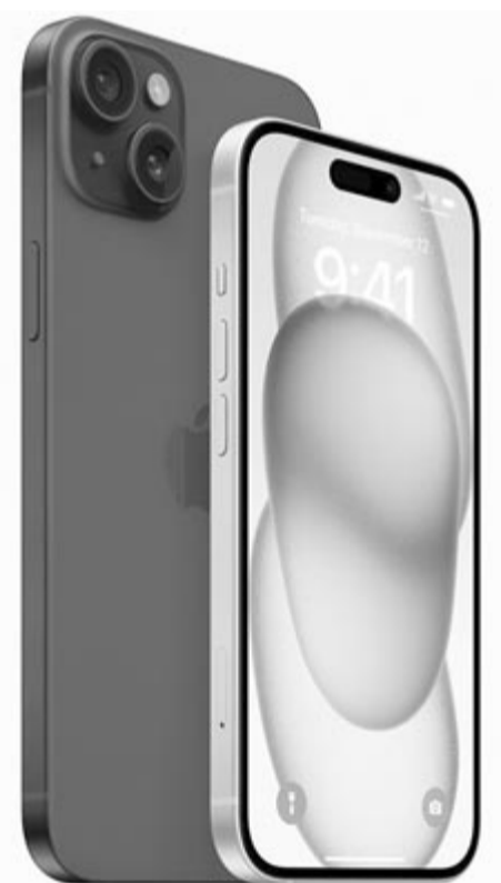
iPhone 15 és 15 Plus