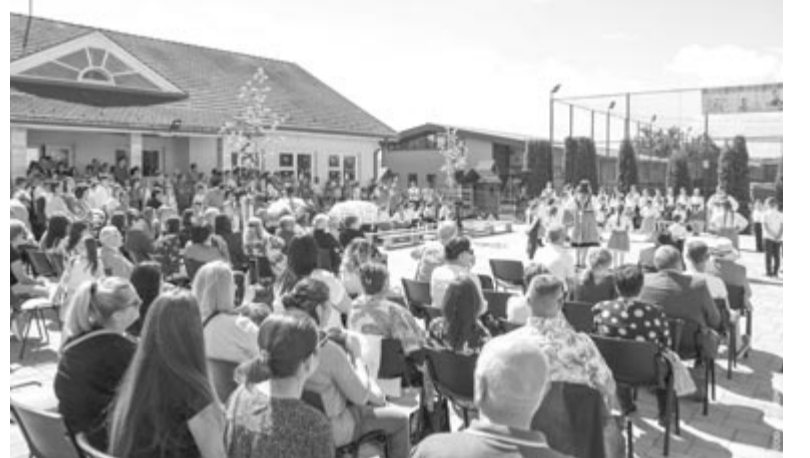
A körtevényfői iskola