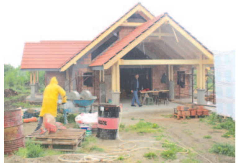
A királyfalvi ravatalozó

pedig az egykori szaporítóállomás szomszédságába terveznek ravatalozót építeni.