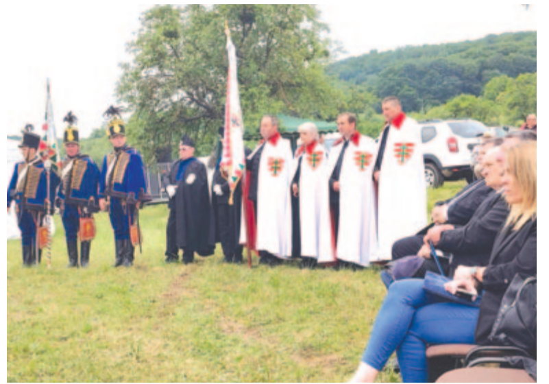
„A rád bízott drága kincset őrizd meg” – az értékörzés ma különösen fontos az egyre inkább értékét veszítő Európában