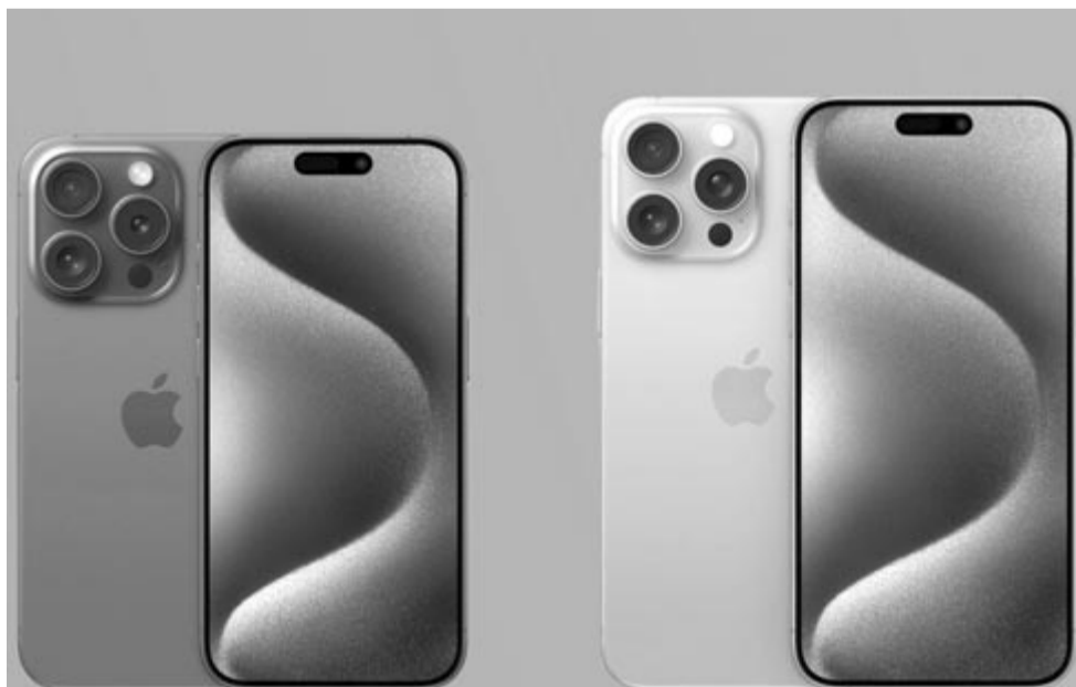
iPhone 15 Pro és 15 Pro Max