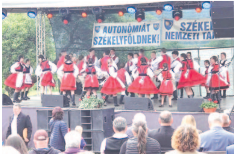
A szórakozás, közösségi együttélés is fontos része a székely majálisok programjának

mutatott be, „amely nemcsak a makfalviak, hanem az egész erdélyi magyar közösség igénye”: meg kell állítani a háború elszabadulását Európában; az EU-nak jogszabályt kell elfogadnia a nemzeti régiók védelmében; Ukrajna uniós csatlakozását be kell fagyasztani mindaddig, amíg nem szavatolja minden nemzeti kisebbség egyéni és kollektív jogait a közéletben, közoktatásban és a közigazgatásban; meg kell szüntetni az ukrán mezőgazdasági termékek vámmentességét az EU-ban; a schengeni csatlakozást megelőzően Romániának minden kötelezettségvállalását teljesítenie kell; meg kell állítani az illegális migrációt Európában; meg kell vonni a genderpropaganda támogatását; az EU-nak meg kell kezdenie a tárgyalásokat Oroszországgal a kereskedelmi és gazdasági kapcsolatok helyreállításáért; Ursula von der Leyennek és csapatának távoznia kell; keresztény és konzervatív fordulatra van szükség az EU-ban. „Olyan képviselőket kell bejuttatni az Európai Parlamentbe, akik a tíz ponttal egyetértenek!” – ismertette a kiáltvány tartalmát a polgármester.