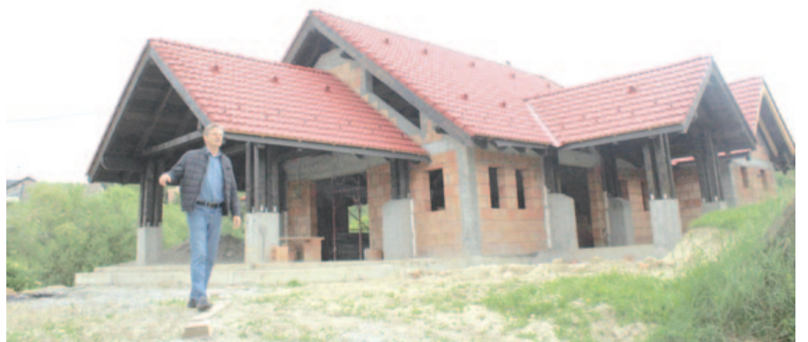
A sövényfalvi ravatalozó