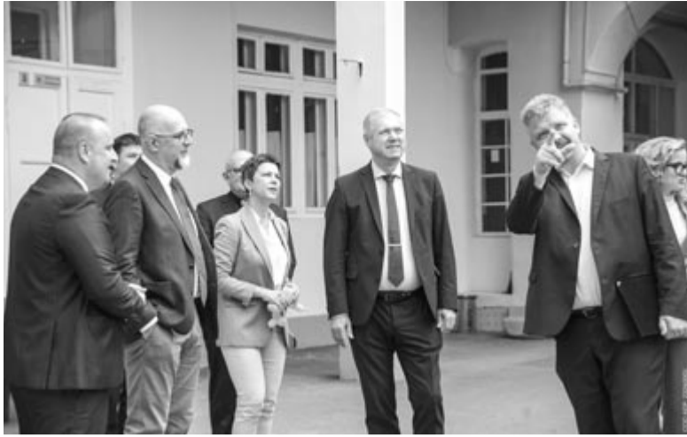
A Marosvásárhelyi Művészeti Főgimnázium

Több száz diák örvendhet annak a két beruházásnak, amelynek köszönhetően megújult tantermekben és korszerű körülmények között tanulhatnak ezentúl a Marosvásárhelyi Művészeti Főgimnázium és a körtevényfői általános iskola tanulói – áll a Maros megyei RMDSZ sajtóirodájának közleményében.