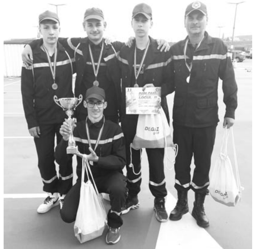
A nyárádszeredai ifjúsági csapat büszke arra, hogy eljutott eddig