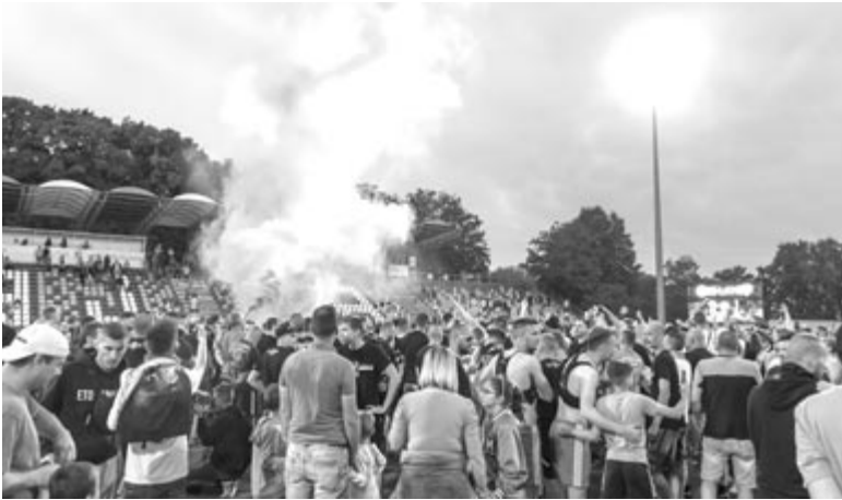
Az ETO FC Győr játékosai és szurkolói ünnepelnek, miután csapatuk 1-0-ra győzött az FC Ajka ellen az NB II. 34., utolsó fordulójában játszott mérkőzésen az Ajkai Városi Sportcentrumban 2024. május 26-án.

magyaróvár – BFC Siófok 1-3, HR-Rent Kozármisleny – Nyíregyháza Spartacus FC 0-2.