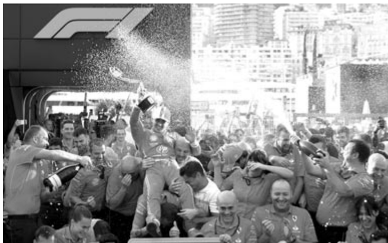
Nagy volt az öröm a Ferrari háza táján

* csapatok: 1. Red Bull 276 pont, 2. Ferrari 252, 3. McLaren 184, 4. Mercedes 96, 5. Aston Martin 44, 6. RB 24, 7. Haas 7, 8. Williams 2, 9. Alpine 2