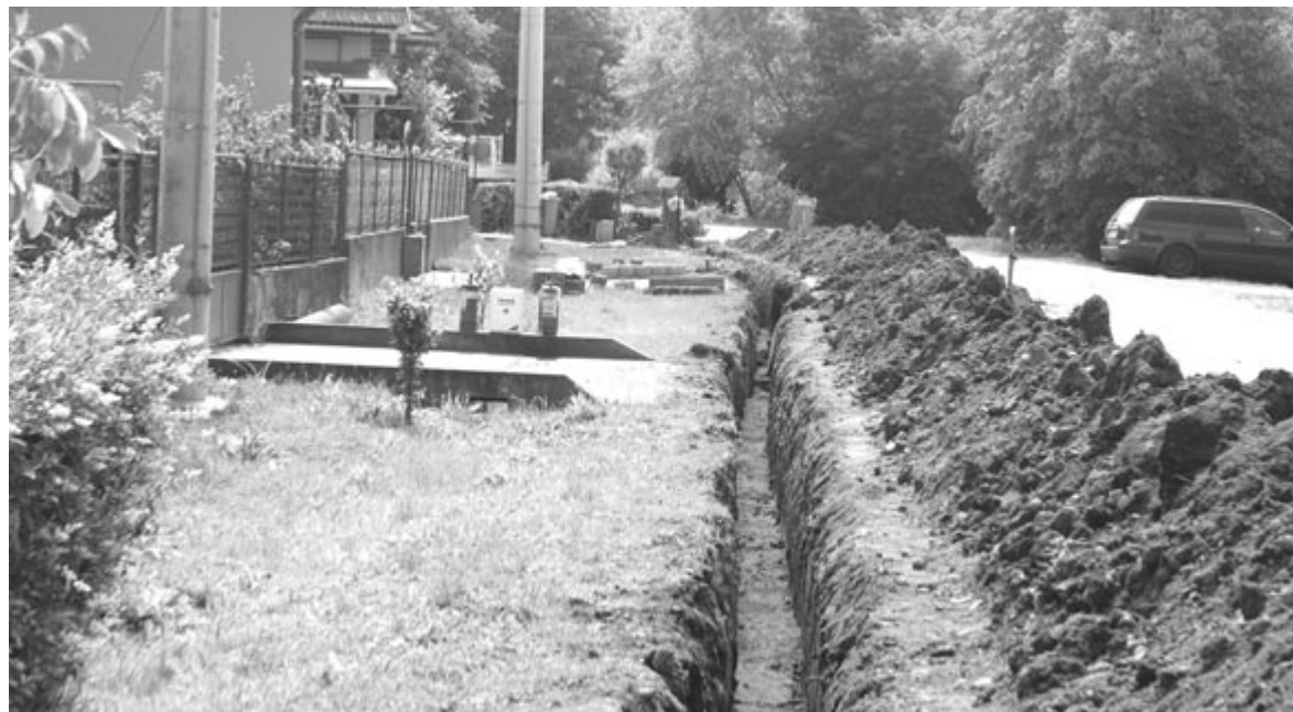
Székelykakasdon cserélik a földgázvezetéseket

– Az első számú prioritás, hogy vissza nem térítendő támogatást hívjunk le egy sportbázis megépítésére. A második helyen a föld alatti parkolóház szerepel, amire jelenleg szintén nem áll rendelkezésünkre pénzalap, a harmadik helyen pedig az esővíz-elvezető árkok és hidak korszerűsítése. Ugyanakkor azt szeretném, hogy az elkövetkező négy évben egyetlen aszfaltotlan utca se maradjon a községben – szögezte le a polgármester.