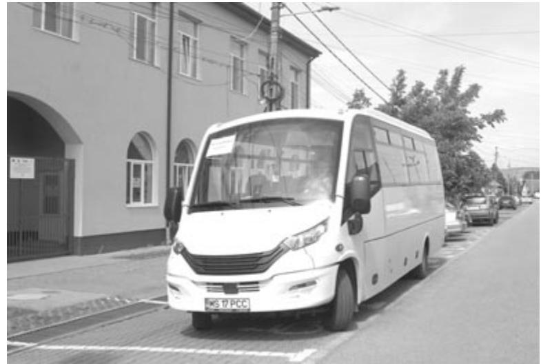
Az új iskolabusz

– Zsúfolásig megtelt a keresztúri kultúrotthon, kétszázán nézték meg a filmet. Bízom benne, hogy a következő, május 31-i vetítésre, a Semmelweis című filmre is ilyen sokan kíváncsiak lesznek – mondta a polgármester.