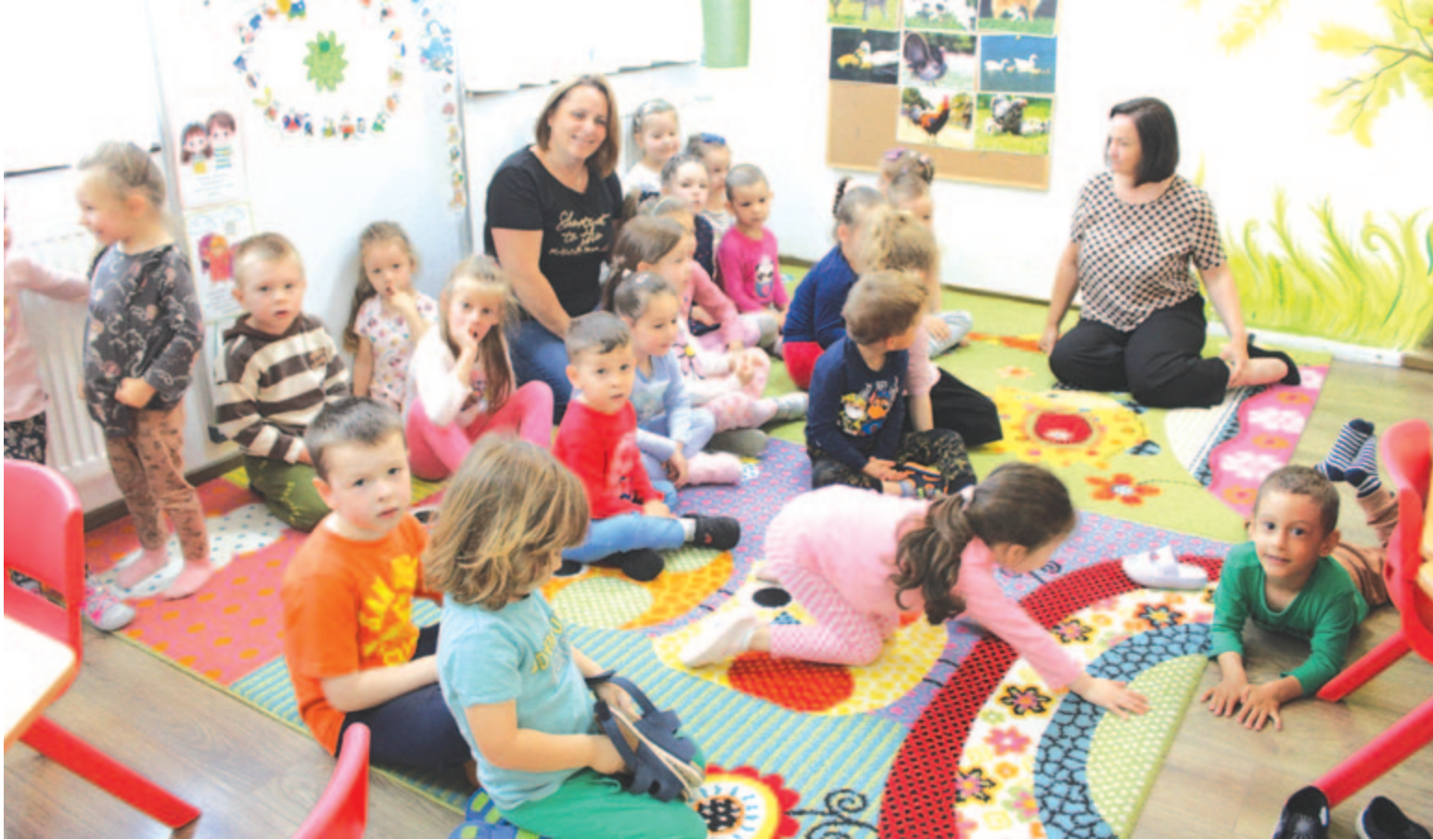
Maroskeresztúri vendégház az 5. oldalon