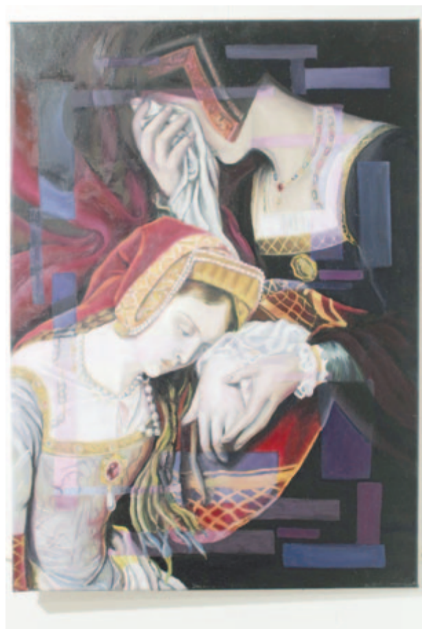
Baróti Bernárd festménye