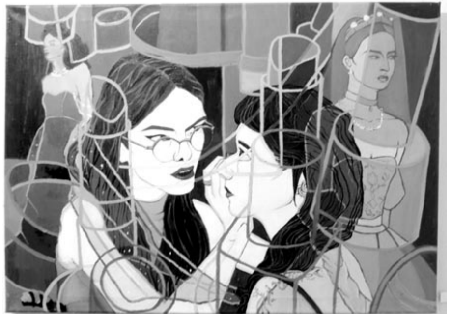
Baróti Bernárd festménye