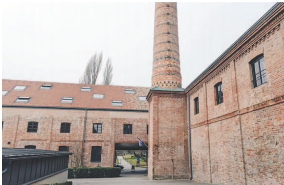
A Pécsi Tudományegyetem Művészeti Kara a Zsolnay negyedben

A Pécsi Tudományegyetem Művészeti Karán tervezett színház- és filmművészeti intézet létrehozása – a kar jelenlegi intézeteivel: a Képzőművészeti-, a Zeneművészeti- és a Design és Médiaművészeti Intézettel együtt komplex összművészeti egyetemi portfólió kialakítását teszi lehetővé, amely nemzetközi szempontból is egyedülálló, vonzó művészetoktatási kínálatot hoz létre – áll a közleményben.