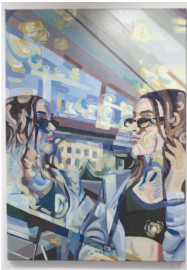
Mészáros Dorottya festménye