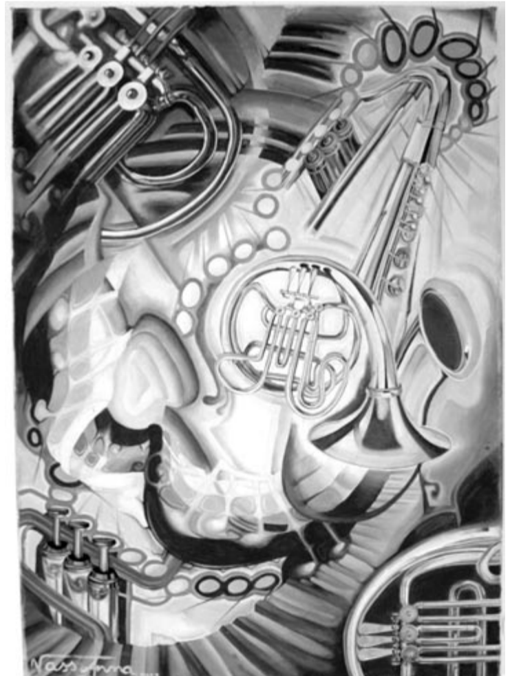
Vass Anna festménye