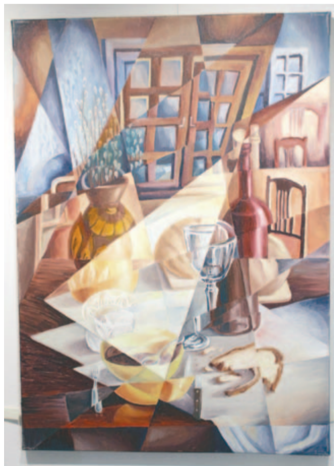
Kiss Noémi festménye