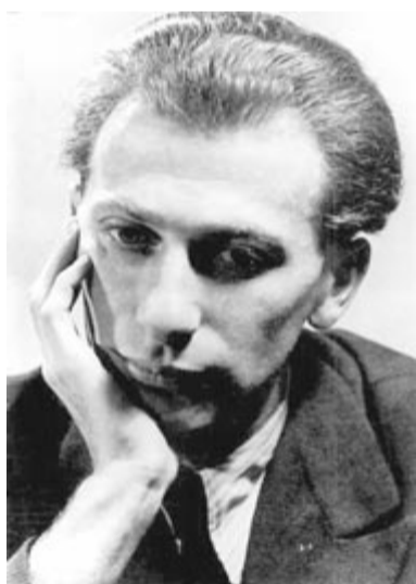
Radnóti Miklós 1935 körül

„Erőszakos, rút kisdéd voltam én, ikret szülő anyácska, – gyilkosod! [...] úgy emeltek föl a fény felé, akár egy győztes, kis vadállatot, ki megmutatta már; mennyit ér: mögötte két halott.” (Huszonyolc év, 1937)