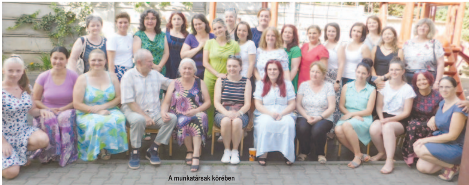
A munkatársak körében