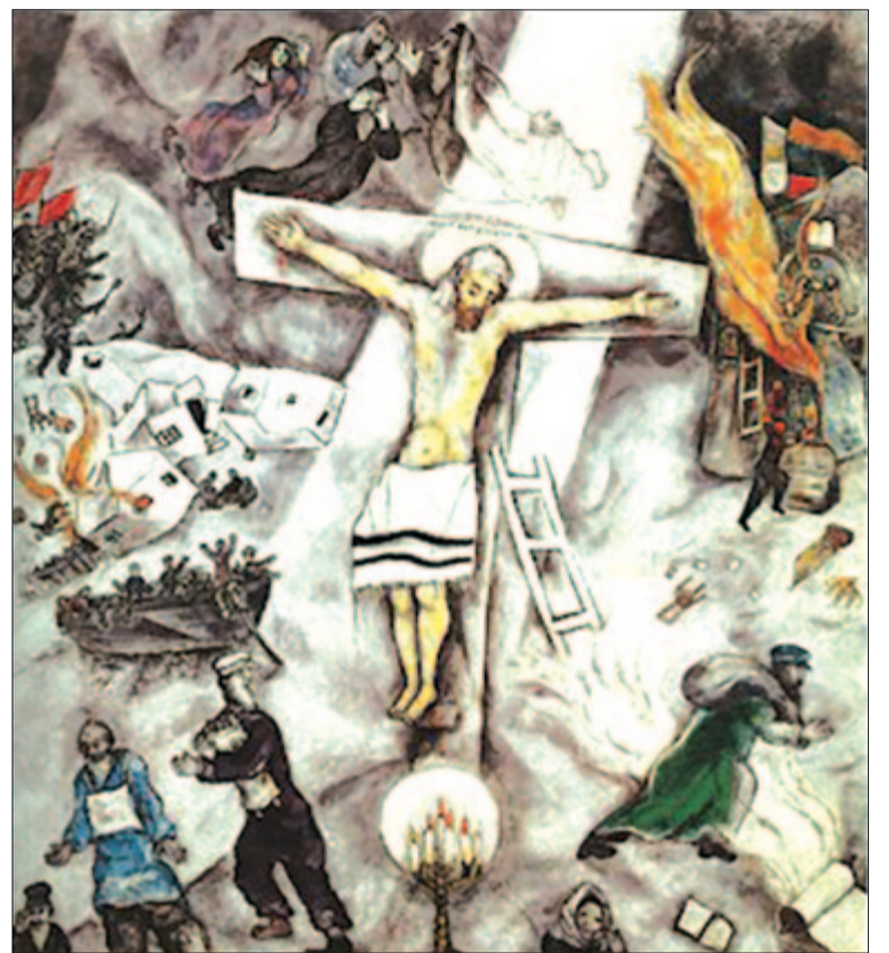
Marc Chagall: Fehér feszület

1816 júniusában egy francia hajóflotta indult Szenegálba, hogy visszavegye az angoloktól a gyarmatot. A Loire, az Argus és az Echo hajókat a Medúza vezette. Utóbbi megelőzte a flotta többi tagját, de a rossz navigáció miatt 160 kilométerre sodródott tőlük, majd zátonyra futott a mai Mauritánia közelében. A legénység próbálta kiszabadítani a fregattot, de sikertelenül, így a 400 utasnak hat csónakba kellett volna tömörülnie. Becslések szerint 150-en egy rögtönzött tutajra kény-