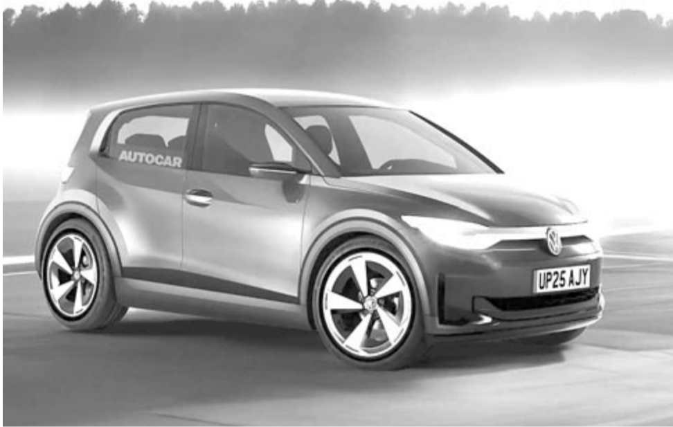
Volkswagen ID.1, koncepció