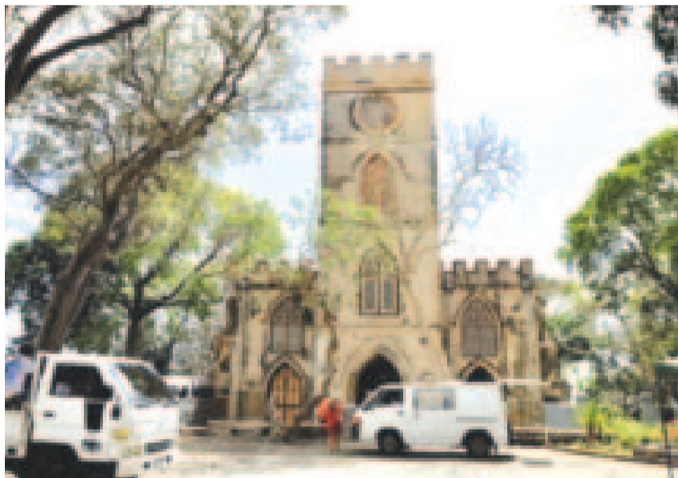
A St. John-templom

délnyugati partján fekszik, éghajlata trópusi. Az utak nagy része, legalábbis ahol mi jártunk, kevésbé forgalmas, és jól megtornáztatta a vesénket, de túléltük. Egy Bongo nevű gyógyfürdőt látogattunk meg, én, a kis naiv, gondoltam, segíteni fog, de nem első alkalommal tévedtem. Jó meleg vize volt, de raj-