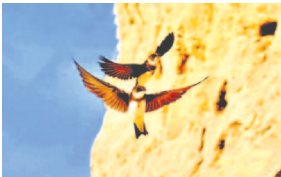
A csend törekeny fészket épít, / mint mart alatt a fecske.