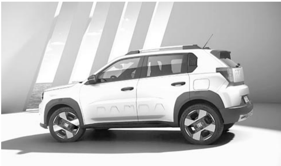
Fiat Grande Panda

A kérdés csak az, hogy mennyibe fog kerülni, de erre vonatkozó információk egyelőre nincsenek.