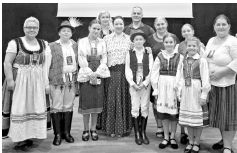
A döntőben is jeleskedtek a Marosvásárhelyi Művészeti Népiskola diákjai

A rendezvény fővédnöke, Sebestyén Márta a magyarság aranytartálékainak nevezte ezeket a gyerekeket, örömet fejezve ki ennyi nagyszerű, tehetséges gyerek részvétele kapcsán. A Kossuth- és Liszt Ferenc-díjas magyar népdalénekes, előadóművész szerint mindenki nyertes, aki megkapja „azt a lelki és szellemi töltést, amellyel továbbvihetik mindezt” – vélekedett a művész, aki szerint a mai médiaajánlat sokkal nehezebben kapják meg a gyerekek azokat a valós értékeket, amelyeket mi még megkaphatunk. (GRL)