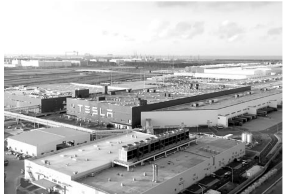
A Tesla kínai gyára, illusztráció