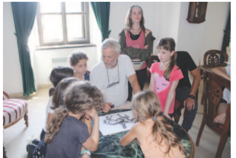
A szénrajzos foglalkozás