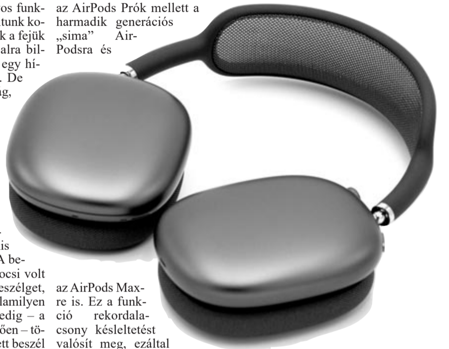
AirPods Max, illusztráció

az AirPods Prók mellett a harmadik generációs „sima” AirPodsra és