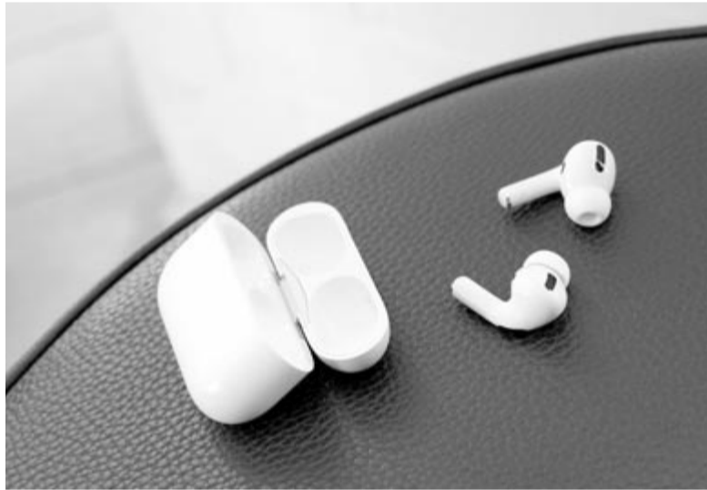
AirPods Pro, illusztráció

Mіндеzen újdonságok fényében kijelenthető, hogy az Apple látható szoftver nélkül is jelentős újításokat vezetett be egy készülék esetében. Ezen funkciók közül pedig szinte minden felhasználó találhat olyant, amely élvezetesebbé teszi a már meglévő eszközének a használatát.