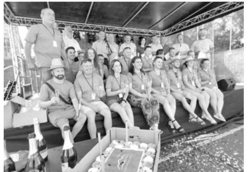
Húsz éve szolgálják a községet – ünnepelt mérföldkőhöz érkezve a Backamadarasért Egyesület

A színpadra szólított egykori tagok mellett nem feledkeztek meg a község egykori jegyzőjéről, néhai