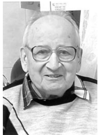
A gyászoló család. (23515-I)

„Kedveseim, én most elmegyek..., tovább így élni nem lehet, a csend ölel át és a szeretet. Isten veletek!”