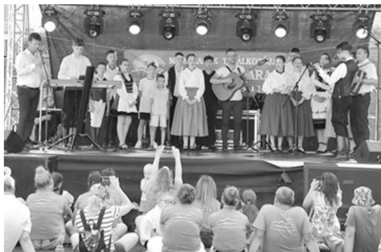
Minden település kulturális műsort mutatott be a színpadon

Százhusz vendéget fogadott a múlt héten Backamadaras: Erdélyből Csikmadaras és Mezőmadaras, az anyaországból Kunmadaras és Bácsmadaras küldöttségei érkeztek az ugyanazon nevet viselő települések immár tizenhetedik találkozó-jára. Pénteken Fehéregyházát, Segesvárt, Erdőszentgyörgyöt és a bőzdújfalusi templomot látogatták meg a vendégek, míg az ünnepi programokra szombaton került sor: délelőtt a református templomban megtartott istentiszteleten Nagy-Vajda Levente lelkész a testvéri szeretetről beszélt, a pillanatokat a gyülekezet Harmónia kórusának énekszolgálat, valamint a helyi hősök három emléktáblájának megkoszorúzása tette még ünnepélyesebbé.