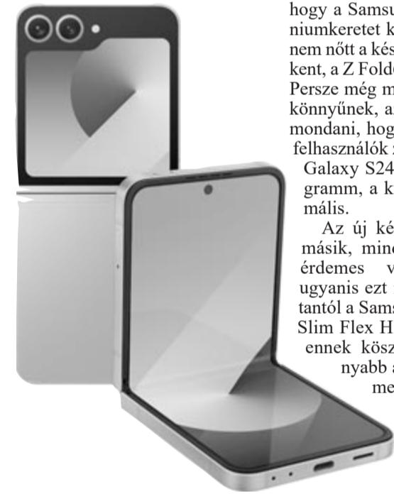
Samsung Galaxy Z Flip 6