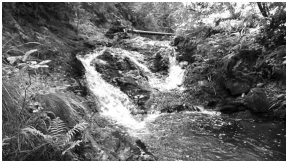
Valea lui Stan. Illusztráció