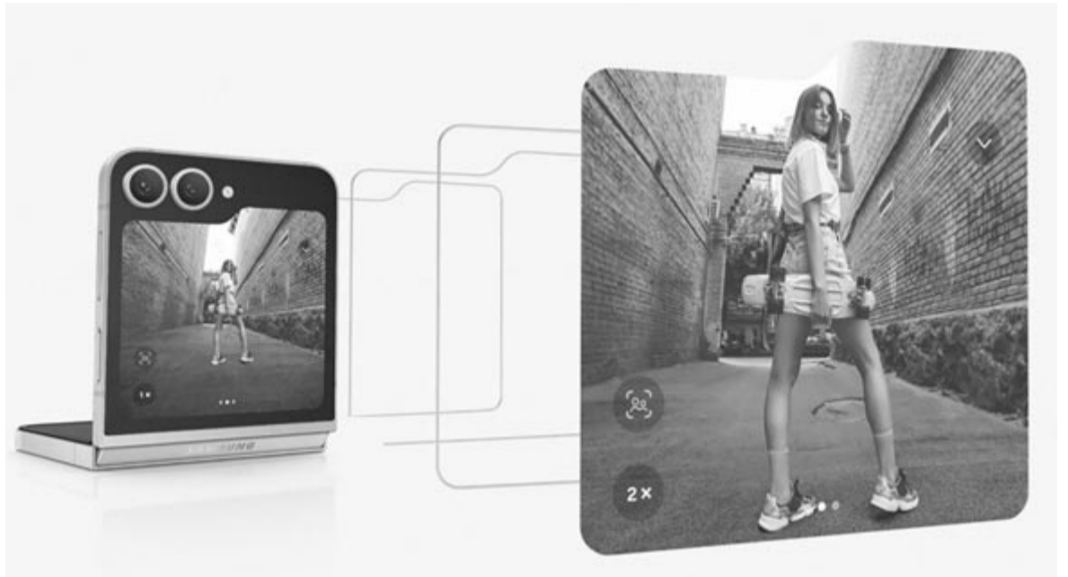
Samsung Galaxy Z Flip 6 Flex módban