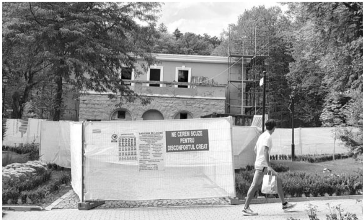
Dolgoznak a Doina mozinál

amely most, turisztikai csúcsidejében valódi oázis a kánikulai melegben hűsölni, pancsolni vágyó turisták számára, akik ellepik az utcákat és a strandokat, sétányokat. Hétvége a kellemes környezetben megnyugtató, üdítő megállni a kellemes környezetben, beülni az árnyékba egy fagyialtra vagy üdítőre, a könnyesszékernél kézbe venni, fellapozni egy-egy kötetet, miközben a Medve-tó szomszédságában élő zene, valamivel lennebb, az amfiteátrumban pedig kulturális és zenei műsorok várják esténként a vendégeket és érdeklődőket.