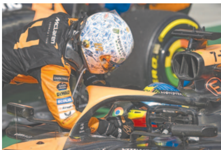
A győztes Oscar Piastri, a McLaren ausztrál versenyzője (j) és a második helyezett Lando Norris (b), a McLaren brit versenyzője a Forma-1-es Magyar Nagydíj végén a mogyoródi Hungaroringen 2024. július 21-én

„Természetesen az élen haladva sok minden átfut a fejedben, ebben a sportágban néha önzőnek kell lenned és magadra kell gondolnod, de ugyanakkor csapatjátékos is vagy. A múltban sokszor ő támogatott