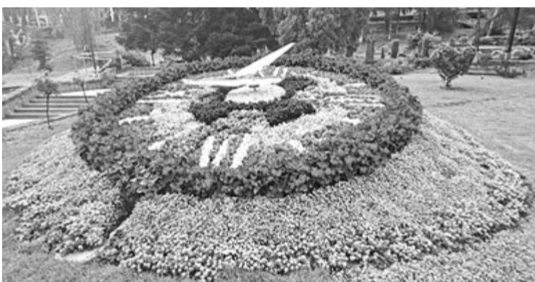
Szovátai virágórával büszkélkedhet

A 2,3 millió lej értékű beruházás során megújul az épület tetőzete, nyílászárókat cserélnek, hőszigetelők, homlokzatfelújítás is lesz. A kivitelezés időtartama egy év, így az önkormányzatnak döntenie kellett, hogy elkezd most a kivitelezést, és az idei turisztikai és nyári kulturális idején zavarják meg esetleg vele, vagy csak a turisztikai fődény lejártával, ősszel látnak hozzá, és a jövő évi turisztikai idején érinti majd. Végül úgy döntöttek, hogy miha-