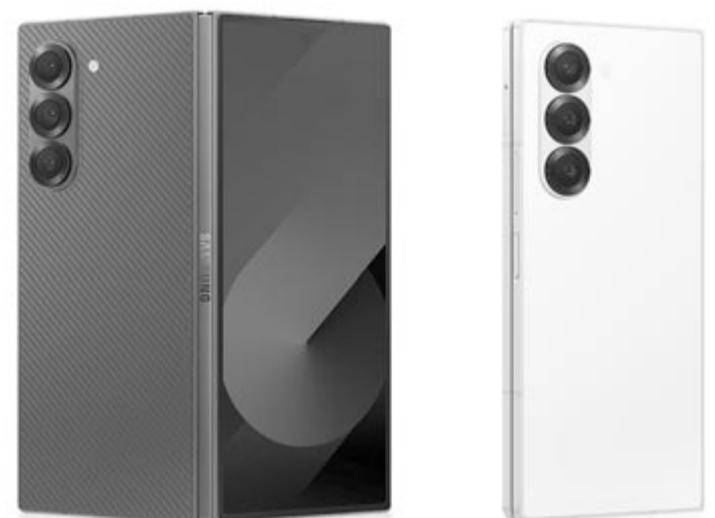
Samsung Galaxy Z Fold6

Végül, de nem utolsósorban azt ígéri a Samsung, hogy a Flip 6-7 évig fog szoftveres támogatást kapni. A készülék Android 14 operációs rendszerrel és One UI 6.1.1 felülettel jelent meg, ebből pedig egyenesen következik, hogy az Android 15 és az One UI 7 lesz az első nagyobb frissítés, amit megkap.