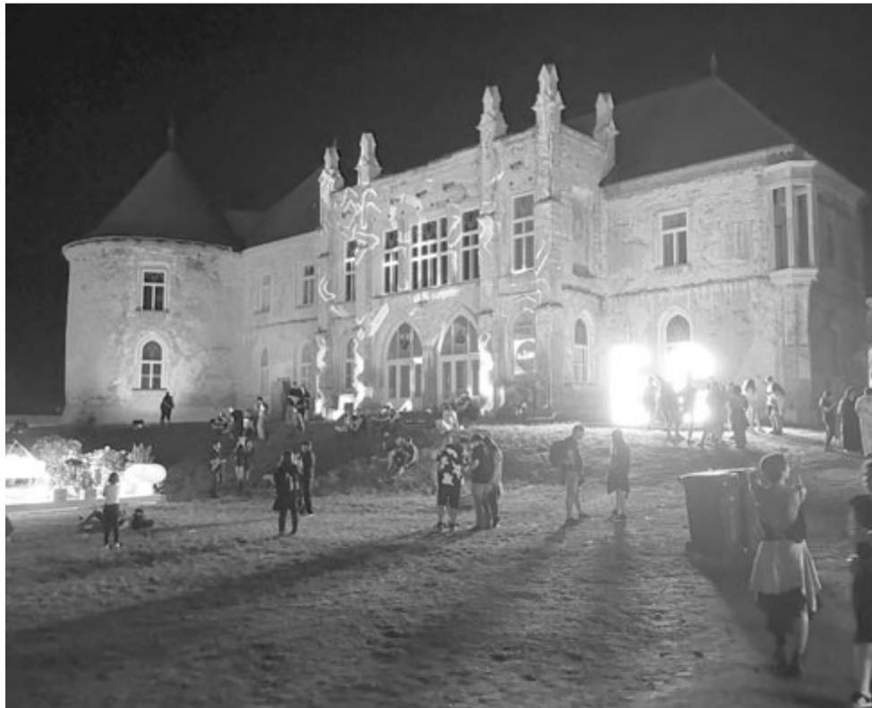
A Bánffy-kastély az ideai Electric Castle harmadik napján

Ha valaki arra vágyik, hogy megtapasztalja, milyen egy igazi felszabadult fesztivál, annak érdemes kilátogatni Bonchidára, az Electric Castle valamelyik következő kiadására. Ahol azt is a saját szemével láthatja, hogy milyen az, amikor több százezer ember kulturáltan, egymásra odafigyelve szórakozik, illetve amikor a szervezők pár napra ténylegesen felépítenek egy „várost” a fesztivál területén, ahonnan az is fájó szívvel megy haza, aki már számos más – akár nagyobb – ilyen rendezvényen is megfordult.