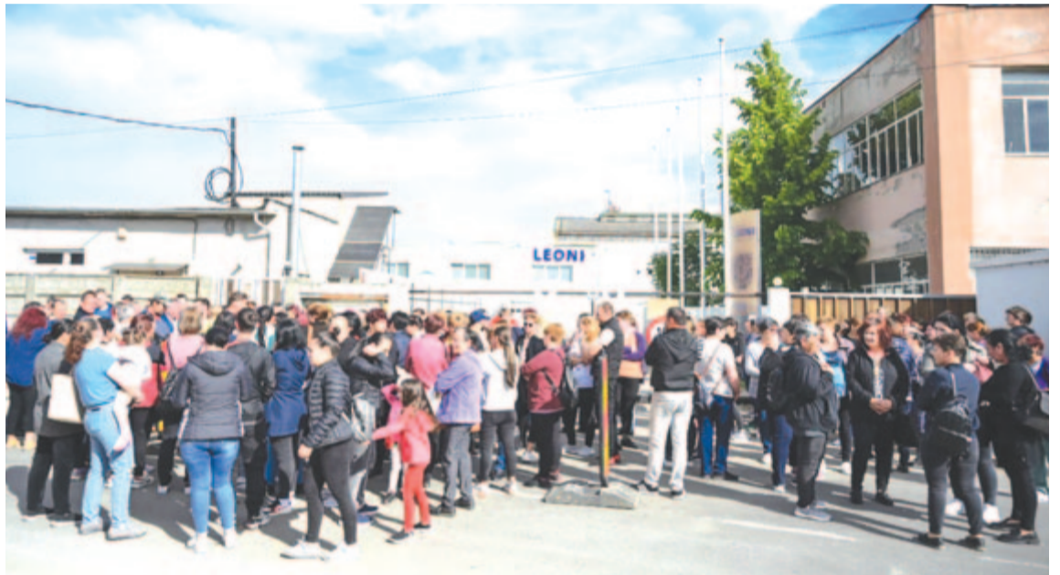
Májusban a marosludasi üzemét zárta be a német autóiipari vállalat

Romániában a Leoni Aradon nyitotta meg az első üzemét 2000-ben, jelenleg 10 üzeme van, a besztercei a legnagyobb. A vállalat május elején jelentette be, hogy bezárja a 200 dolgozót foglalkoztató marosludasi üzemét az elektromosautó-ipari megrendelések csökkenése miatt. (MTI)