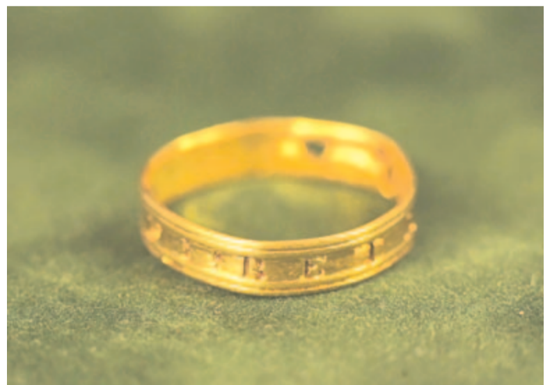
Értékes leletek, köztük Bethlen Zsófia gyűrűje