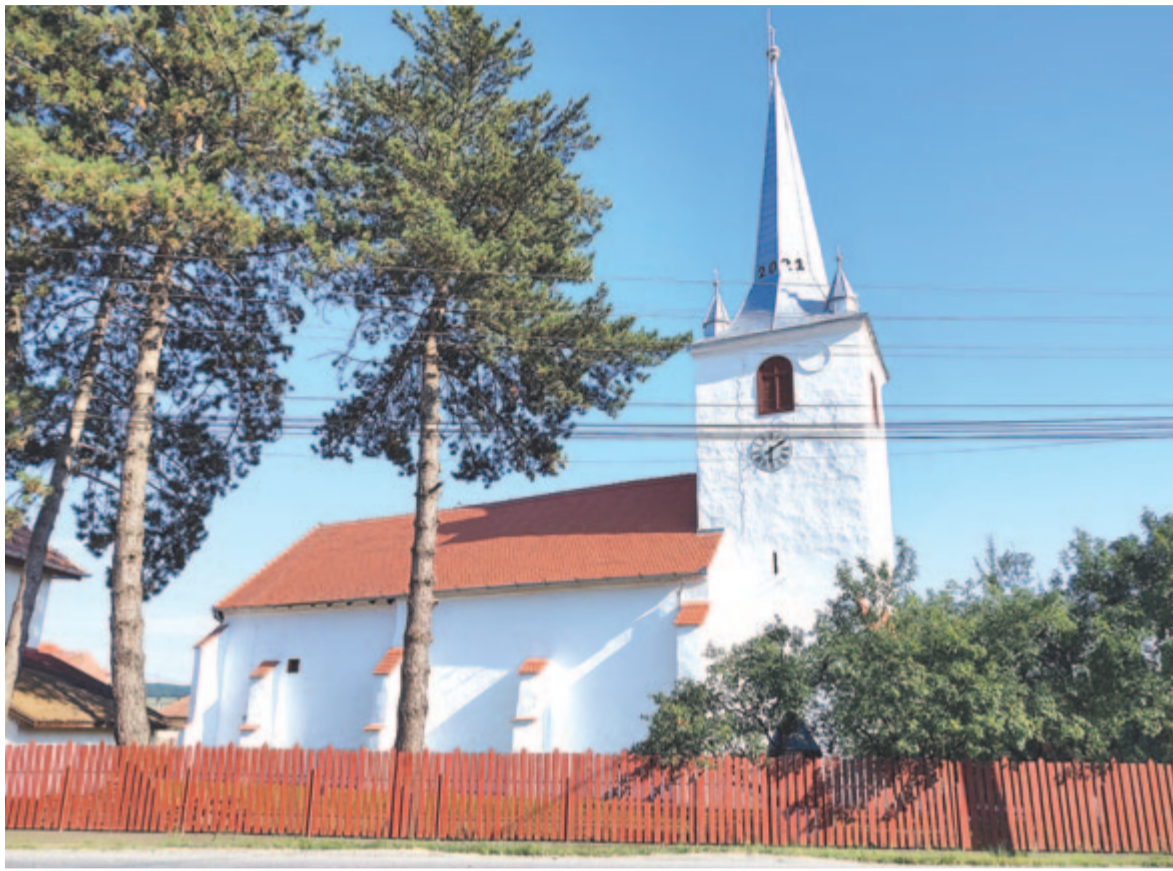
Az ásatásokon bukkantak rá a kriptára és ritka kincseire

A templom jellegéből adódóan nem elég csak a kriptáról beszélni