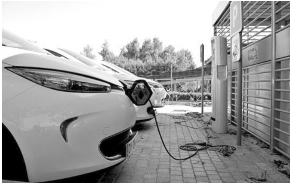
Elektromos autó, illusztráció