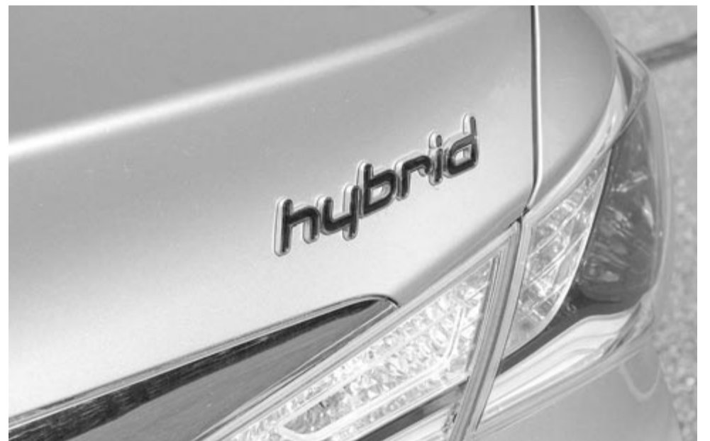
Hibrid autó, illusztráció

Közleményében arról számolt be, hogy az év első felében 41%-kal nőtt a hibrid modelljei eladása a tavalyi év azonos időszakához képest. Arányaiban nézve komoly fejlődés,