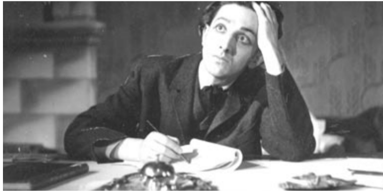
Az első nagyszínházi szerep: Treplov (Sirály, 1951)