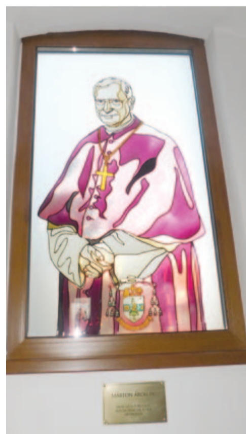
Márton Áron püspök – üvegablak

– Én mindenütt szerettem, nekem mindennél jó volt, csak nem mindegy, hogy kilenc településen 800 léleknek, itt pedig egyből 3000-nek lettem a lelkésze. Tennivaló volt-