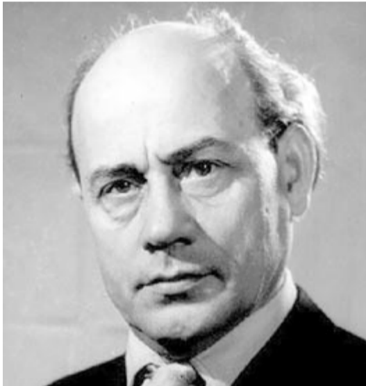
Tamási Áron 1928-ban

„Egy eléhezett, szomorú kutya. Ott feküdt valami gyenge szénavackon, s még annyi ereje sem volt, hogy felkelhetett volna, amikor bementünk hozzá. Legtöbb volt, amit tett, hogy a fejét felemelte valamicskét, s úgy nézett hol engemet, hol apámat, akár a haldokló, aki nem tudja, hogy kettőnk közül melyik az Isten. A színe nem volt éppen veres, amilyennek a bégyült fényben az ablakon keresztül láttuk, hanem inkább barna. A teste az éhség pusztításai után is elég nagyknak látszott, de abban sok része volt a gyapjának is, amely gazdag rendtelenségben takarta.