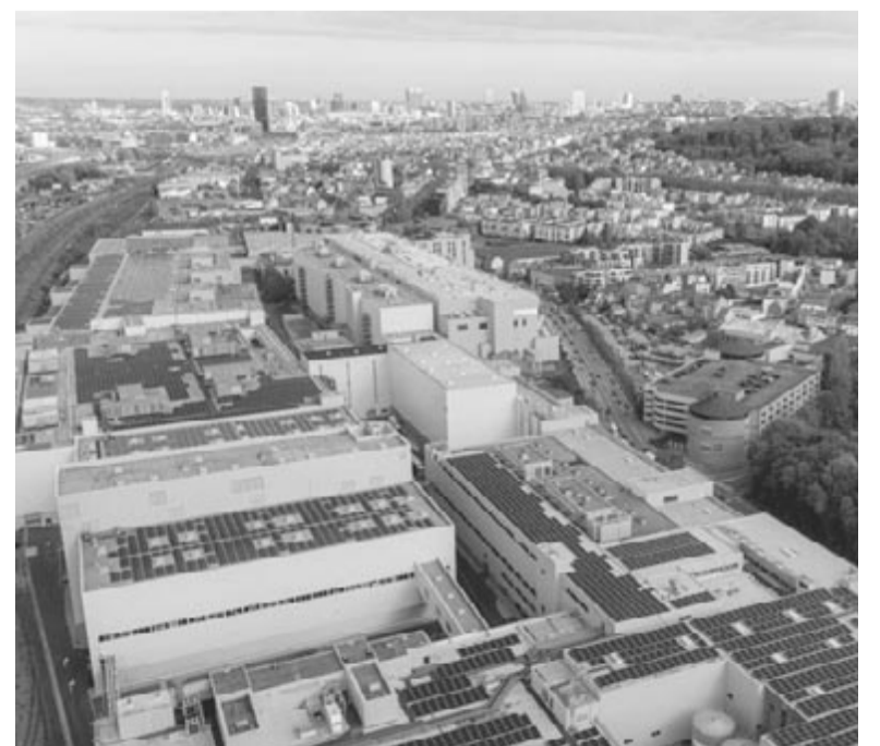
A Volkswagen cégcsoport brüsszeli gyára

tosan bezárja a gyárat, hanem azt, hogy mérlegeli ezt a lehetőséget is. Továbbá azt is szem előtt tartja, hogy az Audi még az év első felében jelezte, hogy eladásai idén csökkenni fognak, amit azzal magyarázott, hogy új modellek bemutatásán dolgozik. Eközben pedig a Volkswagen konszern csökkentette az üzemi nyereségrátával kapcsolatos várakozásait: 7-7,5%-ról 6,5-7%-ra.