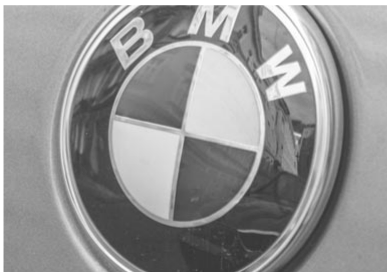
A BMW a legkelendőbb német prémium minden tekintetben

Ha a fent említett számok nem lettek volna elég érdekesek, rá kell nézni a villanyautó-eladásokra. Ebben a tekintetben is a BMW áll az élen, az előnye kiemelkedő. Az idei év első felében 180 ezer villanyautót adott el, ami az előző év azonos időszakához képest 34%-os növekedést jelent, mindezt úgy, hogy közben a Mercedes eladásai 17%-kal csökkentek ebben a szegmensben, a csillagos márka mindössze 93.400 elektromos autót tudott eladni. Az Audit se felejtjük ki a sorból, hiszen esetében ugyan nőtt az eladások, de mindössze 1,3%-kal, ez pedig csak arra volt elég, hogy megőrizze a harmadik helyet a dobogón ebben a tekintetben is. Ami a négykarikás márka villanyautóit illeti, éppen a napokban röppent fel a hír, hogy az ebben a tekintetben zászlóshajónak számító Q8 e-torn gyártásának leállítását tervezi a gyártó, ezzel együtt pedig a brüsszeli telep bezárását; ez azért is sokkoló, mert a Volkswagen csoport az elmúlt 36 évben egyetlen