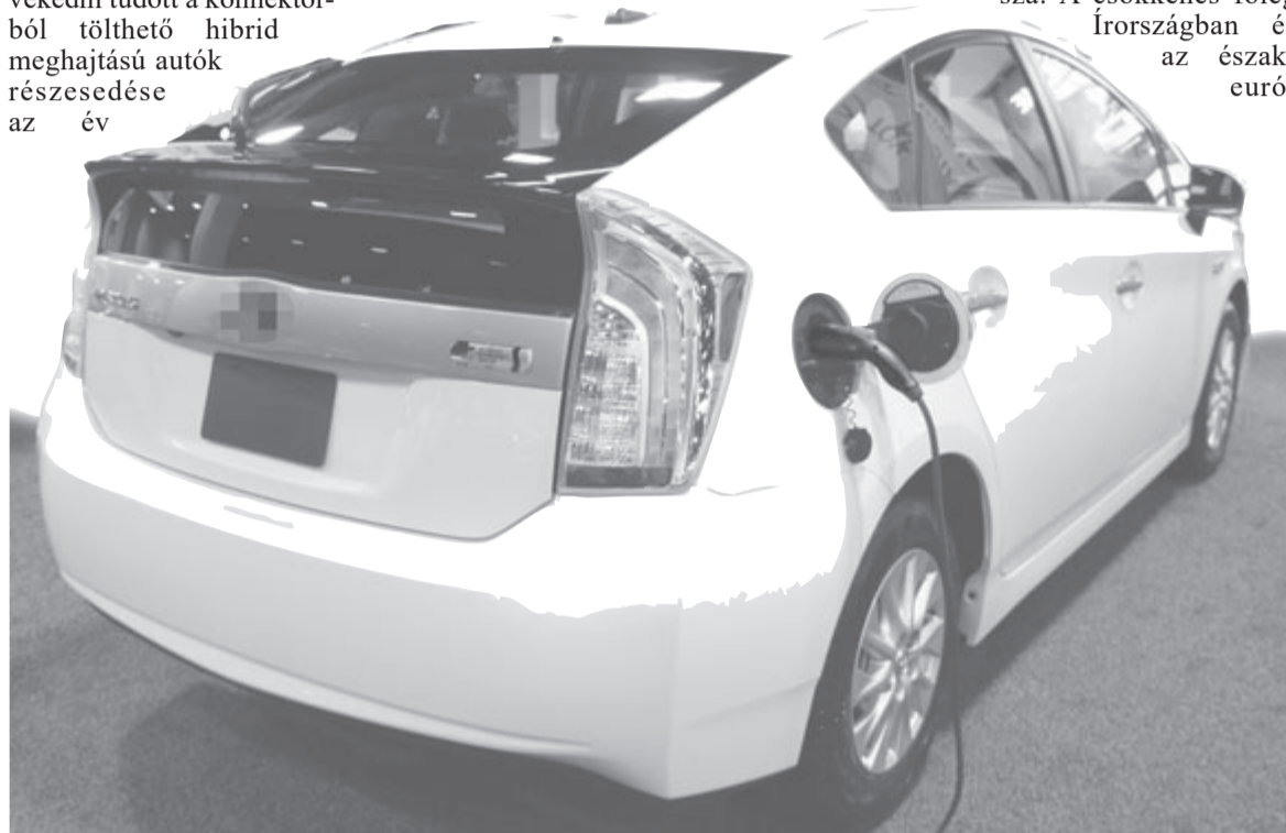
Konnektoros plug-in hibrid, illusztráció

kivette a részét abból, hogy növekedni tudott a konnektorból tölthető hibrid meghajtású autók részesedése az év