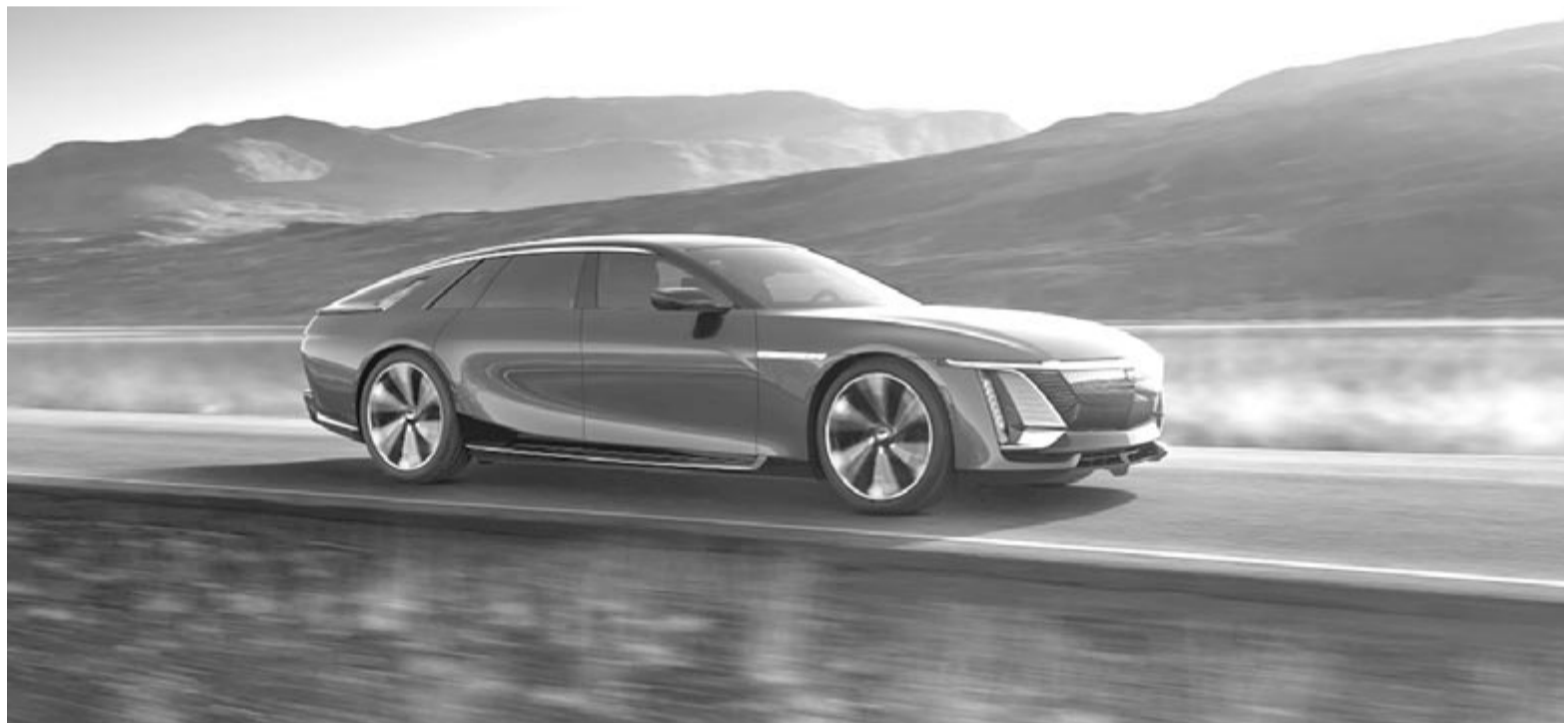
Elektromos Cadillac, illusztráció

A Genesis és a GM mellett egészen biztosan még sok olyan autógyártó lesz, amelyik inkább a hibrid modellekre helyezi a hangsúlyt. Nem kizárt, hogy az egyik ilyen a Volvo lesz, hiszen az egykori svéd márkának 2024 első negyedévében 65%-kal zuhantak a villanyautó-eladásai, miközben 45%-kal több hibridet értékesített. Ilyenformán a Volvónak is érdemes lehet követni a korábban említett két gyártó stratégiáját. És hogy ki az, aki a jelenlegi helyzetben nevet a markába, mert ismételtlen ő került versenyelőnybe? A Toyota!