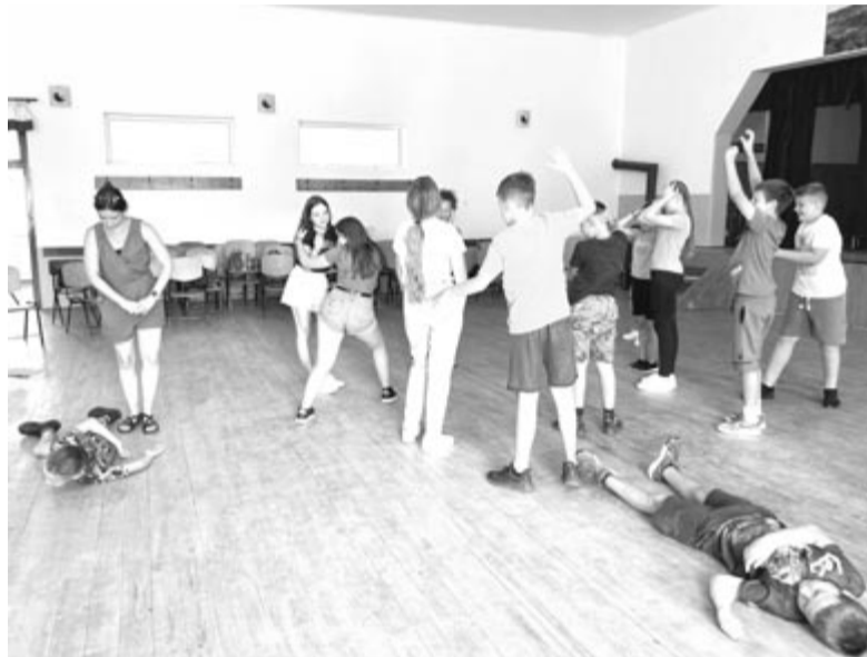
Sok érdekes program és élvezetes darabok – ezek jelentették a múlt heti tábor lényegét