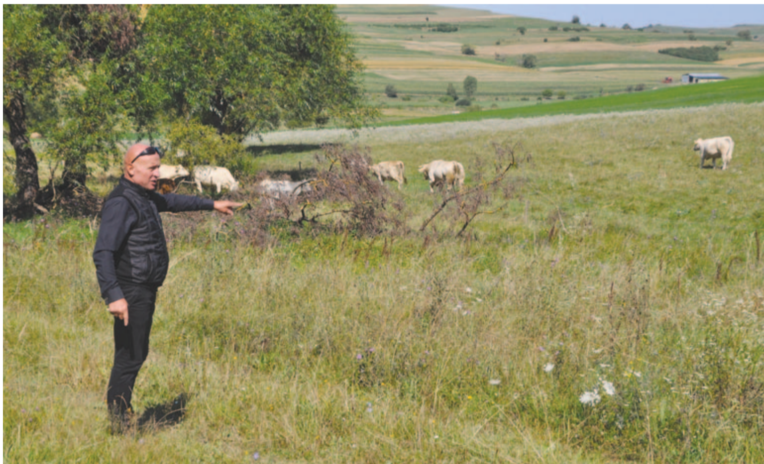
Megőrzik a legelők biológiai sokféleségét

Ne feledje idejében megújítani előfizetését! Ha előfizet, biztosan kézhez kapja, féláron, mint ha megvásárolná!