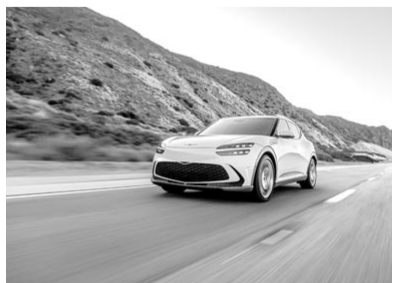
Az elektromos Genesis GV60, illusztráció

Ezt az elméletet jól alátámasztja a BYD Seal U crossover plug-in hibrid változata, amelyet Spanyolországban már forgalmaznak, és nem melleleg az eladások 60-70%-át teszi ki. Ez tökéletesen igazolja, hogy van kereslet megfizethető plug-in hibridekre, Kína pedig ebből is profitálni akar. Tehát az európai autógyártóknak gyorsan kell lépniük ahhoz, hogy versenyben maradjanak, valamint olyan ajánlatot