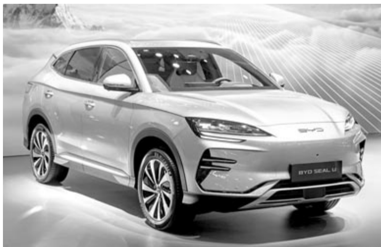
BYD Seal U, illusztráció