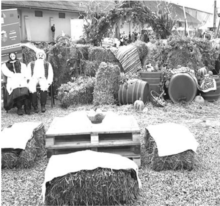
Idén is elmarad a balavásári szüreti fesztivál

A polgármester hozzáfűzte: nem sok visszajelzést kapott a lakosságtól, de akiknek beszéltek arról, hogy milyen okok miatt nem lesznek községnapok, azok megértették. Egyébként is az idén már voltak olyan események, amikor testvértelepülési küldöttségeket fogadtak, vagy ők utaztak a testvértelepülésekre, és voltak olyan rendezvényeik (mint a szolgálati lakások hivatalos átadása), amelyeken nagyon sok vendég és helyi lakos is részt vehetett, és ha idén még lesznek