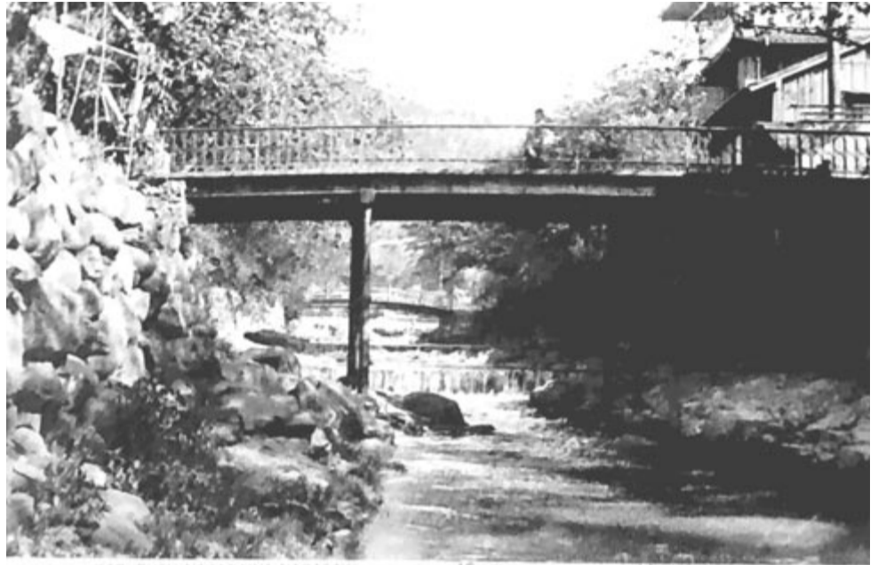
Nagasaki, 1920 – huszonöt évvel a második bomba előtt Karurusu nakagawa, a vízesések völgye

Augusztus 6. – Hiroshima, augusztus 9. –