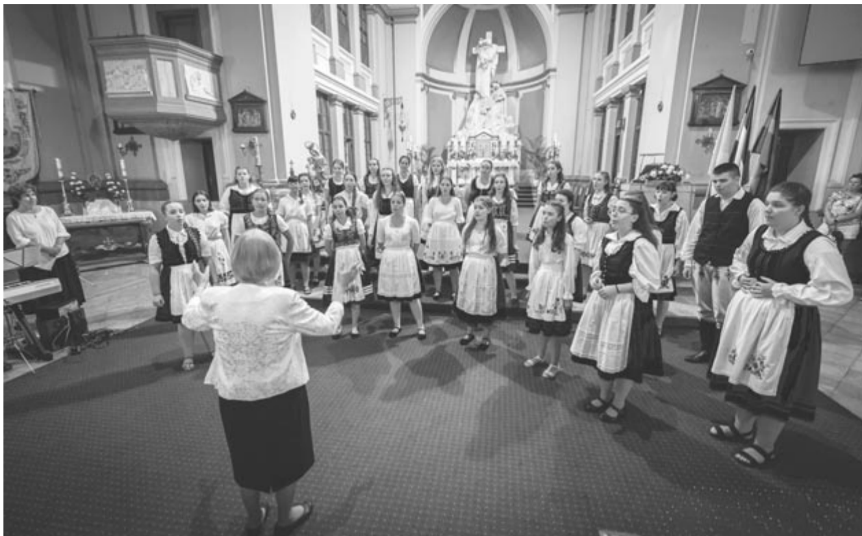
Idén kilenc helyen énekeltek