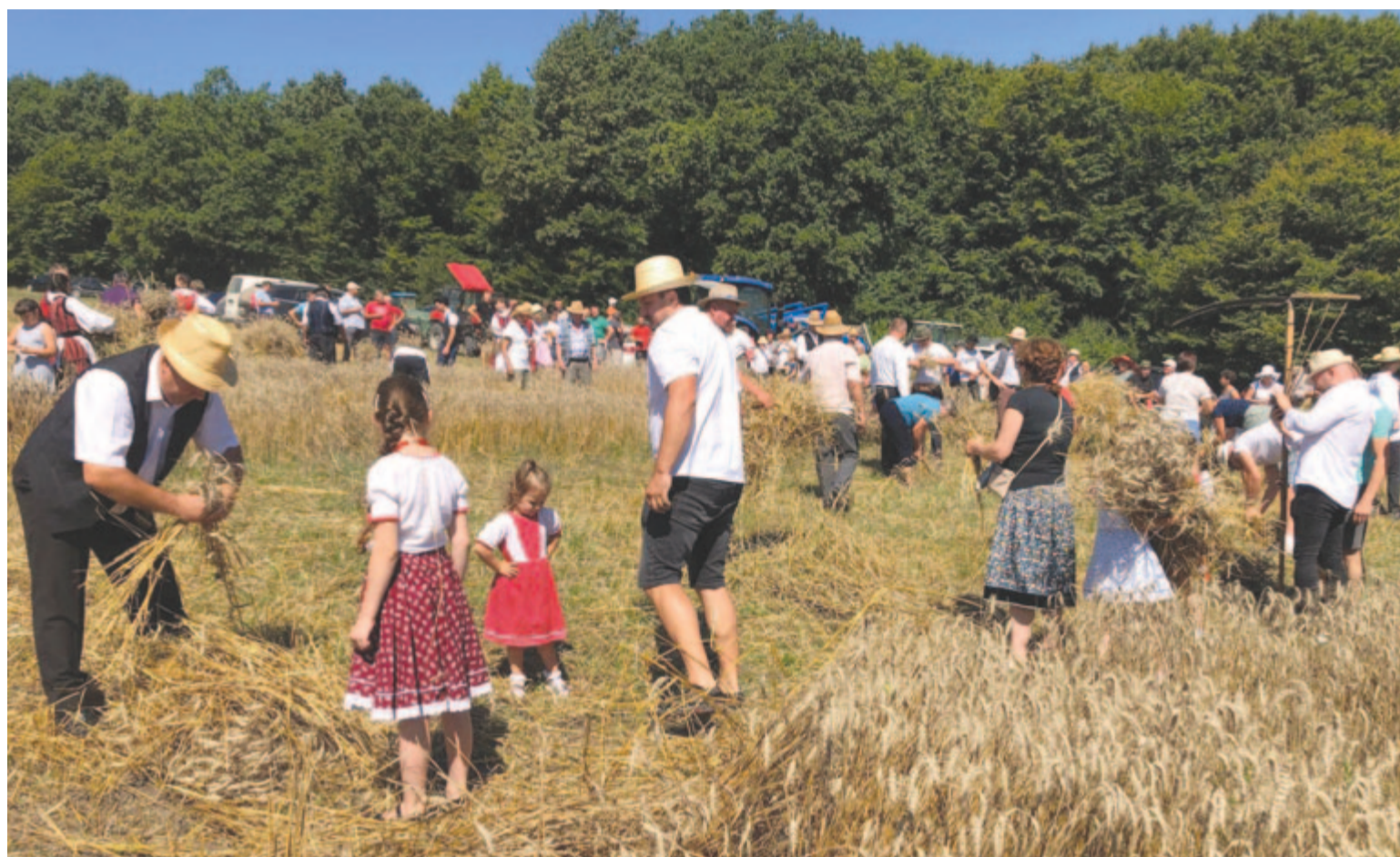
Fiatalkor és idősök is magukénak érzik az aratóünnepséget