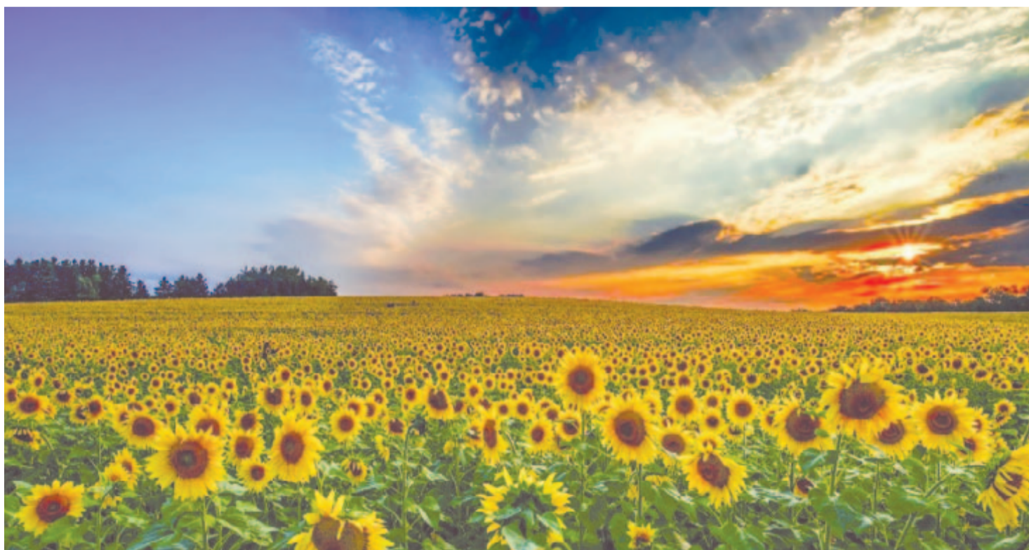
Napraforgók réztányérai fölött mályvaszín felhőkbe nyugszik a nap

Maradok kiváló tisztelettel Kelt 2024-ben, új kenyér havának harmadik napján