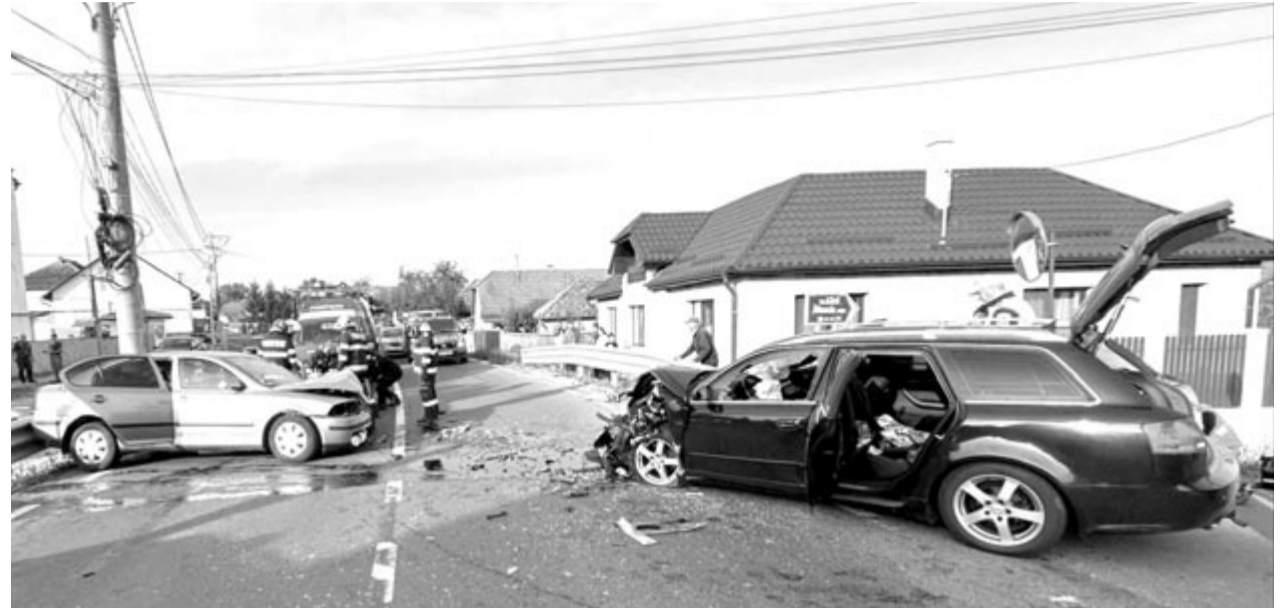
A szőkefalvi baleset

Ugyancsak csütörtökön délelőtt 9 óra körül a dicsőszentmártoni tűzoltókat Szőkefalvára irányították egy közúti baleset miatt, ahol két autó ütközött össze. A balesetben egy személy könnyebben, míg másik kettő súlyosabban sérült meg, egyiküket feszítővágó segítségével emelték ki a roncsból. (pálosy)