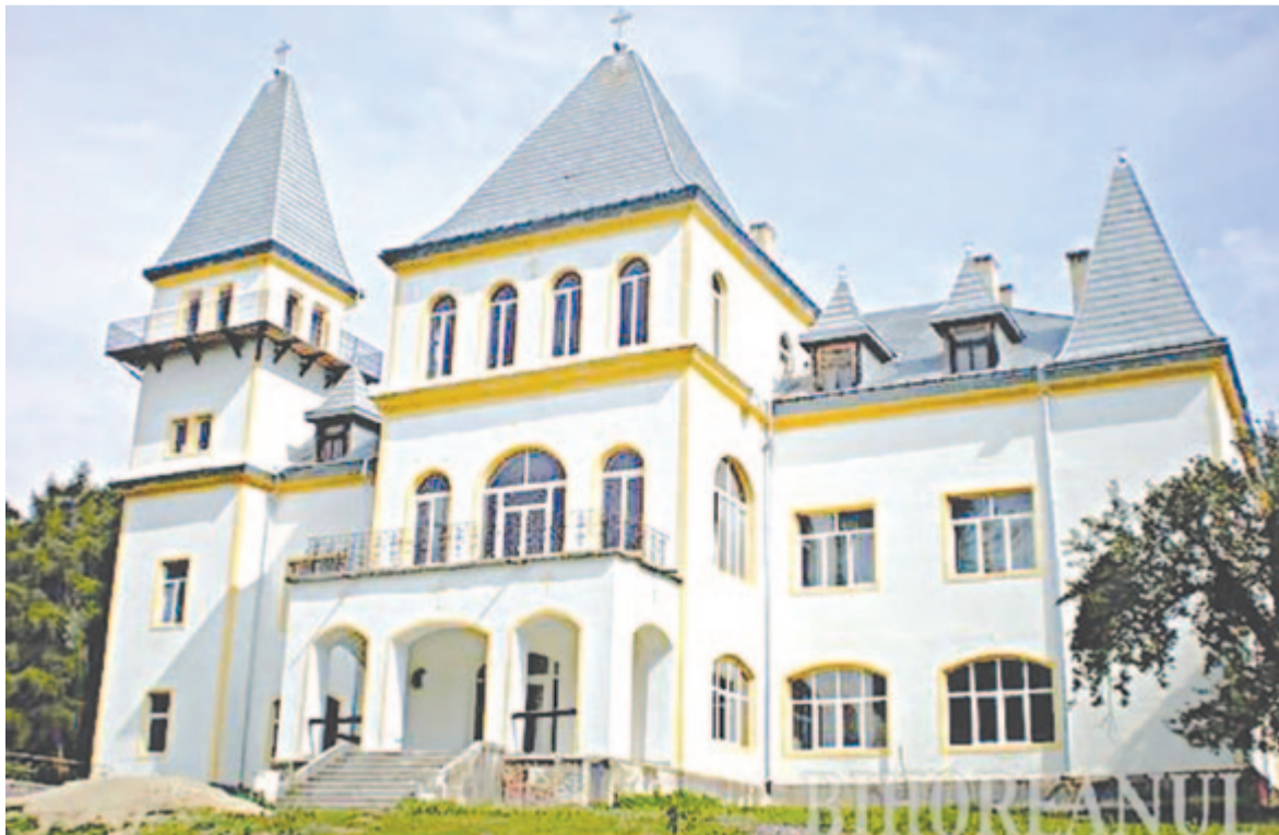
A magaslaki Zichy-kastélyt ma apácák lakják

A kastély hátsó homlokzata szinte megegyezik az elsővel. Ehhez tartoznak a lépcsőházak. A kastélynak egykor kertje is volt, de mára ezt megszüntették.