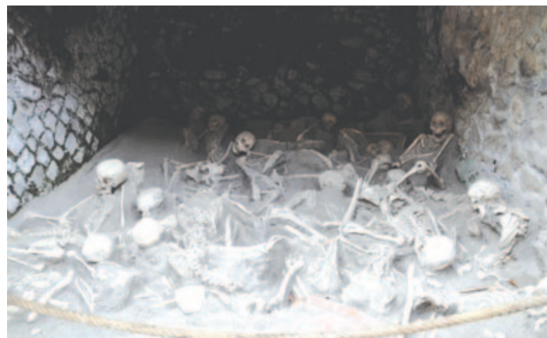
A kikötőből menekülni próbálók maradványai

tettek a falai közé. I. sz. 62-ben földrengés pusztította a várost, amelyet újjáépítettek, de alig pár évvel ezután, i. sz. 79-ben Pompejivel együtt betemette a vulkáni iszap. Az iszap fölé Resina néven falu épült. Az itt lakók már a középkorban tudták, hogy az egykori római város fölé építkeztek. Érdekes az ásítások kezdete is. 1709-ben egy lovassági tábornok resinai villája kertjében kutat ásított, és az ásók az egykori római város színházának falába ütköztek. Átvették a falat, és megtalálták a színház folyosóját, majd tovább kutatva előkerült a színpad márványpadozata és több értékes