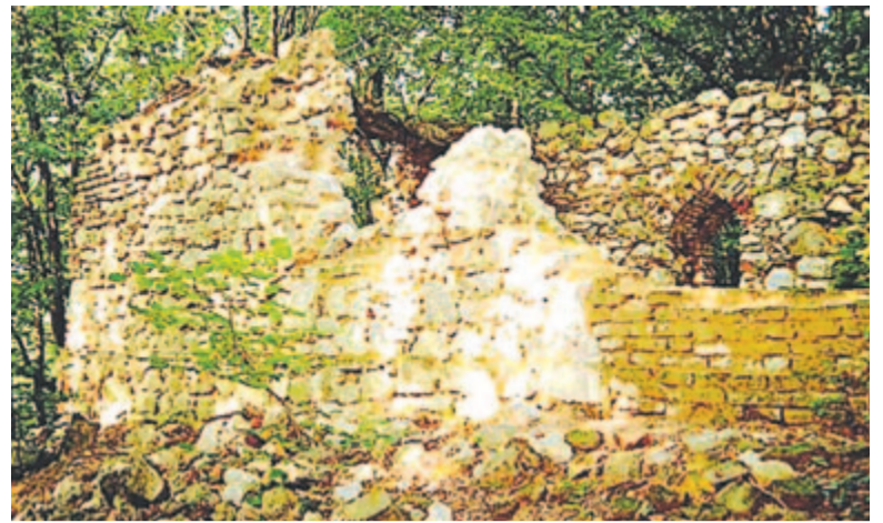
Sólyomkő várának maradványai