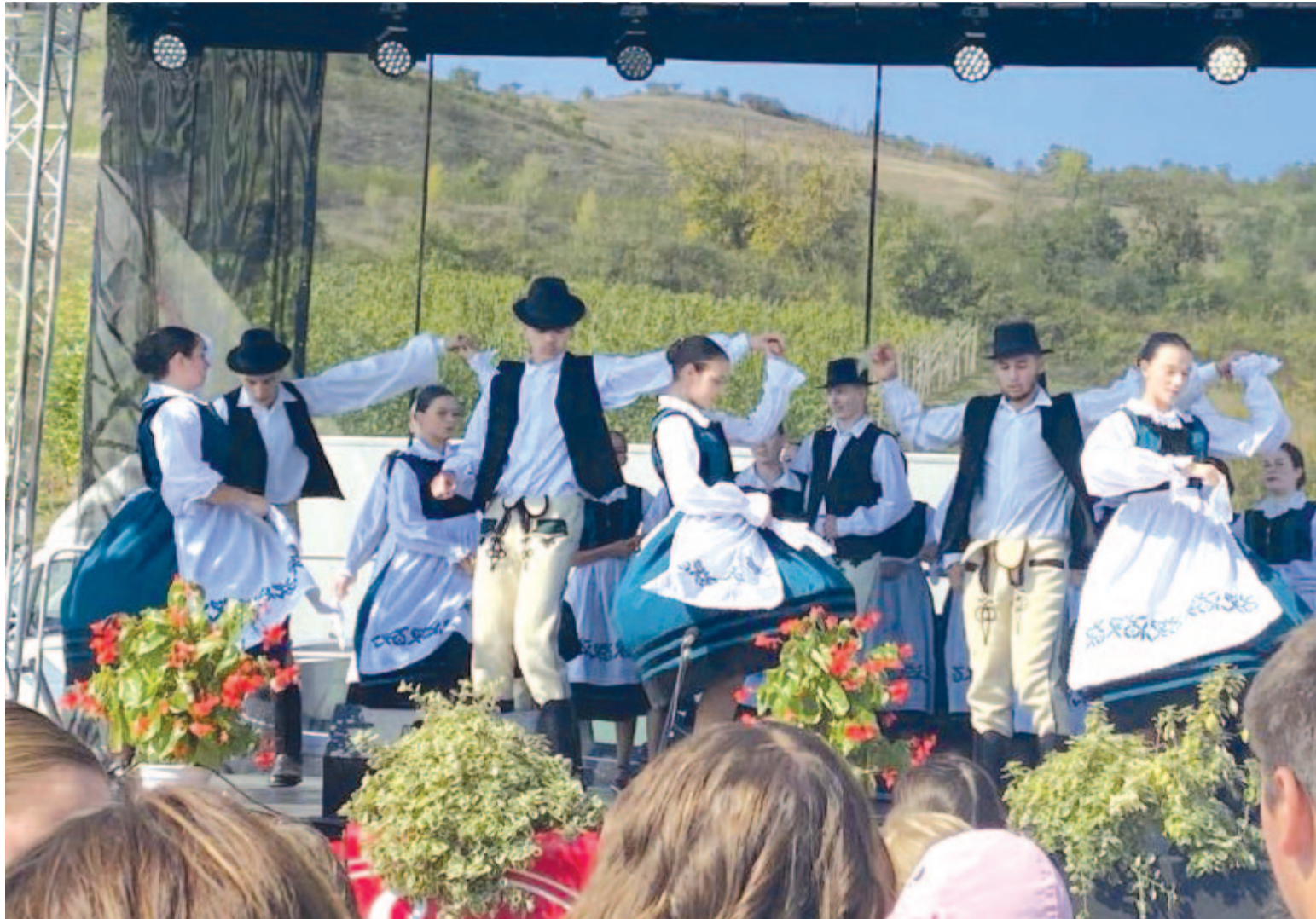
A szüret mindig örömműn, így volt ez a múlt szombaton is