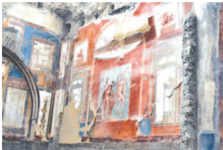
Augustus iskolájának nemrég feltárt freskója

bérlet is lehet vásárolni. A metróállomásokon automata jegyváltók vannak. Figyelmesnek kell lenni, hogy a négy vágány közül melyiken várja a megfelelő vonatot az utazó, ugyanis nincsenek irányító, eligazító táblák. Lézenegnek készsleges segítők, akik útba igazítják a bizonytalan turistákat, de azonnal a műanyag poharat is az orrod alá dugják, hogy aprópénzzel támogasd a jótétet. Az érkezési időpontot alig néhány perccel a szerelvény érkezése előtt közli a tábla.