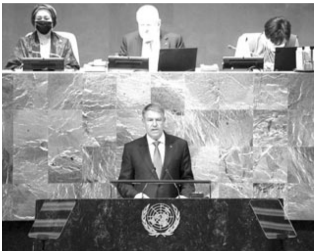
Iohannis az ENSZ pulpitusán

Végezetül azt is elmondta, hogy Románia figyelemmel kíséri a nemek közötti egyenlőség helyzetét. „Az Emberi Jogi