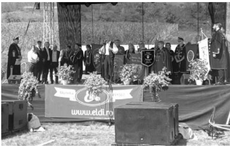
Számos borlovag és díszvendég tisztelte meg az ünnepséget