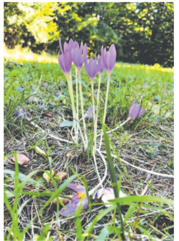
„Őszi kikirics” – virága halvány, zöld levele nincs

Szeptember 28-án, 1823-ban született Schenzl Guidó meteorológus. A stájerországi Admont kolostorának papjából magyar értelmű, magyar intézmények alapjait lerakó, nemzetközileg is elismert tudós lett. 1854-ben kezdte meg működését Budán, 1859-től