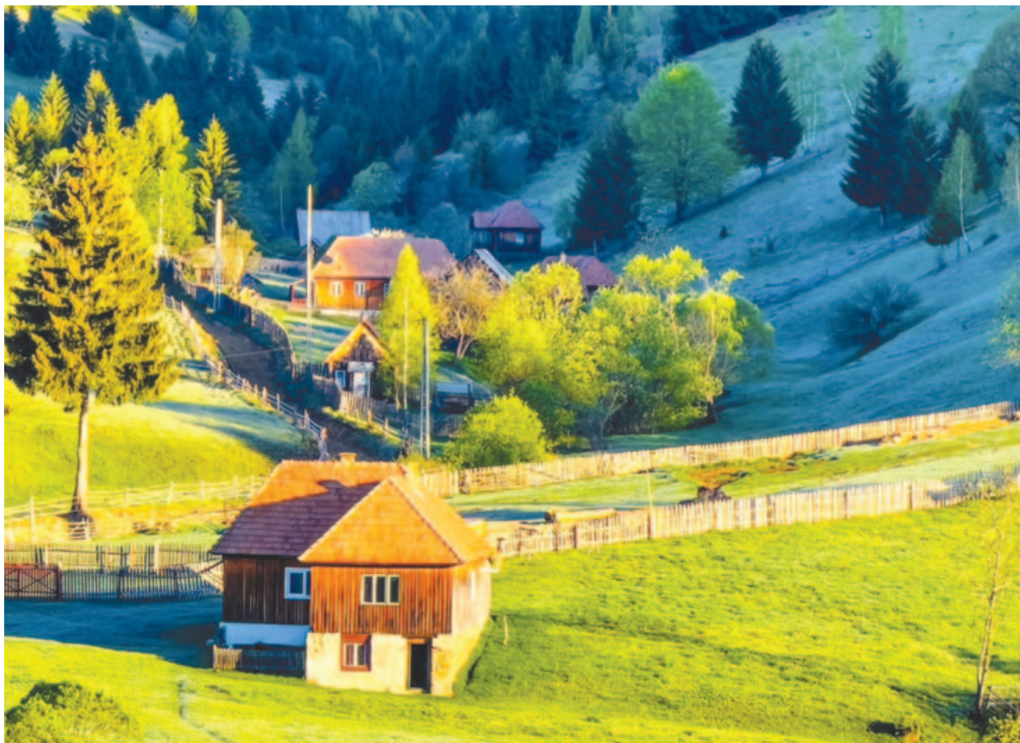
Csillámló derekkel komolykodva jön az ősz

Kelt 2024-ben, 582 évvel a zajkányi csata után. Hunyadi János 15.000 emberével a Vaskapu-hágóban szétveri Schabeddin beg- lerbég 80.000 főnyi, Erdélybe benyomult török seregét. 1896-ban Hunyad vármegeye négy méteres buzogányos Hunyadi-emplékmű- vet állított ott a dél-erdélyi Vaskapu-hágóban, a Vámoszajkány nevű hegy tetején. A romá- nok 1992-ben (!) ledöntötték.