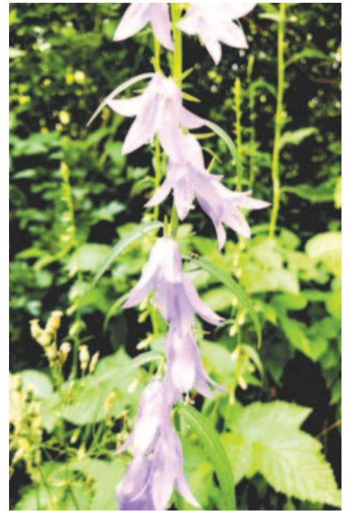
„Sápadt harangvirágban megszólalt búsan réglátott apám”

A temető pompáján eltűnődöm, Mint a jó gazda földjén széttekint,