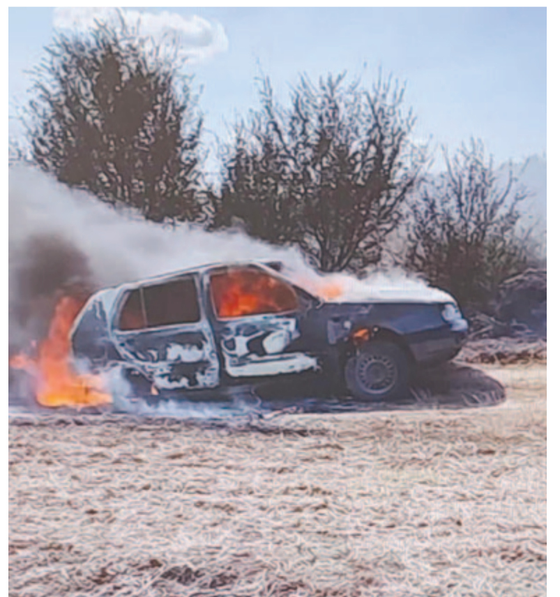
Szerdán egy kisautó gyulladt ki és égett le egy mezei úton

Az utóbbi időszakban a csapat három új önkéntessel is bővült, és a nyomati tüzeset folytán egy helyi lakos is „kedvet” kapott a tűzoltói feladatra, aminek azért is örülnek, mert a községi alakulatban eddig nem volt nyomati tűzoltó. (GRL)