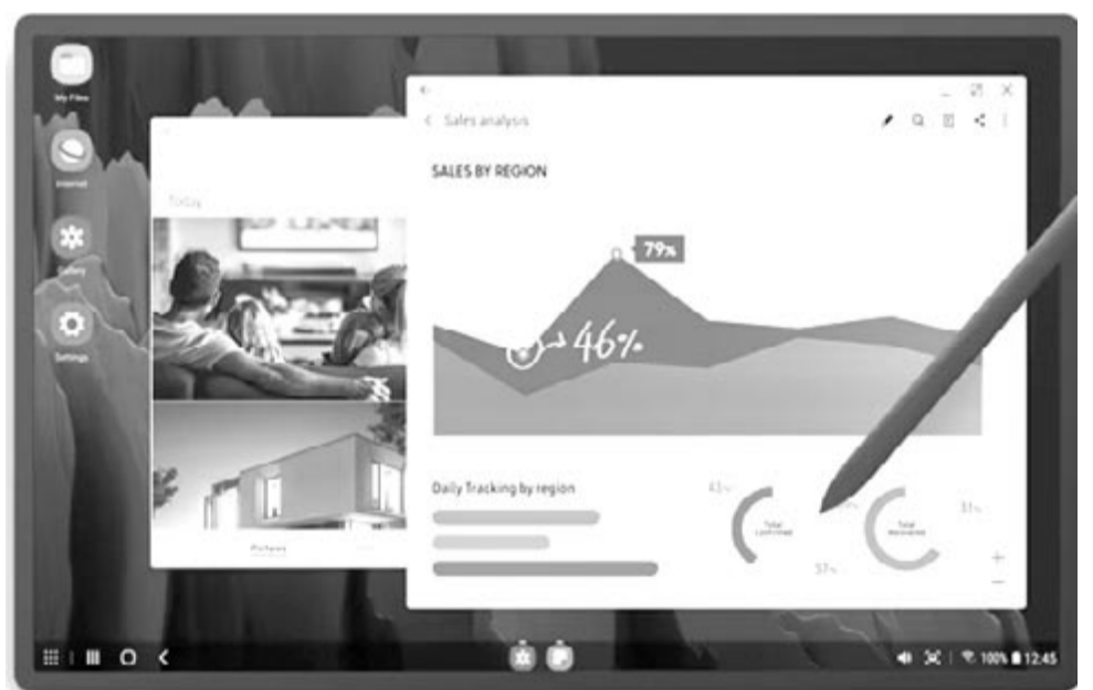
Samsung DeX, illusztráció

Az új funkció az Android Authority portál szerint az androidos asztali mód fejlesztésének a részét képezi. Feltételezések szerint ez egy olyan funkció lehet majd a jövőben,