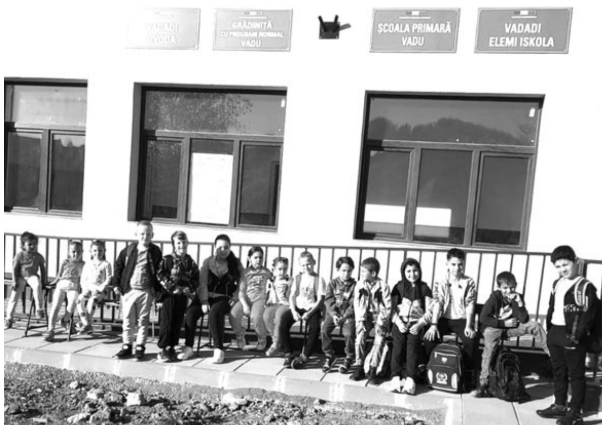
A vadadi tanintézmény is teljesen megújult, idéntől már ismét itt tanulhatnak a diákok

lanban voltak ideiglenesen elhelyezve a diákok, de a héten a felújított iskolaépület átadására-átvételére is sor kerül, így nincs akadálya az engedély megszerzésének.