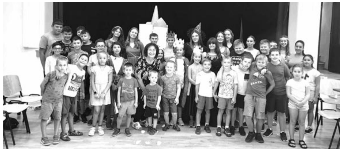
Nagy érdeklődés övezte a színtanodát

Úgy vették észre, hogy a mai gyerekek egymás között, pajtásaikkal beszélgetnek ugyan, közösségekben vagy közönség előtt azonban nem szeretnek megnyilvánulni, szerepelni. Ezt a helyzetet próbálta pótolni ez a rendezvény, ahol a kifejező mesélés és a helyes kiejtés elsajátítása, valamint az előadásmód bátorítása volt a cél, azaz hogy a gyerekek a mesélés révén fejlesszék kifejezőkészségüket, és erő-