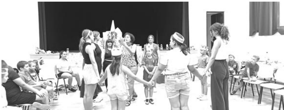
Sokat tanultak, és sokat is játszottak a három nap alatt