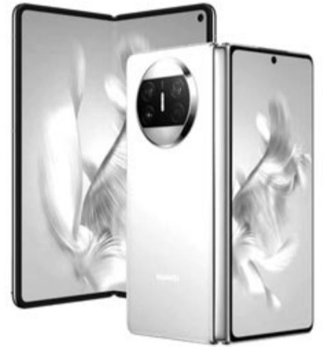
Hajlítható Huawei, a Mate X3, illusztráció ott van az összes Google-alkalmazás, ami azt is jelenti, hogy egy sokkal népszerűbb márká lett Európában.

A téma kapcsán talán az a legfontosabb, hogy a Huawei és a Xiaomi is olyan hajlítható telefonok fejlesztésén dolgozik, ami egyértelműen hatással lesz a piac egészére. Eddig joggal lehetett azt tartani, hogy a Samsung a hajlítható telefonok koronázatlan királya, mert ő áll a legjobban a fejlesztésekkel ezen a téren, ami nem is csoda, hiszen a dél-koreai gyártó dobott először piacra ilyen készüléket. Továbbá mind a mai napig az aktuálisan legújabb Samsung hajlítható telefonokkal hasonlítják össze a többi gyártó készülékeit, viszont most letaszíthatják a trónról a márkát. Ha a Xiaomi és a Huawei hamarabb piacra tudja dobni a két ponton is hajlítható készülékét, akkor a két cég egyértelműen átveszi a vezetést, és olyan lépéselőnybe kerül, amire a többi márkának – különösen a Samsungnak – reagálni kell. Arról nem is beszélve, hogy ha a Huawei piacra dobja a duplán hajlítható telefonját, akkor, ha 1-2 éves csúszással is, de azt meg fogja kapni az alvállalata, a Honor is. Ez azért fontos, mert míg a Huawei nem rendelkezik Google-támogatással – és ebből kifolyólag rengeteg vásárlót veszített –, addig a Honor készülékein