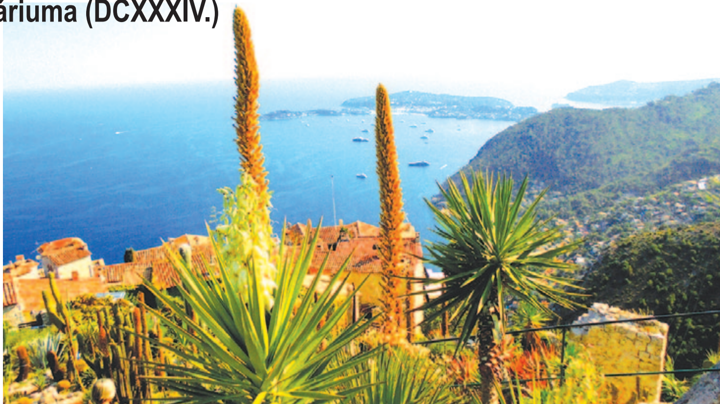
Mutasd szoborszép magad...

Az elmúlt másfél évtizedben a mélytengeri bányászat új szakaszába lépett. A nemesfém-