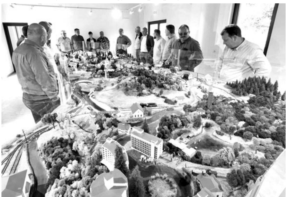
Esettanulmányok, helyi megvalósítások megtekintése is szerepel a programban

A háromnapos rendezvény első napján a vidéki női vállalkozók helyzetéről, a zöld, „slow” és kulturális turizmusról értekeznek, valamint a vidéki vállalkozók pályázati lehetőségeiről, illetve a jövő Európájáról és megújulásáról lesz előadás. Második nap a kulturális és a lassú turizmusról mint életfilozófiáról értekeznek, majd különböző helyszíneken mutatnak be esettanulmányokat a vendégeknek helyi példákon keresztül, délután pedig a nyáradmenti női kézműves termelők kiállítását tekintik meg. Vasárnap kerekasztal-beszélgetés, kiértékelés és eseményzáró szerepel a programban. (gligor)