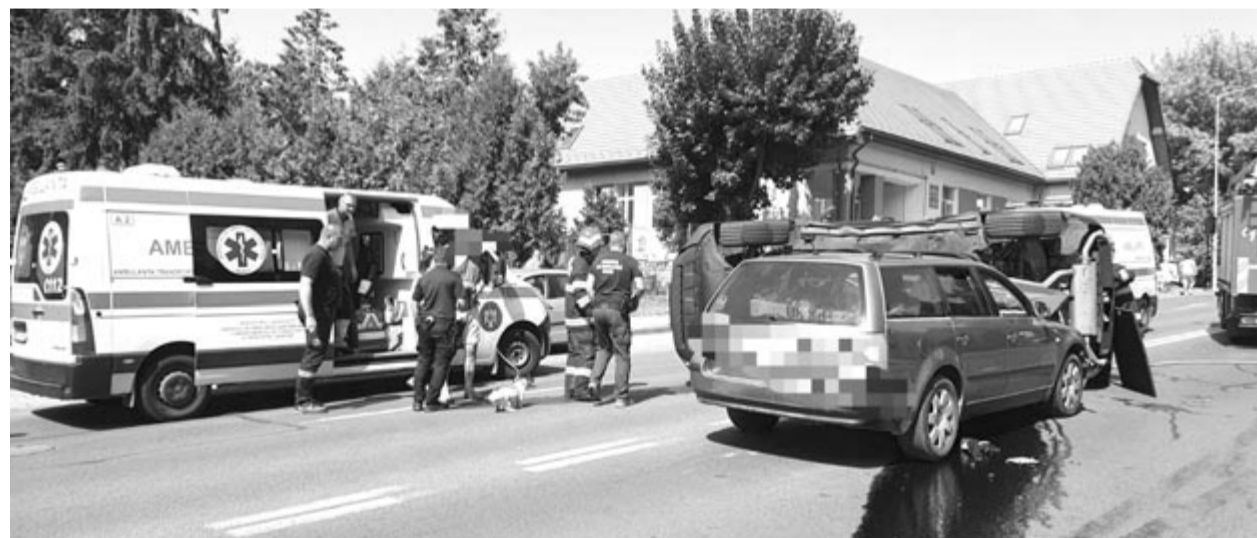
A marosvásárhelyi Gh. Marinescu utcában

Szeptember másodikán, hétfőn délelőtt 10 óra körül a segessvári tűzoltókat közúti baleset miatt Héjjasfalvára irányították. A balesetben három személygépkocsi és egy furgon volt érintett. A közúti balesetben egy kiskorú gyermeket és egy nőt enyhe sérülésekkel szállítottak a segessvári sürgősségi kórházba – tájékoztatott a Maros megyei tűzoltóság sajtóosztálya. (pálosy)