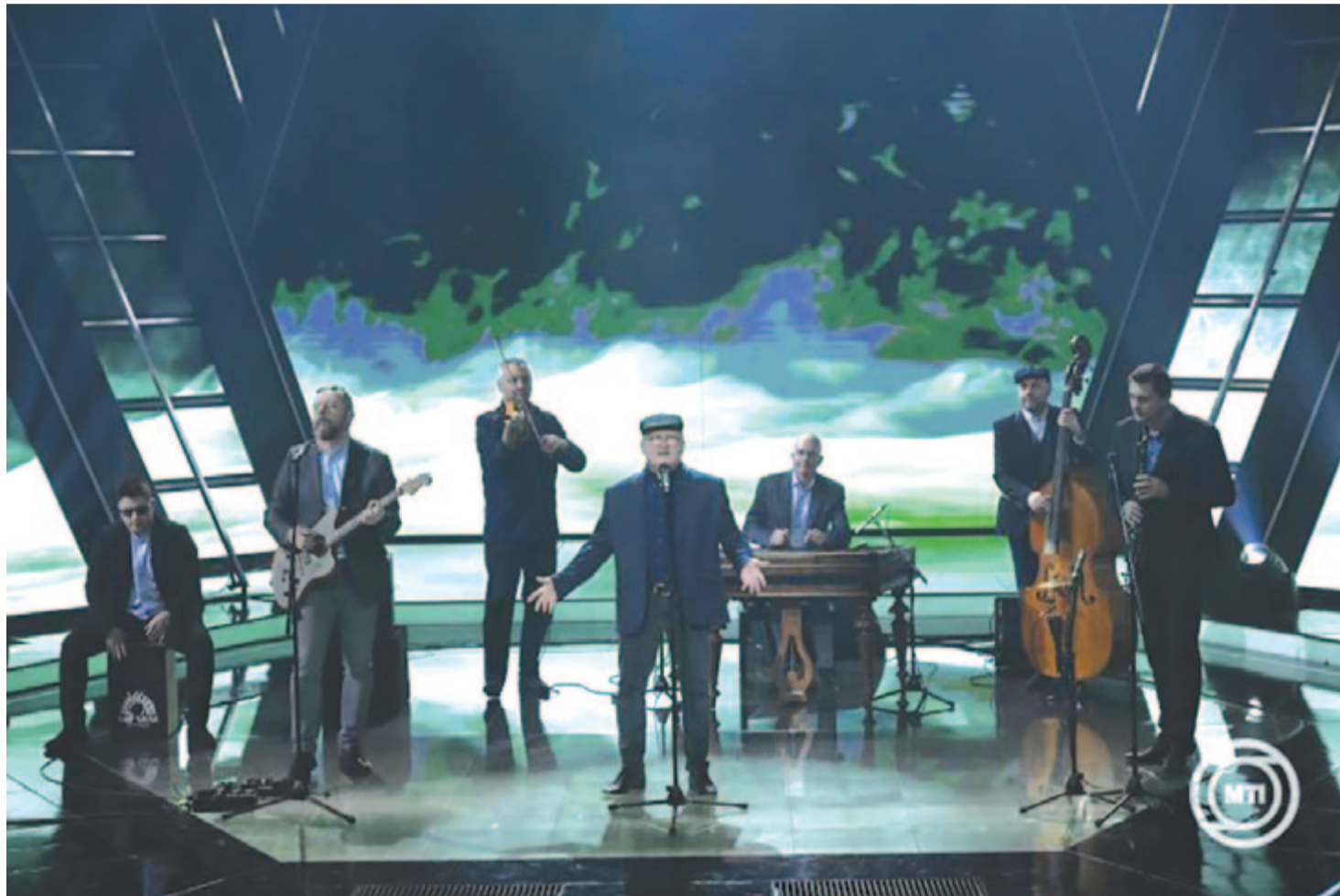
A Csík zenekar a Petőfi Zenei Díj – Életműgála felvételén a Médiaszolgáltatás-támogató és Vagyonkezelő Alap (MTVA) óbudai stúdiójában