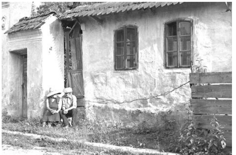
Társalgás (Homoródszentmárton, 1998)