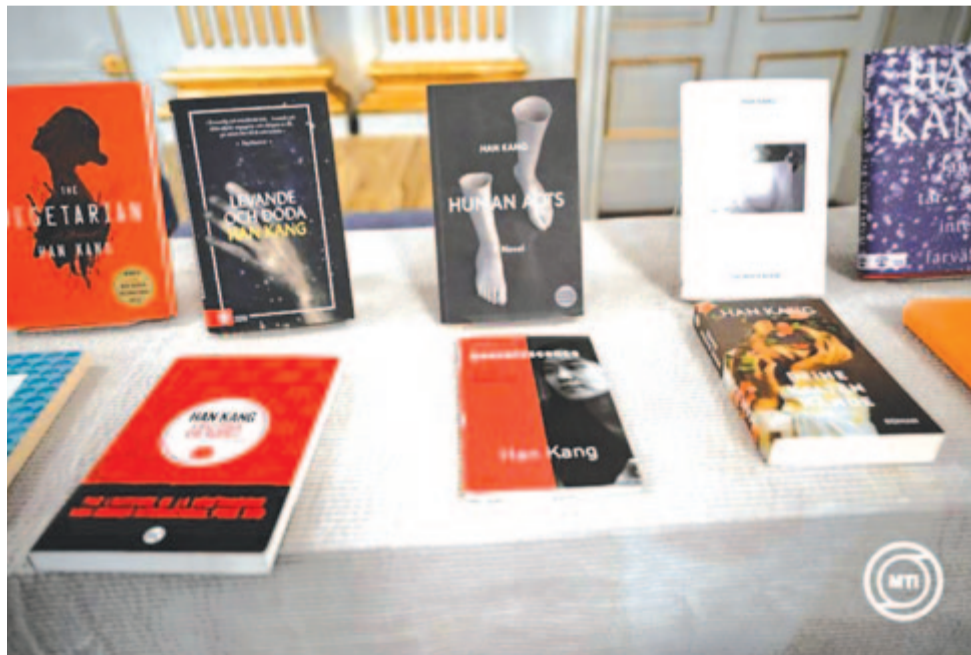
Han Kang dél-koreai szerző különböző nyelvekre lefordított művei a Svéd Akadémián, amelynek irodalmi Nobel-díjakat odaítélő bizottsága 2024. október 10-én bejelentette, hogy az író kapja az idei díjat. Az indoklás szerint a szerző „intenzív költői prózájért” részesül az elismerésben, amely „szembesít a történelmi traumákkal; és rávilágít az emberi élet törékenységére”. Az 1970-ben született Han az első dél-koreai író, aki elnyerte az irodalmi Nobel-díjat.

(388 millió forintnyi összeget) kap a díjjal, amelyet hagyományosan december 10-én, az elismerést alapító Alfred Nobel halálának évfordulóján adnak át.