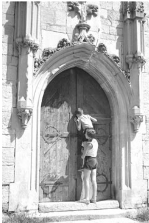
Kiváncsiak (Kolozsvár, 1965)