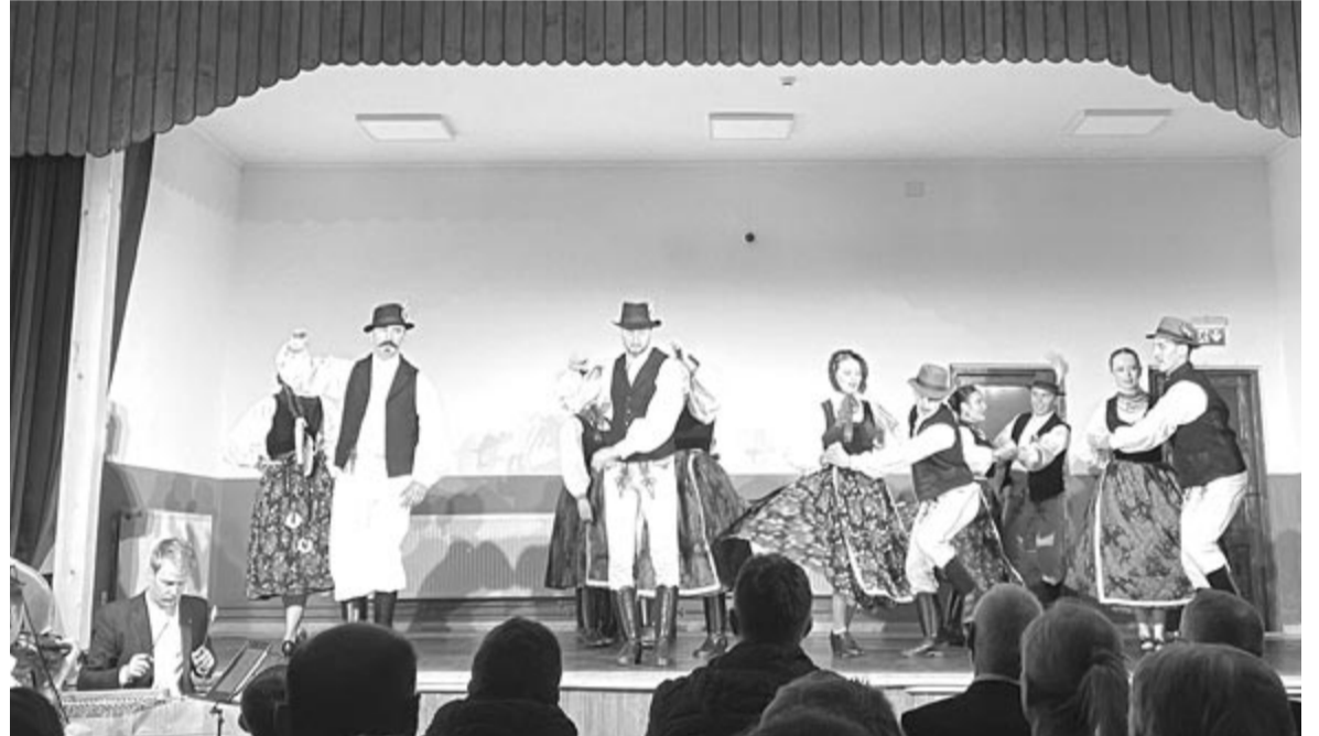
Ünnepi folklórműsorral is kedveskedtek az időseknek Havadtón