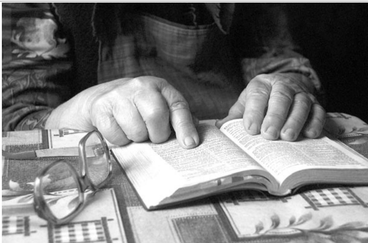
Biblia, Mezőmadaras, 2014

111 évvel ezelőtt, 1913. október 8-án született Budapesten Morócz György József néven a József Attila-díjas (1967) költő, író, műfordító, esszéíró, irodalomkritikus, irodalomtörténész, országgyűlési képviselő. Elhunyt 1978. április 8-án.