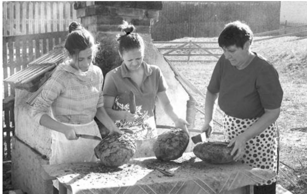
A család kenyere (Gyimesközéplek, 2013)

rök, fotóklubok Erdély városaiban: Csíkszeredában, Sepsiszentgyörgyön, Székelyudvarhelyen, Nagyváradon stb. A Marosvásárhelyi Fotóklub egyre ismertebbé válik az országban. Minden második esztendőben nagy sikerű, népszerű országos kiállítást szervezett. Neki köszönhető, hogy városunk fotográfusai ismertté váltak a nagyvilágban. Volt időszak, amikor havonta 3–4 kollekciót küldtünk külföldre; katalógusok százaiban jelentek meg képek, alkotóinkat díjazták.