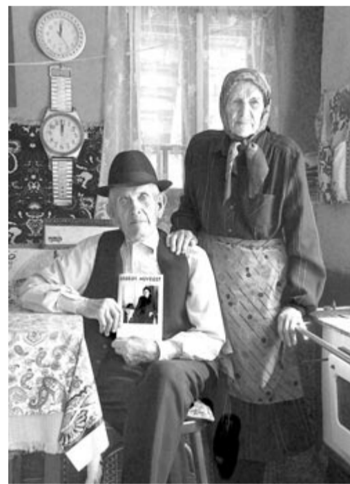
A falu öregei (Erdőcsinád, 2016)

– Amikor meghívunk egy eseményre, vagy magam választom ki, hogy hová megyek, minden alkalommal fel kell készülnöm. Meg kell ismerni az esemény forgatókönyvét, elő