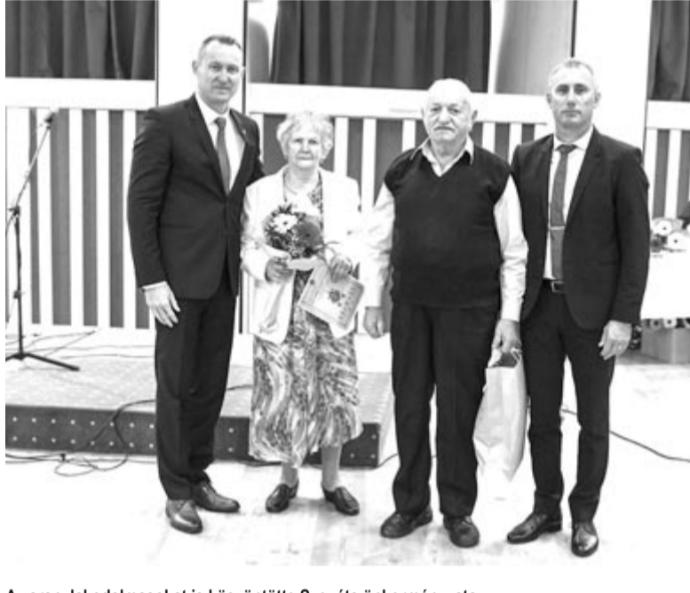
Az aranylakodalmásokat is köszöntötte Szováta önkormányzata

volt öröm együtt látni az időseket és az őket szórakoztató fiatalokat. A mai fiatalok nem tudnak annyiszor újratekinteni az életüket, mint ahogy az idősek tették, ezért egész élettapasztalatuk megosztására kérte fel az időseket. Az önkormányzat rendezvényére 24 kerek házassági évfordulós pár kapott meghívást. Olyanok is elfogadták, akik hosszabb ideje nem mozdultak ki otthonról, de most úgy érezték, hogy a közös vacsora, éneklés, beszélgetés, a közösségi élmény miatt érdemes részt venni a rendezvényen. (GRL)