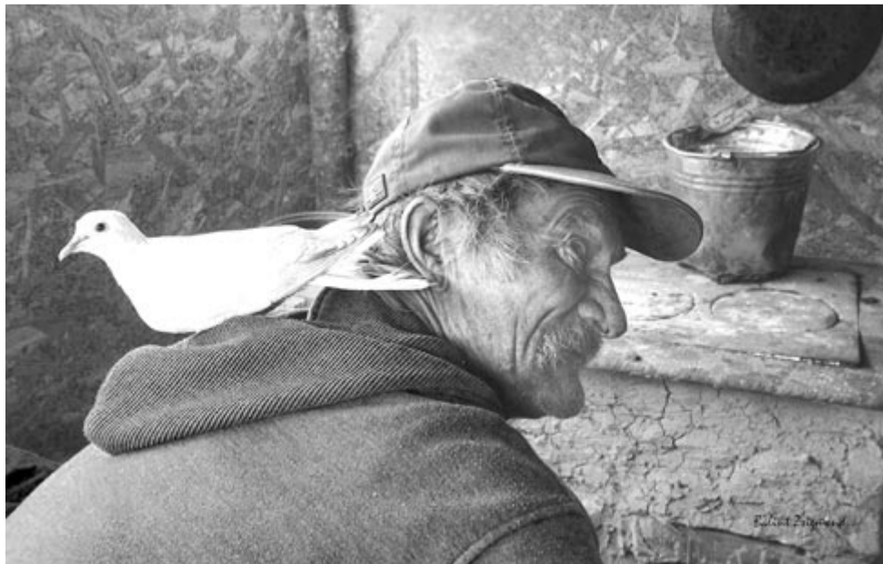
A szénégető és a fehér galamb (Vargyas, 2023)