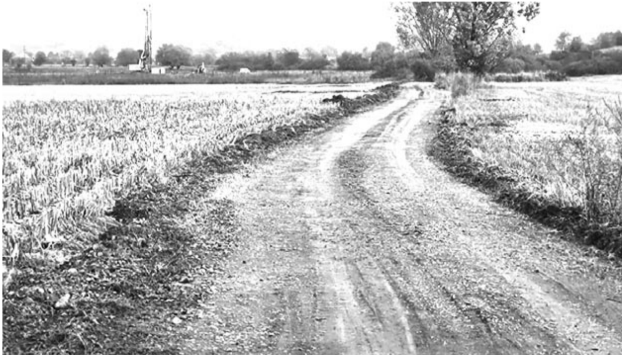
A nyárádmenti szakaszon megjelentek a munkagépek, de még csak a terepet készítik elő. Messze van még innen Gyergyóalfalu