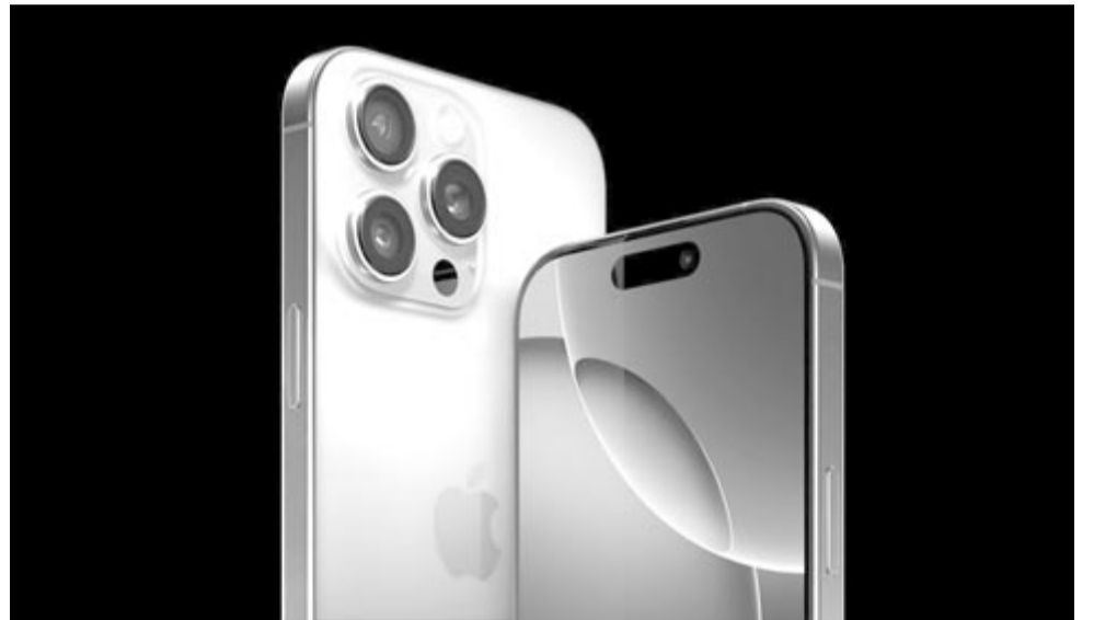
iPhone 16 Pro Max

Érdekes azonban a külön szempontok terén is megnézni, hogy hol áll a jelenlegi csúc-iPhone kamerája a mezőny többi tagjához képest. A Huawei Pura 70 Ultra fotózási képességekre 169, videózárra 148 és zoomra 164 pontot kapott (ezek átlaga a 163 pont). Ezzel szemben az iPhone 16 Pro Max 157 pontot kapott a fotózás, 159 pontot a videózás és 142 pontot a zoomolás tekintetében. Ebből az következik, hogy csupán a videófelvételek esetében lett jobb az eszköz, mint a Pura 70 Ultra, fotózás és zoomolás tekintetében nagyon elmarad tőle. A tavalyi