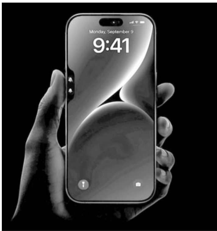
Érintésérzékeny gomb, illusztráció

Jogosan merül fel a kérdés, hogy de hogyan válthatna ki egyetlen gomb hármát. Erre a válasz az érintésérzékenység, azaz az előugró funkció attól függne, hogy a felhasználó hogyan érinti meg a gombot. Vagyis a gomb működése hasonlítana az idén debütált kameragombhoz.