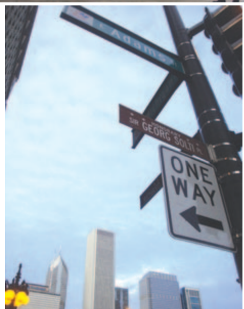
Solti György utca

Chicagóban mintegy félmillió amerikai olasz él, a harmadik legnagyobb olasz közösség az Egyesült Államokban. Az olasz ízlés, konyhaművészet lépten-nyomon visszaköszönt. Külön ukrán városrészrel rendelkezik, ahol pravoszláv templom, bizánci keresztiek, ukrán kulturális központ, nemzetiségi bankok, üzletek és elsősorban a kék-sárga színek dominanciája kelti fel az érdeklődést. Jelentős létszámú a román lakosság, akik több hullámban vándoroltak ide a jobb megélhetés reményében. A 19. század eleji kivándorlási