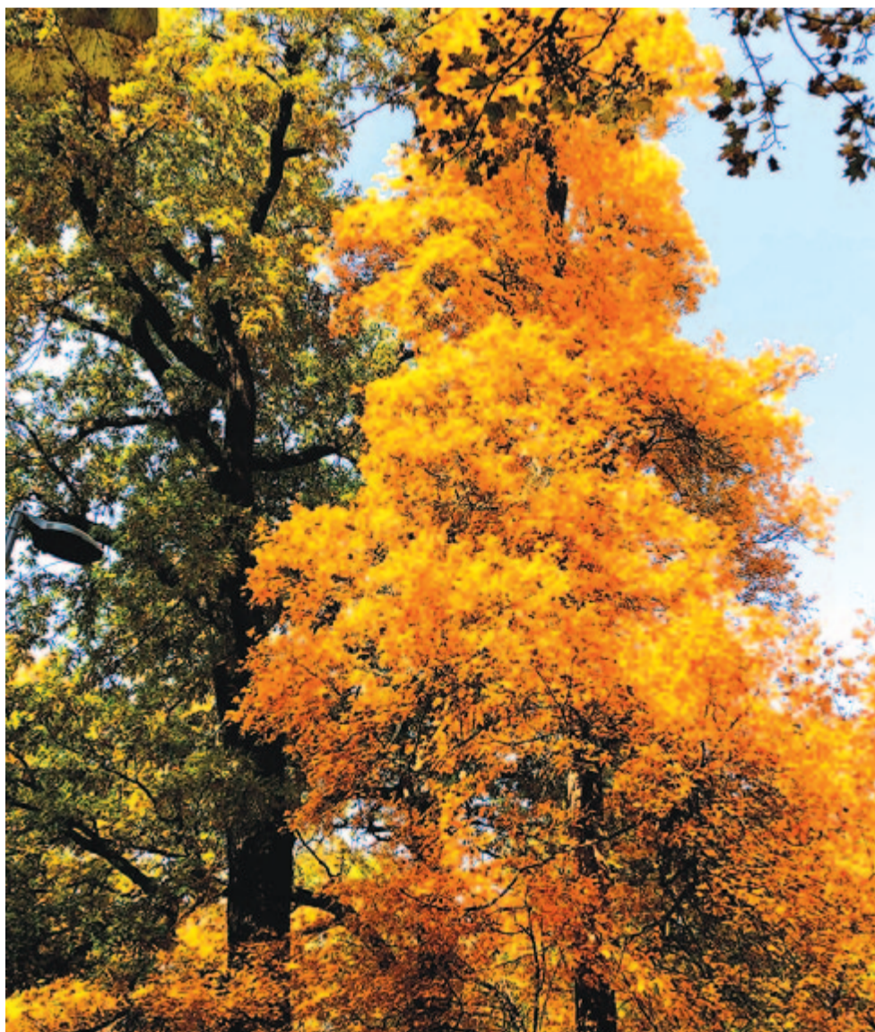
„Lombját a gally, nézd, mily kímélve ejti”