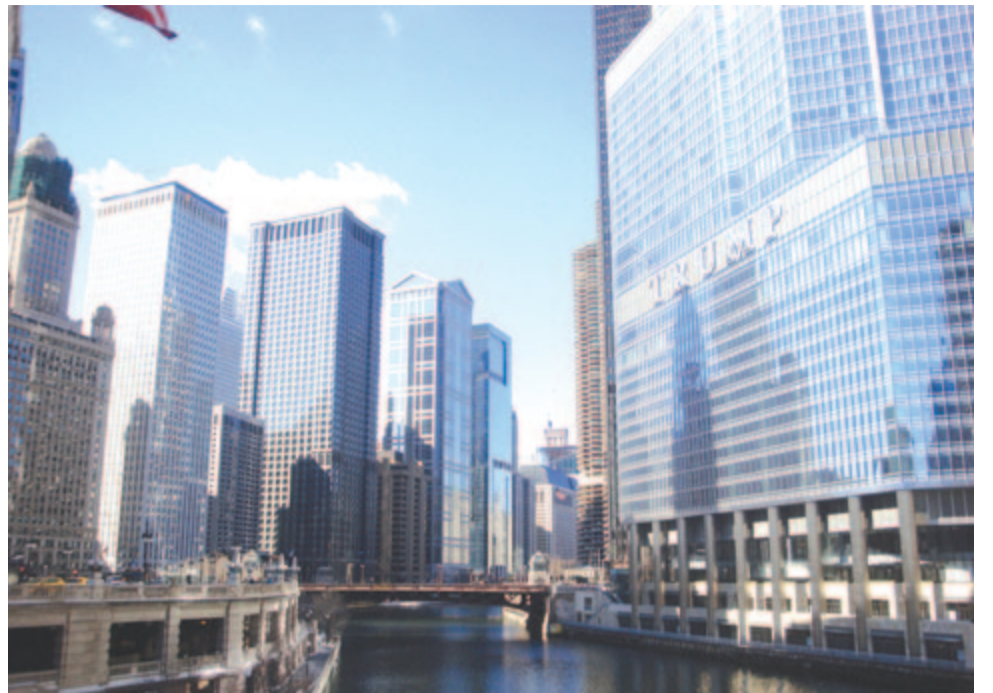
Trump-irodaház a Chicago folyó partján

Ejtsünk néhány szót a sportról is! A Chicago Bulls kosárlabda-együttes máig megismételhetetlen módon 1991-1998 között két év megszakítással összesen hatszor volt a híres NBL bajnoksapata. A Vörös Bikák legendás játékosa, Michael Jordan legszenzációsabb meccsén egymagában 69 pontot