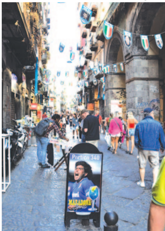
A Spaccanapoli utca

A katakombák egyik kijárata egy ilyen elhagyott, egykori középkori templom keresztül vezetett, amely évtizedekig a hozzá csatolt kórház (San Gennaro) raktárhelyisége volt. Idegenvezetőnk elmondta, az a legújabb tervük, hogy ez is kulturális térére váljon. Szűk udvaron keresztül – a hullaház mellett elhaladva – találjuk meg a kijáratot, amely egy keskeny térére vezet. Kismotorokra támaszkodó, szűrős tekintetű férfiak előtt lépkedünk, keresve a főutca felé vezető utat. Életemben először félttem megnyomni a fényképezőgép kioldóját. Lehet, hogy csak képzeletem, vagy valóban a hírhedt bünszervezet tagjai előtt haladtunk el, akiknek gyanús minden arra járó idegen? Ez is a nápolyi filinghez tartozik. Aki nem hiszi, járjon utána.