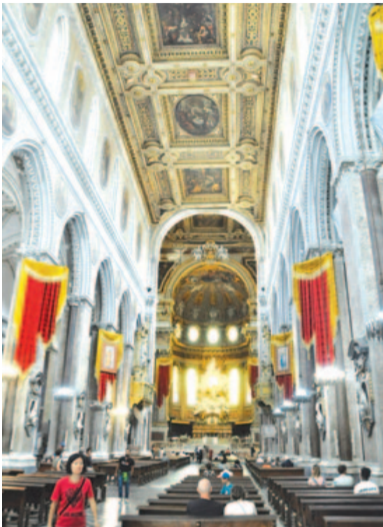
A nápolyi dóm főhajója

Temérdek turisztikai látványosság van, képtár, múzeum, kastély, ahova érdemes elmenni. Mindenképpen ajánlatos felmenni a Vezúvra (erről írtunk korábbi cikkünkben), ahonnan a nagyvárosi övezetre, az öbölre tekinthetünk le. Aztán közelebről ott van a Szent Elmo- (Szent Erasmus) erőd, amelynek építése 1329-ben, Anjou Róbert idejében kezdődött, és 1343-ban fejeződött be, valamikor börtönként is működött, de amiért érdemes felkapaszkodni (felvonó is van), az a csodálatos látvány. A vallási turizmust kedvelők itt bőven találnak látnivalót, ugyanis Nápolynak egyes források szerint 448 történelmi temploma van, mi csupán 12-be néztünk be. Ezek közül a leglátogatottabb a nápolyi dóm, amely méretében is lenyűgöző, hiszen a nápolyi főegyházmegye fő székesegyháza. Külön kápolnában őrzik Szent Januáriusz (San Gennaro), a város védőszentjének vérekléjét. San Gennaro Benevento püspöke volt, aki a diocletianusi keresztényüldözések idején, 305. szeptember 19-én halt vértanúhalált. A legenda szerint a halálos íté-