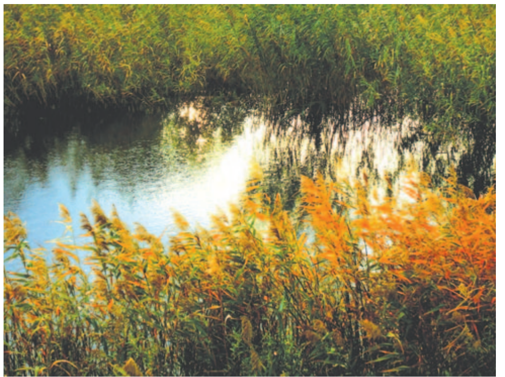
A partot nádas testőrsége óvja

második verse találtat vissza a Kárpát-medence valamely horgászvíze mellé: