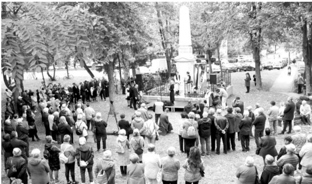
Október 6-án 16 órakor Marosvásárhelyen, a Székely vértanúk emlékművénél ünnepélyesen, méltó módon emlékeztek meg az aradi tizenhárom vértanúról, az 1848/49-es szabadságharc hőseiről