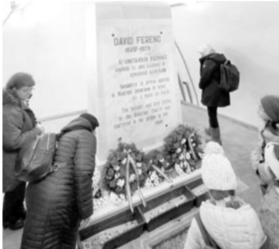
Dávid Ferenc síremléke abban a cellában, amelyben élete utolsó hónapjaiban raboskodott

A hegy lábánál ft. Kovács István, a Magyar Unitárius Egyház püspöke mondott imát és kért áldást a zárándokok elindulására és megérkezésére. Ezt követően a zárándokcsoportok felvonultak a templom magasztosuló várba, ahol az 1579 novemberében vértanúhalált halt egyházalapító, Dávid Ferenc unitárius püspökre emlékeztek. Az unitárius vallás megalapítója és első püspöke hitnézetei miatt került börtönbe, habár az erdélyi vallásszabadság és az azt kinyilvánító tordai országgyűlés (1568) egyik meghatározó személyisége volt.