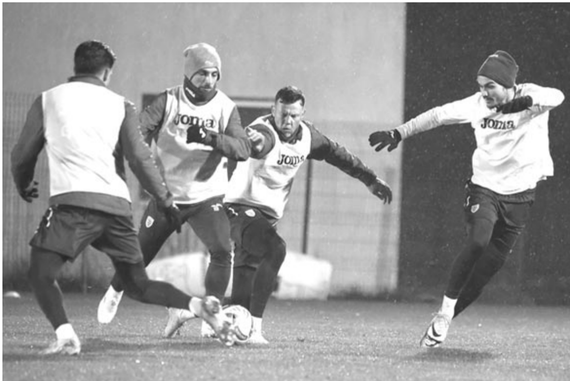
Románia a Koszovó elleni mérkőzésre készül

* 2. csoport (szombat, 19.00 óra): Andorra – Moldova. Az állás: 1. Moldova 6 pont/3 mérkőzés (4-1), 2. Málta 6/3 (2-2), 3. Andorra 0/2.