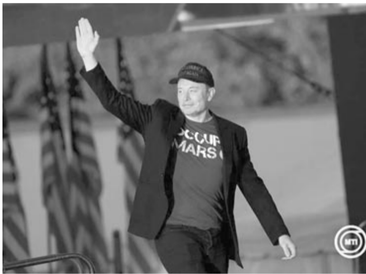
Elon Musk dél-afrikai-amerikai üzletember, a Tesla Motors elektromosjármű-gyártó, a SpaceX amerikai űrkutatási magánvállalat és az X közösségi médiaplatform tulajdonosa

Kedden keleti parti idő szerint a késő esti órákban Donald Trump közölte leendő belbiztonsági miniszterének nevét, aki Kristi Noem, Dél-Dakota állam kormányzója lesz. (MTI)