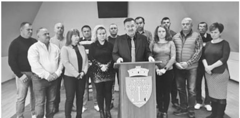
A megújult önkormányzat beszámolt a következő négy év feladatairól

A munkálatot már a jövő év első felében elkezdhetik – véli a polgármester, aki hozzátette: a régi épületet lebontják, s annak helyén zöldövezetet alakítanak ki játszótérrel, sétányokkal és parkolóhelyekkel. (gligor)