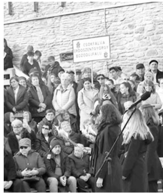
A Maros megyei unitáriusok is ott voltak a várba vonulók között

Dávid Ferenc számára egyértelmű volt, hogy ebben a világban örök otthonát a jézusi tanítás épít az ember számára, ezért vissza kell térni az igazi evangéliumhoz. Meg kell találni, ami lélekbe illő, ami az évszázadok során elveszett – hívta fel a figyelmet szószéki szolgálatában Tófalvi Tamás székelyszentmihályi unitárius lelkész. A mi édenünk Erdély és az unitáriusok lakta vidékek, és feladatunk őrizni és művelni azokat, vigyázni rájuk, mint egy féltve őrzött kincsre – mutatott rá az igemagyarázat folytatásában Dénes Erzsébet siménfalvi lelképásztor. Ez a hely templom és temető is egyben – hivatkozott a dévai várra. „Ez a hely hitünk alfája és ómegája, temető, mert itt lehelte ki lelkét vallásalapító püspökünk, és templom, mert évről évre zárándokok imái töltik meg a helyet, s az imák, zsolttárok által megszentelődött ez a hely a lelkünk tisztasága, jósága, az imára kulcsolt kezek által. Mi ide illünk a hitünkkel, az eredendő jóságunkkal, a lel-