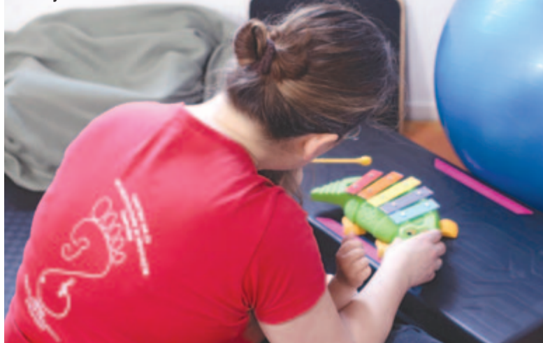
Fotó: Gyulafehérvári Caritas

képzettsége. Éppen ezért a kisfiú édesapja három éven át a marosvásárhelyi speciális iskolának az óvodájába hordozta gyermekét. Mindennap közel egy órát autóztak, hogy beérjenek a nyolckor kezdődő óvodai programra, amely tizenkét óráig tartott. Ez idő alatt az édesapa autóban, üzletben vagy sétálva töltötte el az időt, mert sem anyagilag, sem időben nem érte volna meg neki, hogy haza-, majd visszautazzon gyermekéért. Az édesapa pékségben dolgozik, gyakran éjszakai váltásban. Úgy ül be reggel az autóba, hogy alig aludt pár órát előző éjjel, de azért kitartóan viszi gyermekét az óvodába és hetente egyszer fejlesztő terápiára a Szent Ágnes Rehabilitációs Központba. Az elmúlt három év az egész családnak nagy áldozatot jelentett, amelyet mégis nagy odaadással hoztak meg, és nem eredménytelenül. Mára a kisfiú megtanulta kifejezni a kívánságait, és kivárni, amíg sorra kerül. Megtanulta felismerni és megnevezni a saját érzelmeit, valamint beazonosítani a szülők, a testvére és a közvetlen környezetében lévők érzelmeit. Kommunikációja nagyon sokat fejlődött az elmúlt két évben. A nem beszélő, agresszív magatartást tanúsító gyerek mára többszavas mondatokat használó kisfiú lett. (Gyulafehérvári Caritas)