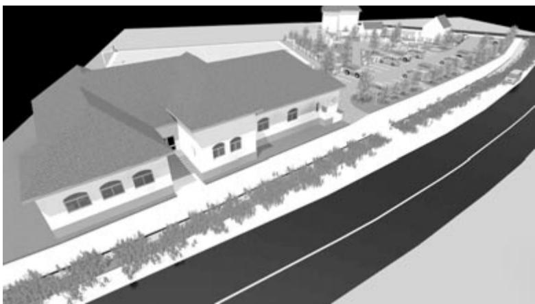
Az ifjúsági házat kibővítik, a régi iskola helyére zöldövezetet terveznek