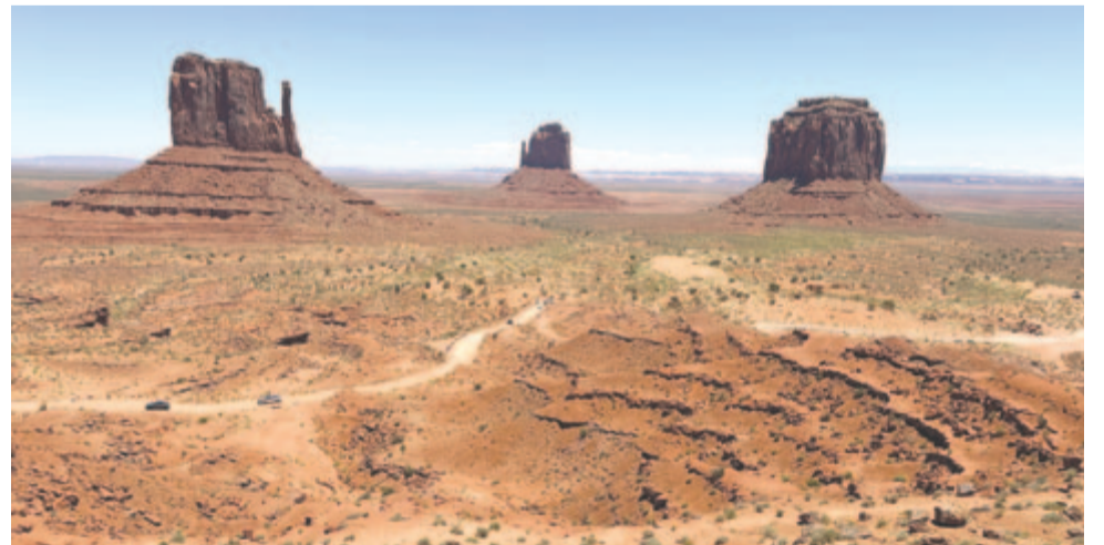
A West, az East és a Merrick Butte

Az őslakók által sziklák völgyének nevezett Monument Valley-ben az említetteknél még több hangzatos nevű és látványos szikla van, az egyik legismertebb rész azonban a John Ford Point. A völgynek ennek a szegletéből remek képeket lehet készíteni a közeli és távoli sziklákról. Nem véletlenül használta John Ford rendező több western témájú filmjének forgatási helyszínékként ezt a területet. S ha az egyébként négy Oscar-díjat beseprő kiváló rendező neve már a múlt kódéba vész, legtöbbünk előtt talán jóval ismertebb minden idők egyik legszimpatikusabb vadnyugati filmsztárja, John Wayne. Az amerikai filmszínész több, John Ford által rendezett filmben szerepelt, ezeknek egy részét a Monument Valley-ben forgatták. A John Ford ponton készült az az ikonikus felvétel, amelyen egy lovas indián kémleli a láthatárt. A kilátás innen valóban festői, a völgyben készült filmek világszerte nagy sikert arattak, és évtizedekre határozták meg azt a képet, amelyet a világ elképzel a vadnyugatról. Még John Wayne is azt mondta, hogy „a Monument Valley az a hely, ahova Isten helyezte a nyugatot”. A popkultúrának egy óra leforgása alatt immár a második kiemelkedően híres helyszínen állhattunk, és élvezhettük a mindent elölről panorámát.