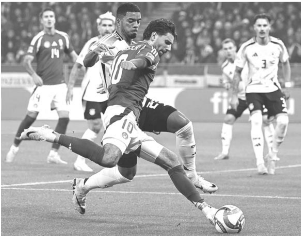
Szoboszlai Dominik (elől) és a német Benjamin Henrichs a Nemzetek Ligája A divíziójának 3. csoportjában játszott Magyarország – Németország mérkőzésen a budapesti Puskás Arénában 2024. november 19-én.