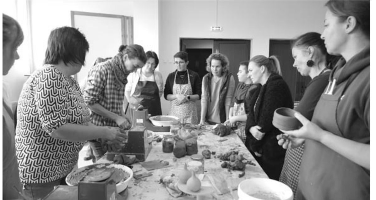
Visszatartják a korongozás népi mesterségét a szovátaiaknak

Az 50 ezer lej értékű projekt 300 diák és 30 fős személyzet bevonásával valósul meg. Ennek keretében már felépült egy kis üvegház, amelyben a termesztés folyik majd, mellette pedig napelemeket szerel-