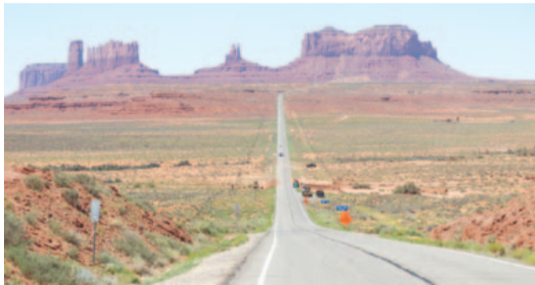
Kilátás a Forrest Gump-pontról

A Mexican Hat szikla után beléptünk a navahó nemzet birodalmába. Gyermekkorom indiános olvasmányai óta vágytam arra, hogy eljussak az indiánok földjére, és most a legnagyobb határát léptük át, a 65.000 négyzetkilométeres navahó rezervátumot. Ez a terület a történelmi Erdélynél is nagyobb, szóval még amerikai viszonylatban sem kicsi térség. Persze, lehet azt mondani, hogy valamikor az egész Amerika az őslakóké volt, de jussanak eszünkbe a saját önrendelkezésünkről szőtt álmaink, amelyeket még nem sikerült kiharcolnunk. A rezervátum az ún. Four Corners régióban található, amelyet azért neveznek négy saroknak, mert Utah, Colorado, Új Mexikó és Arizona határvidékén terül el. A navahók 400.000-es közössége a legnépesebb, nyelvüket az egész régióban beszélik, de a legtöbben angolul is tudnak. Az Északnyugat-Kanadából idevándorló nép eredetileg vadászó, gyűjtögető, félnomád életmódot folytatott, itt kerültek kapcsolatba a letelepedett, földműveléssel foglalkozó pueblo indiánokkal, majd később a spanyolokkal. Az a tény, hogy Észak-Amerika északi részén egészen más éghajlati és földrajzi viszonyok vannak, mint az USA déli részén, azt támasztja alá, hogy az ember bármilyen körül-