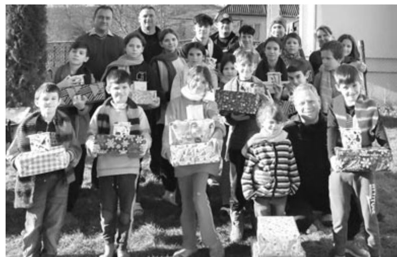
Karácsony előtt mindig ajándékokkal lepik meg a gyermekeket

ben, ahol az utóbbi években igencsak megfogyatkozott a magyarság. A környékbéli falvakból toborzott és néhány moldvai csángó gyerekkel kiegészített diákközösségben – a helybeliek által létrehozott Bástyá Egyesület által működtetett oktatási rendszerben – mindig elkel a segítség. Ezt tapasztalta munkatársunk is első látogatása alkalmából 2021 szeptemberében, amikor magánszemélyként tisztítószereket, tisztálkodási szereket, tanfelszerelést és édességet vásárolt és vitt a gyerekeknek. Látta, hogy a kollégium ud-