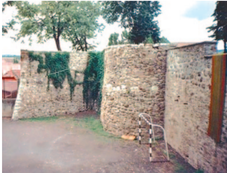
A Székelytámadt vár

* A rendelkezésünkre bocsátott dokumentációkért külön köszönet Keresztes Géza műépítész, műemlékvédő szakmérnöknek; az illusztrációkat, a régi és a mai képeket Demján László műemlékvédő építész a saját munkájából és gyűjteményéből juttatta el a szerzőnek.