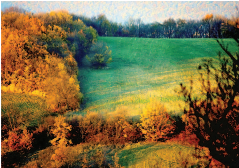
Az őszi alkonyatban megtaláltam...

Kelt 2024-ben, 147 évvel Ady Endre születése után