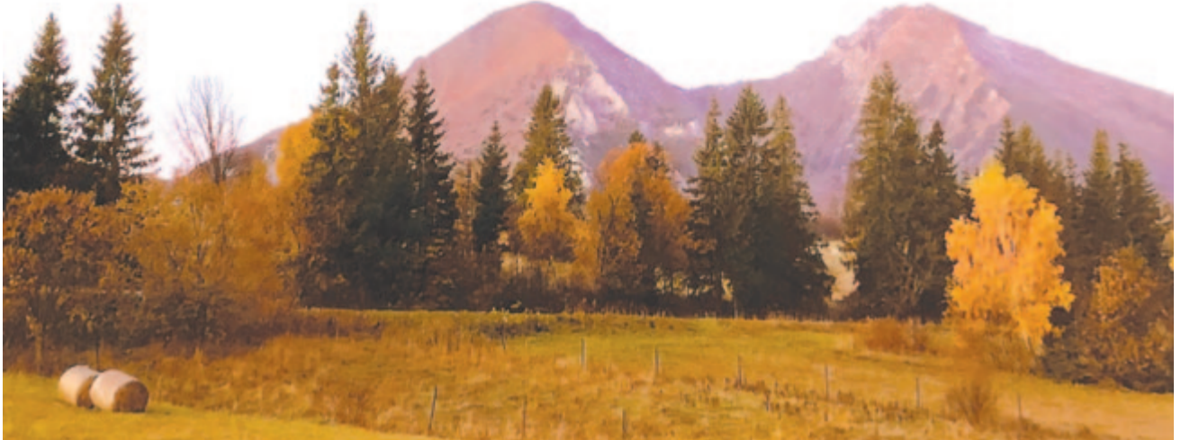
Mint szomorú, halk színhatású pasztell

Majdnem fél ezer évet visszaugorva az időben, álljunk meg Vicenzában! Itt született 1553-ban, s itt adta vissza lelkét 1616-ban, ugyanaznap, november 23-án, Alpini Prospero botanikus. Ő hozta be a kávé és a banánt Európába. Mialatt Velence konzuljának orvosa volt Kairóban (1580-83), részletesen tanulmányozta az egyiptomi növényvilágot. Neki sikerült először datolyapálmákat mesterségesen