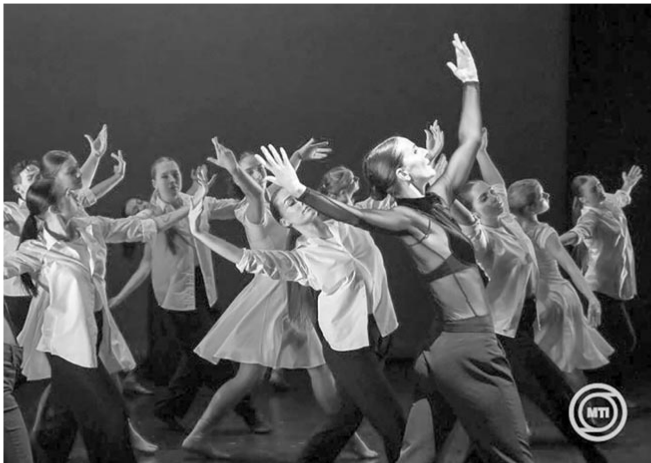
A Somogy Táncgyűttes előadása az 1100 éve Európában, 20 éve az unióban elnevezésű rendezvénysorozat kaposvári táncművészeti gáláján 2024. szeptember 6-án

Július elsején Magyarország átvette az Európai Unió Tanácsának soros elnökségét, ennek jegyében indult útjára az 1100 éve Európában, 20 éve az unióban című kulturális programsorozat a Kulturális és Innovációs Minisztérium és a Nemzeti Kulturális Alap támogatásával.