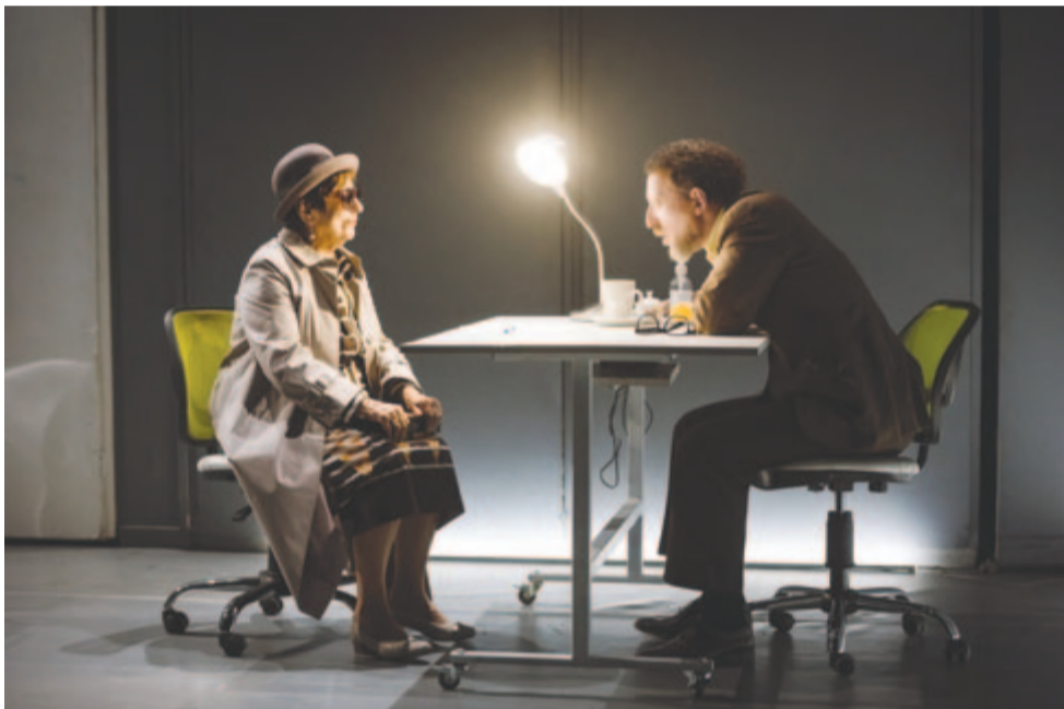
Csónak, avagy előttünk az özönvíz