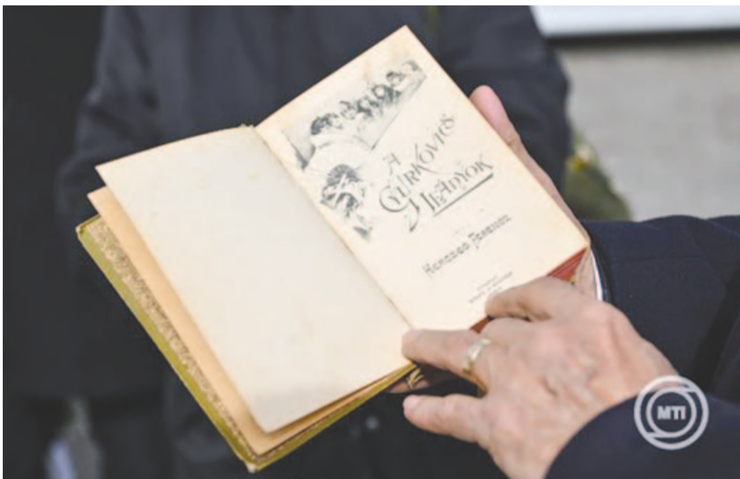
Herczeg Ferenc egyik leghíresebb műve, a Gyurkovics leányok első kiadása az író halálának 70. évfordulójára alkalmából tartott megemlékezésen a Farkasréti temetőben 2024. február 24-én

A Magyar Nemzeti Múzeum Közgyűjteményi Központ Országos Széchényi Könyvtár (NMKK OSZK) által működtetett szolgáltatás ezzel is hozzájárul a nemzeti örökség ápolásához és megőrzéséhez, valamint elérhetőségük biztosításához a jelen és a jövő olvasói számára – írták. A MEK 2024-ben közel húszmillió látogatottságot ért el. Az MNMKK OSZK további digitális tartalomszolgáltatásai összesen mintegy tízmillió látogatót vonzottak. A nemzeti könyvtár digitalizáló központjának teljesítménye továbbra is stabilan az európai élvonalban van több mint 14 millió levilágított oldallal – hangsúlyozták az MTI-hez eljuttatott közleményben.