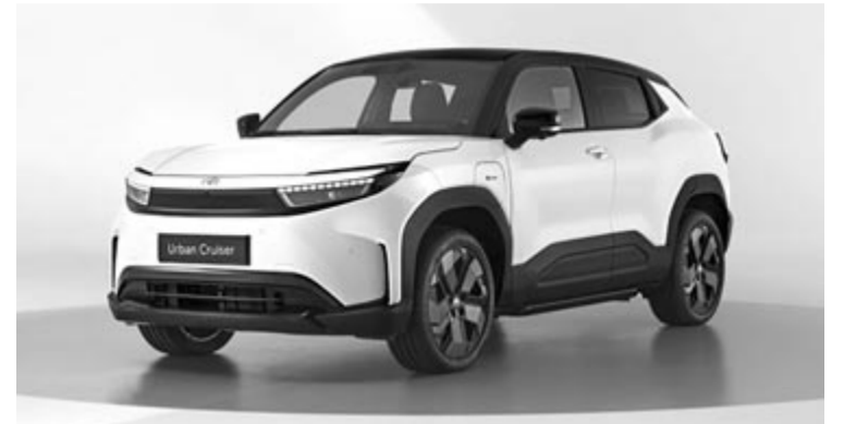
Toyota Urban Cruiser