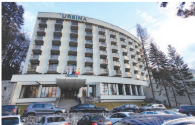
A fürdőtelepen szűkében vannak a parkolóhelyek