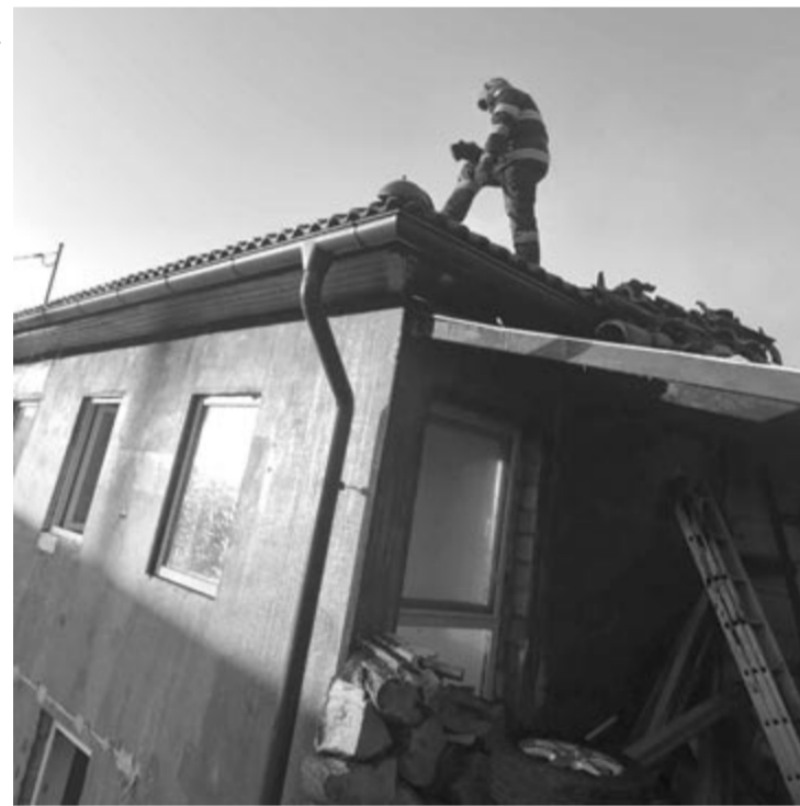
A lakás teljes tetőszerkezete megsemmisült a reggel keletkezett tűzben.