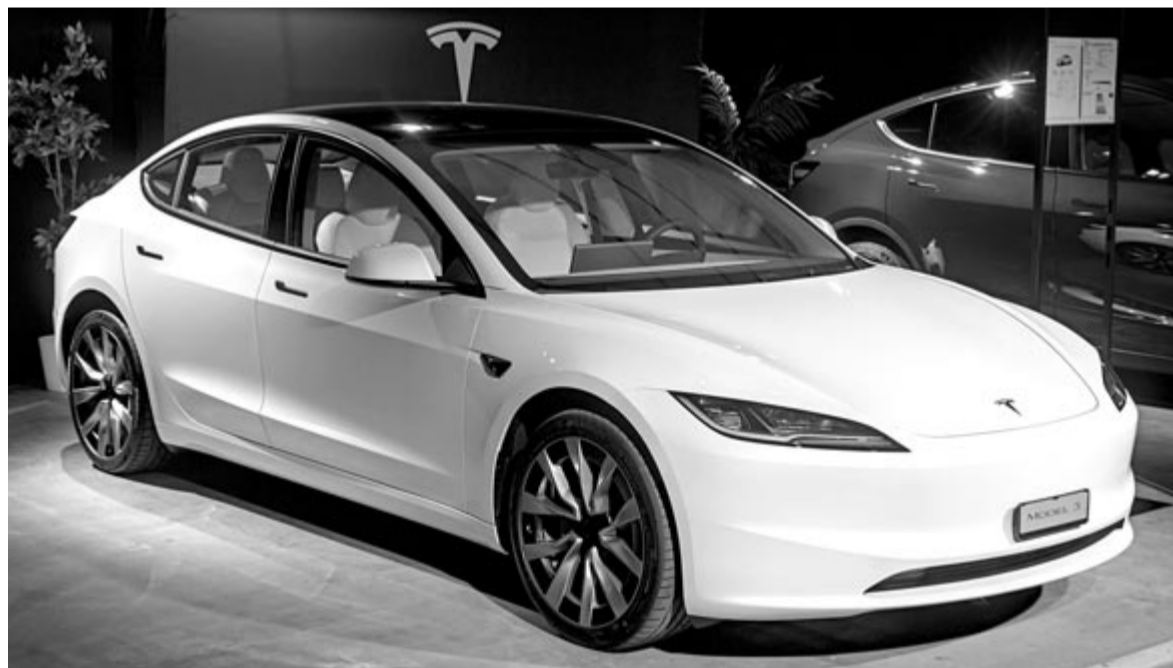
Tesla Model 3 Highland, illusztráció

A GreenNCAP szakemberei azt is lemérték, hogy mennyi időre van szükség -7 fokban, hogy az autóban a fejtámlánál mért hőmérséklet elérje a 18 fokot. A melegítés a belső égésű autók esetében a motor veszteségéből történik, tehát először a motor valamennyire fel kell melegedjen, csak utána tud meleget küldeni az utastérbe, ez pedig egy dízelmotor esetében hosszú idő lehet. Az elektromos autók, különösen a drágábbak, rendelkeznek hőszivattyúval, ami szinte azonnal képes meleget fűjni, így van ez a Teslánál is. A mérések arról adtak bizonyosságot, hogy -7 fokban mindössze három perc kell ahhoz, hogy a fejtámlánál 18 fok legyen, ami igencsak rövid idő.