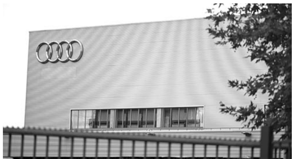
Az Audi brüsszeli üzeme