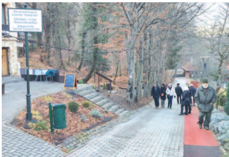
Sokan választották Szovátát, a legtöbben a sós tavak környékén sétáltak

A versenyben bizonyosan nem vall szégyent Szováta szomszédja,