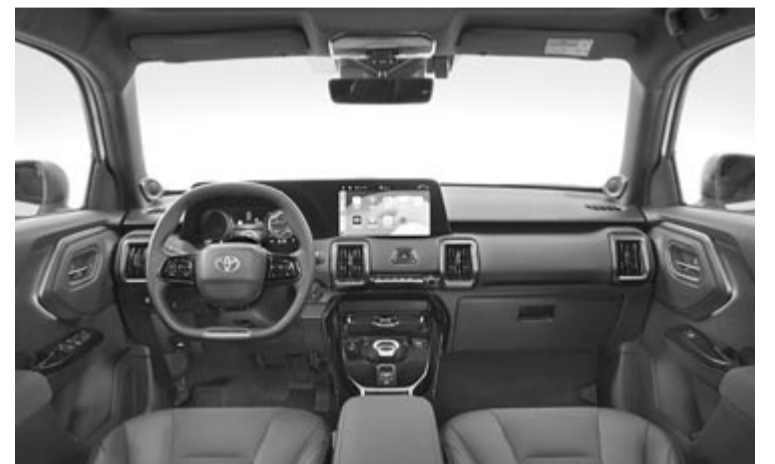
A Toyota Urban Cruiser beltere

A Suzuki autója a nyáron érkezik, ebből gyanítható, hogy valamikor akkor fog a kereskedésekbe kerülni az új elektromos Toyota is. Egyik típus esetében sem beszéltek árakról, nagy valószínűséggel ugyanazon a szinten lesznek, ez pedig várhatóan 20-25 ezer euró körüli árcédulát jelent.