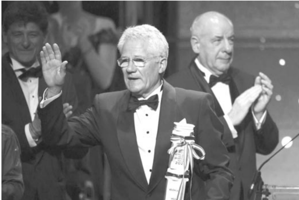
Az életműdíjjal kitüntetett Bölöni László az M4 Sport – Az Év Sportolója gálán a Magyar Állami Operaházban 2025. január 13-án. Mellette Sulyok Tamás magyar köztársasági elnök (j)

Az év közösségi sporteseménye kategóriában a Kárpát-medencei Egyetem Kupája érdemelte ki az elismerést.