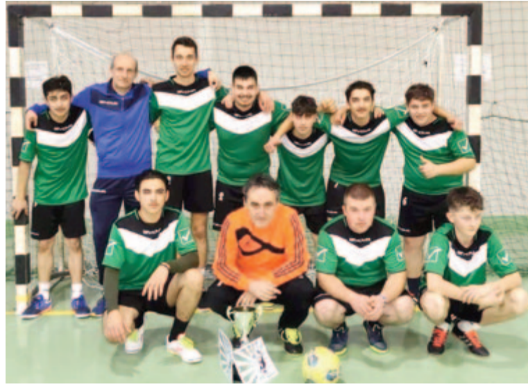
Idén a DK szerezte meg a bajnoki címet