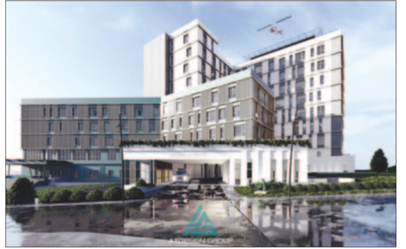
A városi kórház látványterve

– Az nem kétséges, hogy gazdasági válság van, hiszen a szászrégeni önkormányzat többéves pozitív mérleg után tavaly deficitel zárta az évet. A héából származó visszaosztásokból tavaly – a 2023-as évhez viszonyítva – az önkormányzat 5 millió lejjel kevesebbet kapott. Ez tükrözi, hogy gazdasági válság van, csökkentek a gazdasági egységek általi állami befizetések. Egyet-értünk azzal, hogy csökkenteni kell az állami apparátust, de ezt Bukarestben kellene kezdeni, nem helyi szinten, hiszen a kisebb városokban vagy akár a községekben szakszemélyzethiány van; konkrét eset: megüresedett állásra nem kaptunk munkatársat. Már nem vonzó a közszféra-ban dolgozni. Nekünk meg, amint említettem, folytatni kell a munkát. Ami kevésbé látványos,