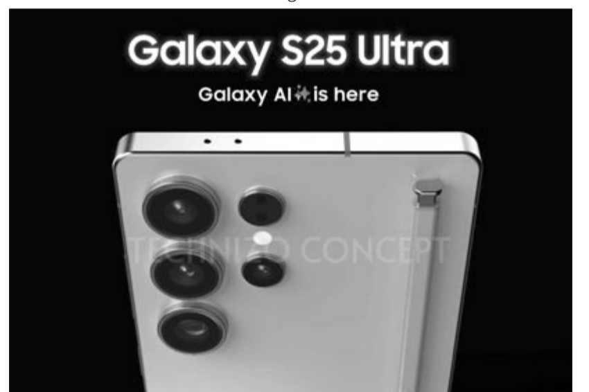
Samsung Galaxy S25 Ultra

Több Samsung-felhasználóval beszélgetve az az általános vélekedés, hogy csalódtak az ideai felhoztalban. Többen, akik eddig évente váltottak új eszközre, idén azt vallották, hogy semmiképpen nem fogják megvásárolni az új készüléket.