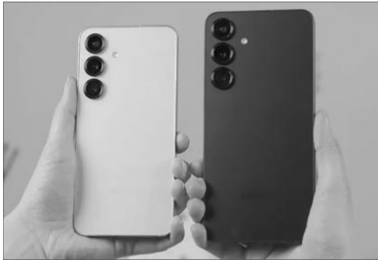
Samsung Galaxy S25 és S25+