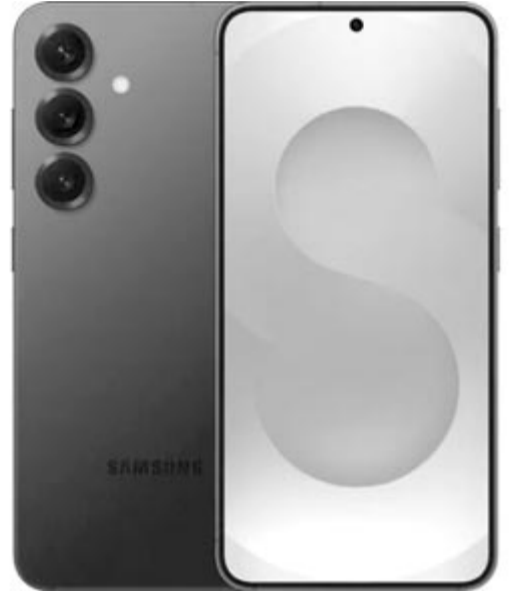
Samsung Galaxy S25, az alapmodell

További mesterséges intelligencia alapú frissítés, hogy lehet bekarikázással keresni, ez a funkció eddig is elérhető volt, viszont mostantól állítólag jobban meg fogja érteni, jobban fel fogja ismerni, hogy a felhasználó mit karikázott be a képernyőn. Továbbá az új készülékek esetében a felhasználóknak elég