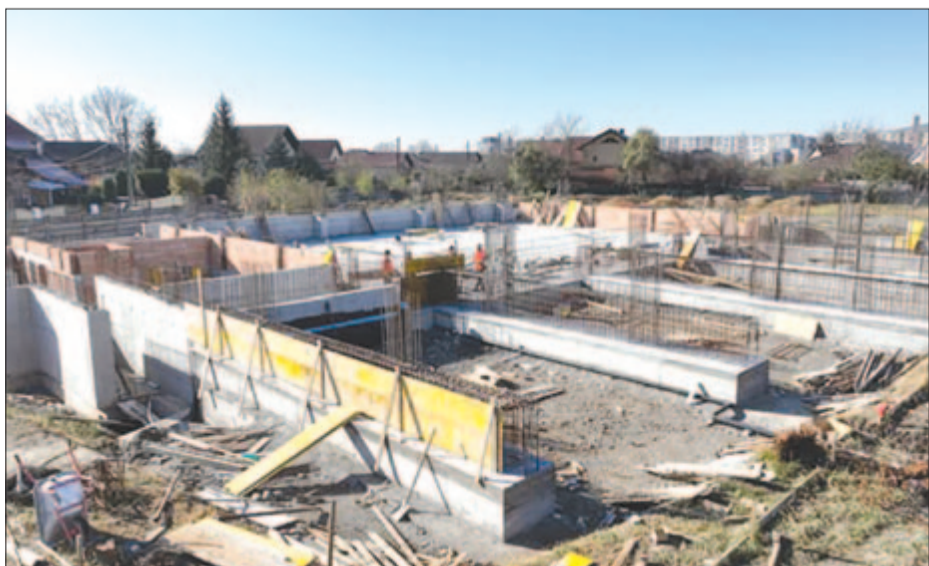
Épül a tanuszoda

E társult projektnél, amelyet szintén az Angel Saligny-kiírás keretében valósíthatunk meg, annyi változott, hogy a támogatást az építkezésre fordítjuk, míg az Ifjúsági parkot önrészként, az önkormányzat finanszírozásával újítjuk fel. Tervezzük a parkban levő városi strand felújítását is – hogy csak néhányat említsék azon munkálatok közül, amelyeket folytatunk az idén, illetve szándékunkban áll elindítani. Szeretnénk tartani a városfejlesztésben a 2020-as ritmust. Az önkormányzat részéről a polgármesteri hivatal személyzetének megvan az akarata és a megfelelő hozzáállása. Úgy érzem, hogy sikerült jó hangulatot teremteni a városban, és az emberek megértik, hogy nemzetiségtől függetlenül értük dolgozunk. A kialakult gazdasági-társadalmi helyzetben több megértésre, szolidaritásra van szükségünk a városlakók részéről, és közösen sikerülhet megvalósítani mindazt, amit elterveztünk.