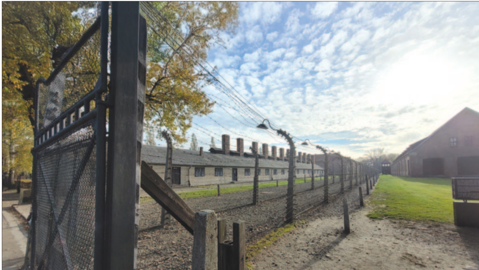
Az auschwitzi haláltábor