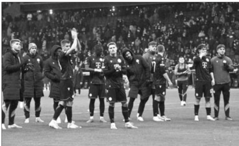
A Ferencváros játékosai megköszönik a szurkolást a labdarúgó-Európa-liga hetedik fordulójában játszott Eintracht Frankfurt - Ferencvárosi TC mérkőzés után a frankfurti Deutsche Bank Park Arénában 2025. január 23-án. A német csapat 2-0-ra győzött.

* Francia Ligue 1, 19. forduló: Strasbourg – Lille 2-1, Nantes – Lyon 1-1, Toulouse – Montpellier HSC 1-2, Auxerre – St. Etienne 1-1, Lens – Angers 1-0, Paris St. Germain – Reims 1-1, Nice – Olympique Marseille 2-0, AS Monaco – Stade Rennes 3-2, Le Havre – Brest 0-1. Az élcsoport: 1. Paris St. Germain 47 pont, 2. Olympique Marseille 37, 3. AS Monaco 34.